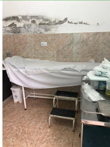
28.8. Sala de Curativo