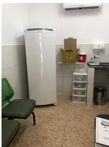
28.4. Sala de Imunização