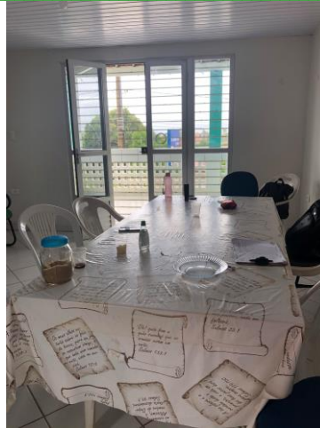
28.13. Copa e Sala de Reunião - 1º andar