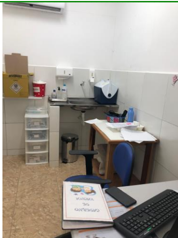
28.3. Sala de imunização