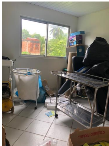
28.14. Depósito - 1º andar