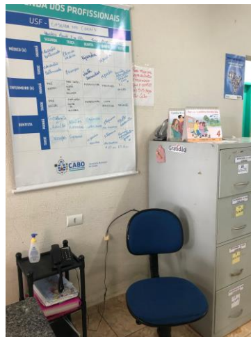
28.2. Arquivo Prontuários na Recepção