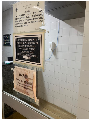
21.1. Entrada do centro cirúrgico