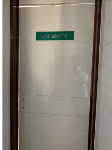
21.3. Vestiário Feminino