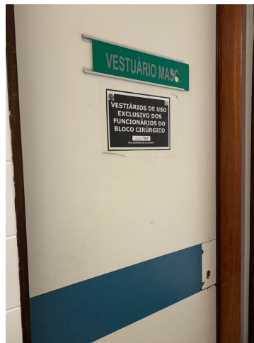
21.2. Vestiário Masculino