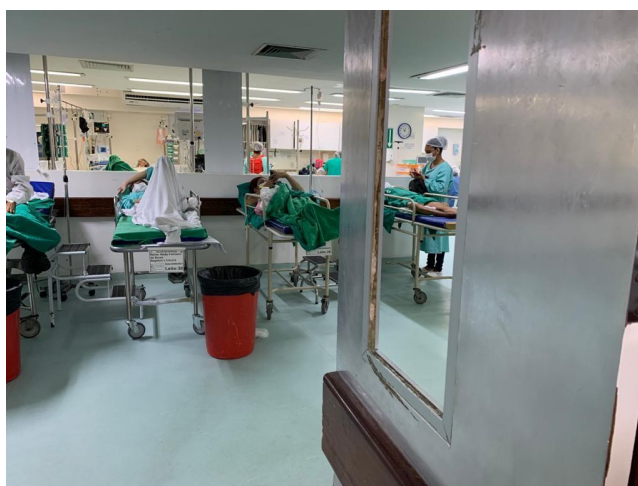
21.9. Entrada pacientes CC e SRPA