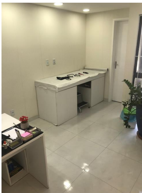
14.1. Consultório com os aparelhos requisitados