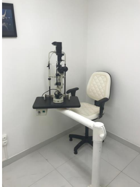
14.3. sala de Oftalmologista