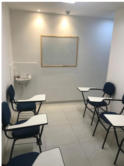
14.6. sala para avaliação psicológica