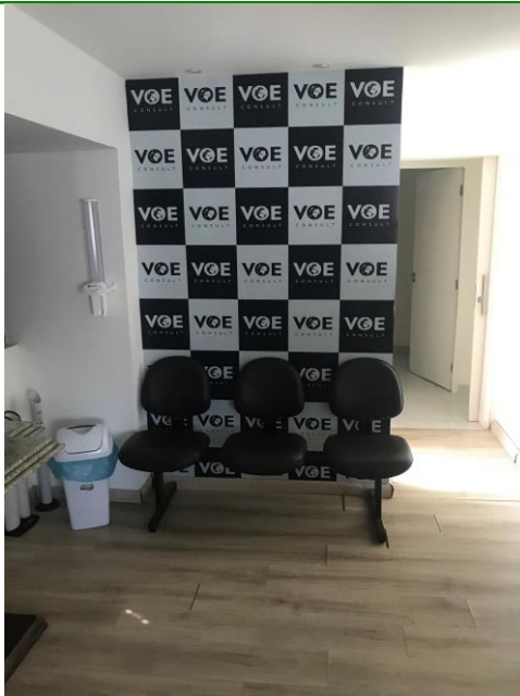
14.7. sala de treinamento