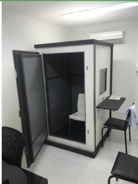
14.5. cabine para exame de audiometria