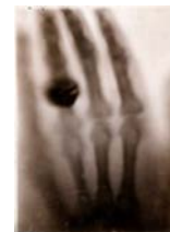
1ª imagem de Raios X: a mão de Bertha, esposa de Röntgen (1895)

Wilhelm Conrad Röntgen recebeu, em 1901, o prêmio Nobel de Física pela descoberta dos Raios X, mas não somente por isso. Röntgen também identificou a capacidade dos Raios X de visualizarem o interior do corpo humano. Röntgen nasceu na Prússia em 1845 e graduou-se em física na Suíça, aos 24 anos. Em 1895, aos 50 anos, então diretor do Instituto de Física da Universidade de Würzburg, na Alemanha, ao fazer experiências com raios catódicos, descobriu um novo tipo de radiação, que se propagava em linha reta, era invisível, atravessava grandes espessuras de matéria e sensibilizava chapas fotográficas.