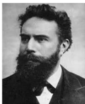
Wilhelm Conrad Röntgen.

Wilhelm Conrad Röntgen recebeu, em 1901, o prêmio Nobel de Física pela descoberta dos Raios X, mas não somente por isso. Röntgen também identificou a capacidade dos Raios X de visualizarem o interior do corpo humano. Röntgen nasceu na Prússia em 1845 e graduou-se em física na Suíça, aos 24 anos. Em 1895, aos 50 anos, então diretor do Instituto de Física da Universidade de Würzburg, na Alemanha, ao fazer experiências com raios catódicos, descobriu um novo tipo de radiação, que se propagava em linha reta, era invisível, atravessava grandes espessuras de matéria e sensibilizava chapas fotográficas.