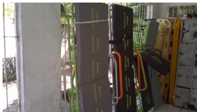
3.3. Local de armazenamento das macas