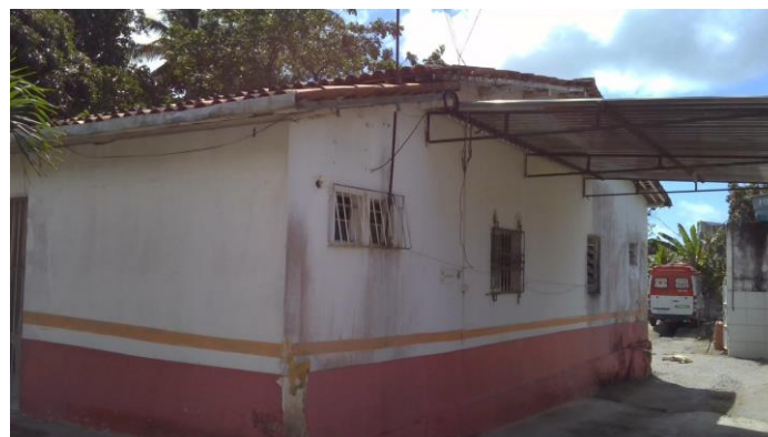
3.2. SAMU IGARASSU