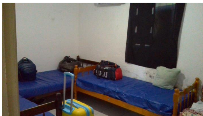
3.8. Repouso (observar istância entre as camas)