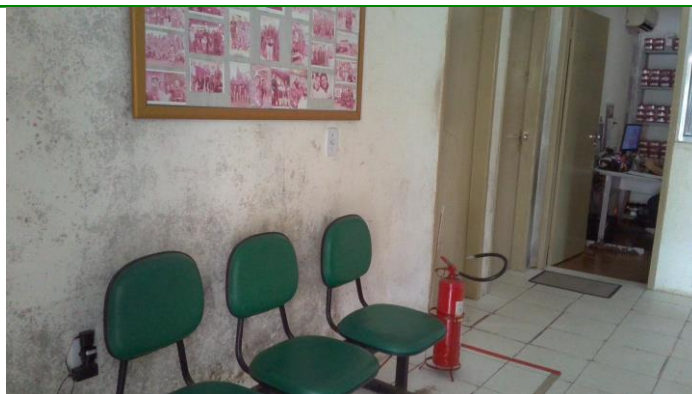
3.4. Recepção (observar infiltração)