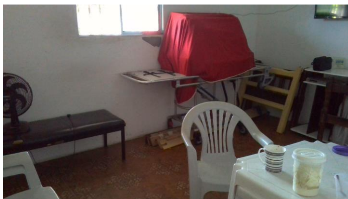
3.5. Sala de estar