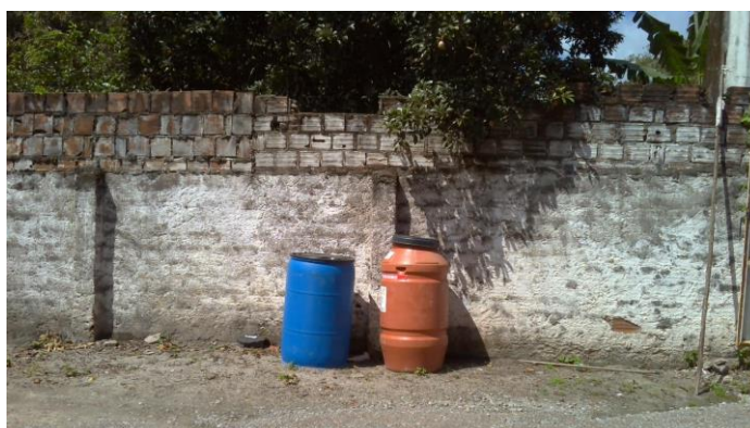
3.12. Local de armazenamento de lixo contaminado