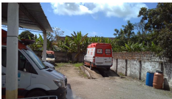
3.9. Pátio das ambulâncias