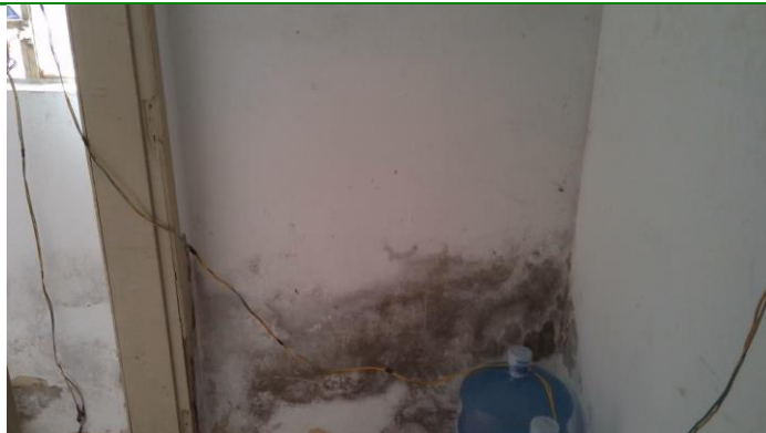
3.13. Infraestrutura precária