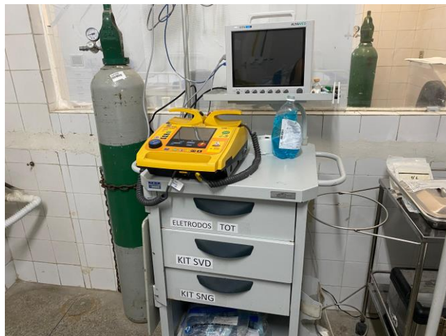
16.29. sala vermelha