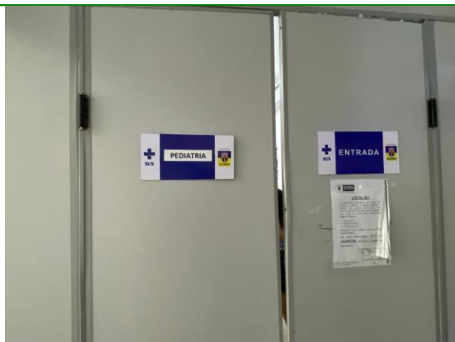
16.13. porta de separação adulto e pediatria