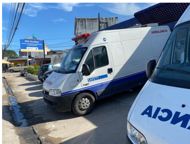
16.12. fachada e ambulancias