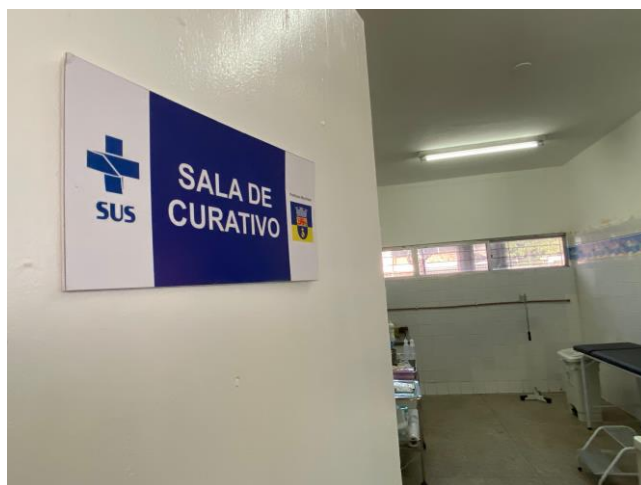
16.22. sala de curativo