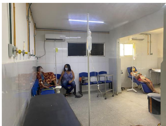
16.4. sala de medicação não covid