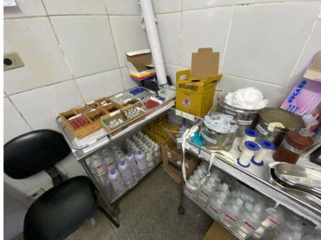
16.28. sala vermelha