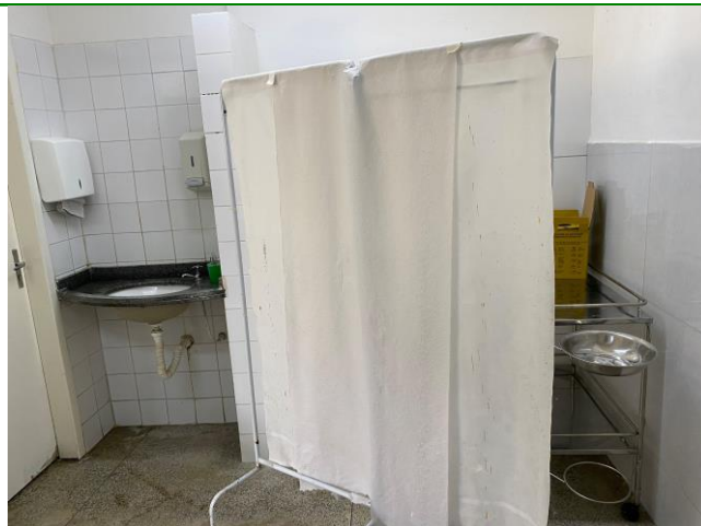
16.3. sala de medicação não covid