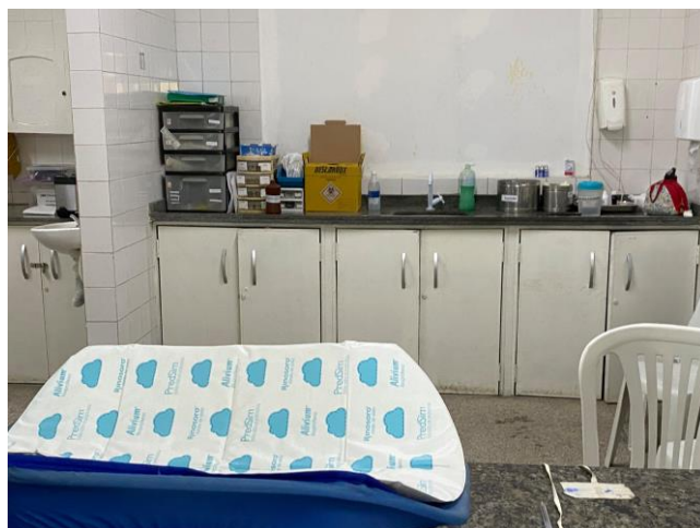
16.11. posto de enfermagem infantil