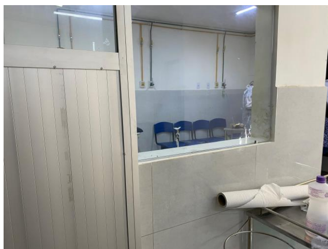
16.1. sala de medicação não covid