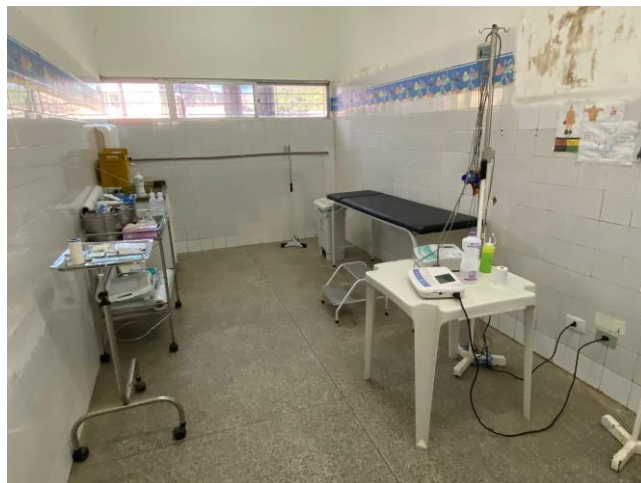
16.24. sala de curativo