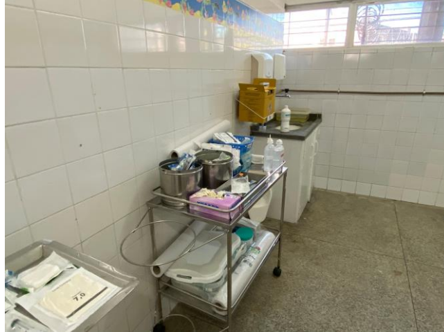
16.23. sala de curativo