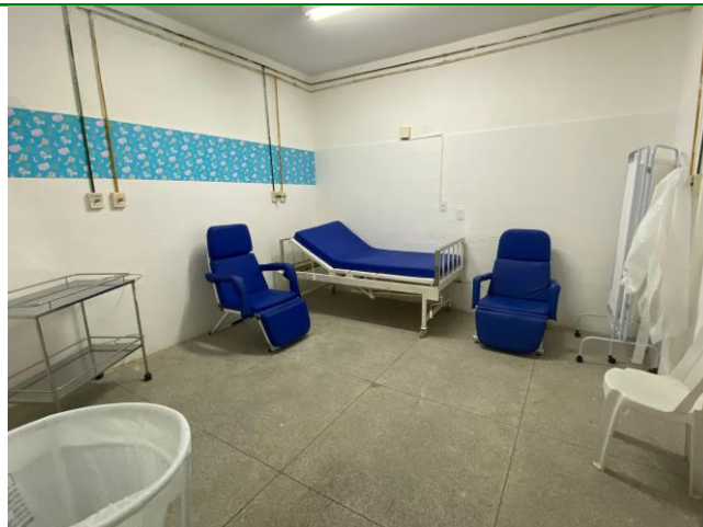
16.33. sala covid pediatria