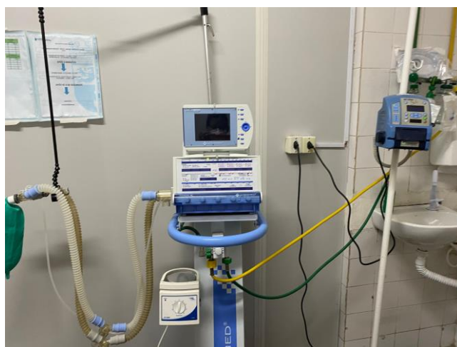
16.31. sala vermelha