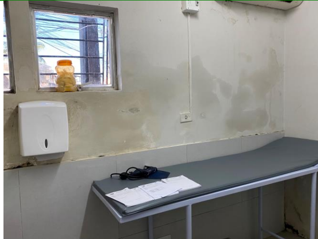
16.8. maca do consultorio