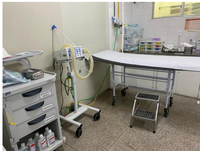
16.27. sala vermelha