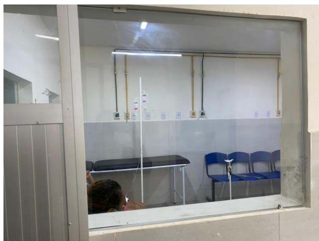
16.2. sala de medicação não covid