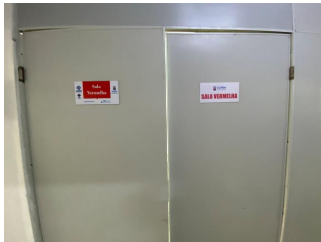
16.26. sala vermelha