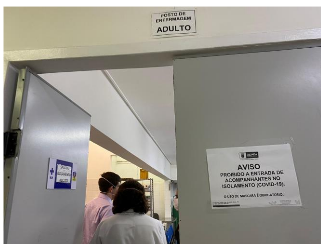
16.14. sala de medicação covid