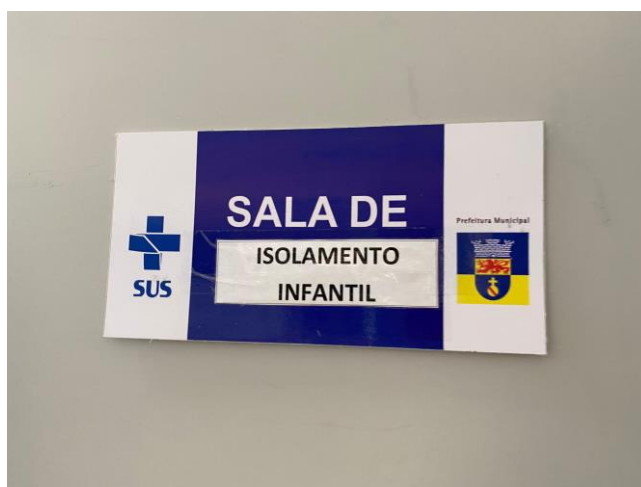
16.32. sala covid pediatria