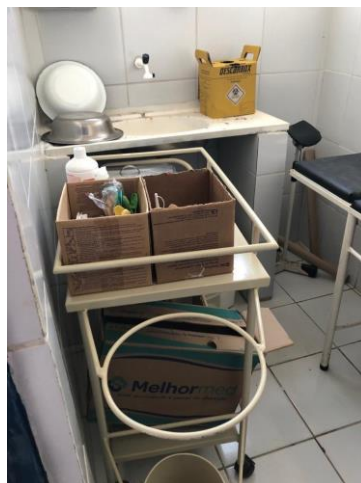
27.8. Sala de curativos