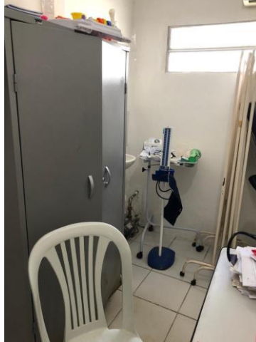
27.3. Consultório médico 2