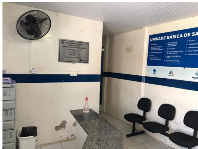
27.6. Recepção e sala de espera