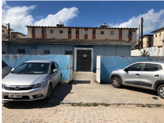
27.1. Entrada da Unidade