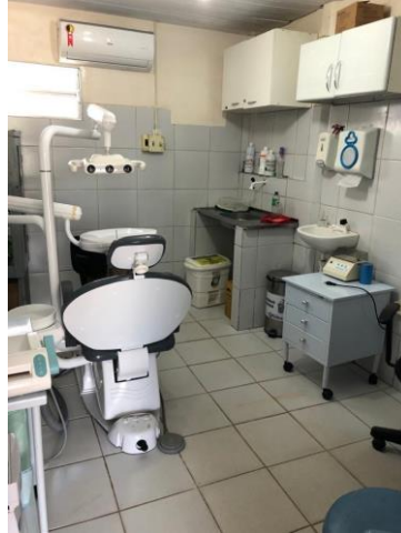
27.7. Consultório odontológico