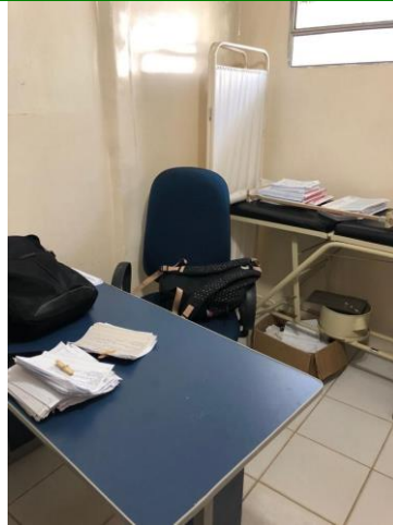
27.5. Consultório enfermagem 2