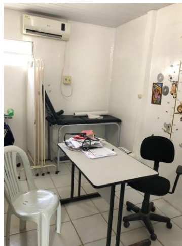
27.2. Consultório médico 1