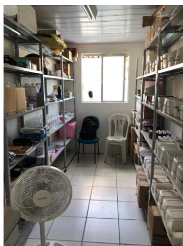
27.7. farmácia 2