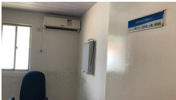
27.13. consultório médico