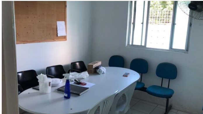
27.22. Sala de reuniões