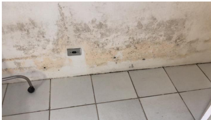
27.18. Infiltrações e mofo