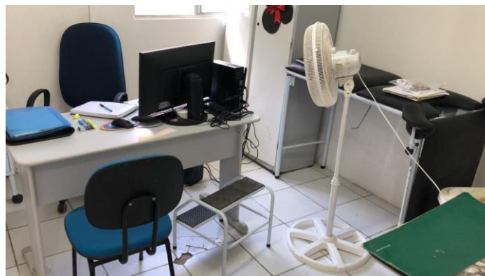
27.24. Consultório de enfermagem 2