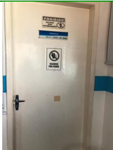
27.6. farmácia 1