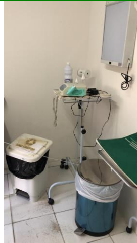
27.23. Consultório de enfermagem