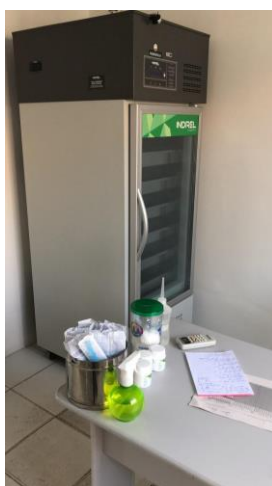
27.12. Sala de vacinação