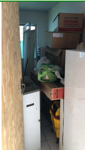
27.11. Materiais depositados desorganizados