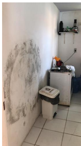
27.19. infiltrações e mofo 2