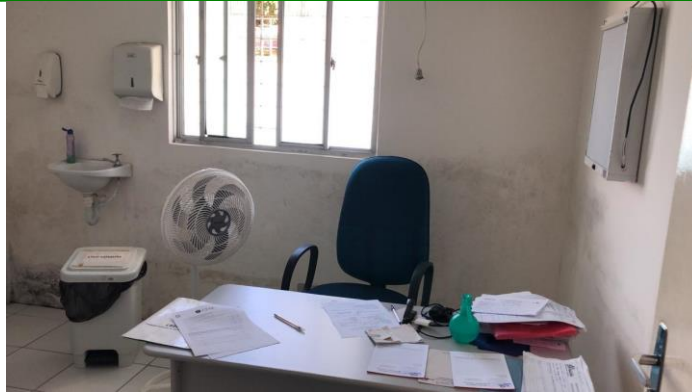
27.14. consultório médico 2