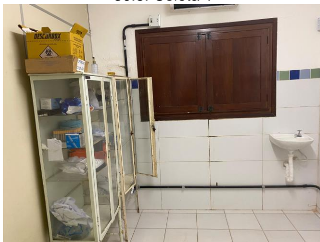
30.6. Coleta 2