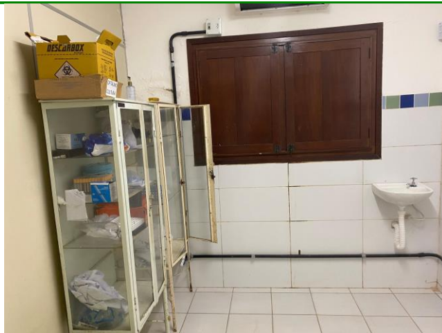
30.5. Coleta 1