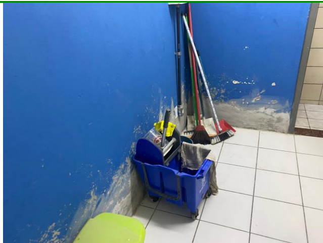
30.17. Material de limpeza