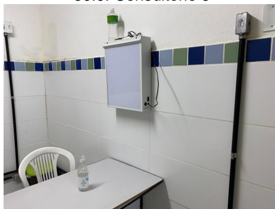
30.10. Consultório 5 - 2