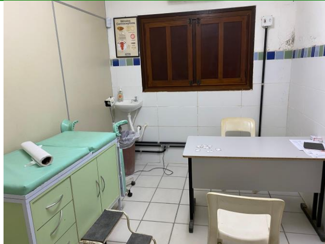
30.11. Consultório Ginecologia (1)