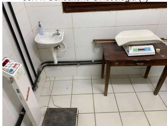
30.12. Consultório Pediatria (1)