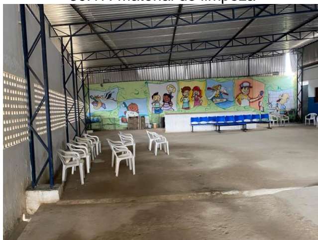
30.18. Recepção (1)