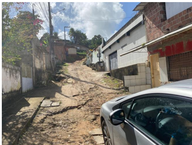
30.1. Acesso à Unidade