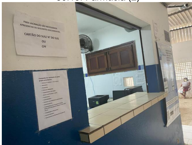
30.16. Marcação (1)