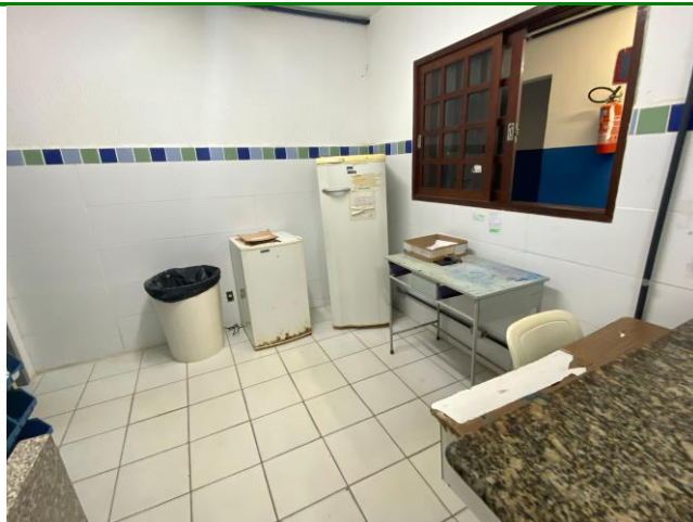
30.14. Farmácia (1)