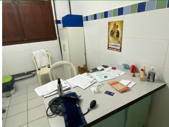
30.8. Consultório prevenção e pré-natal (2)