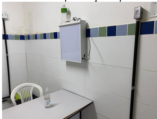
30.9. Consultório 5