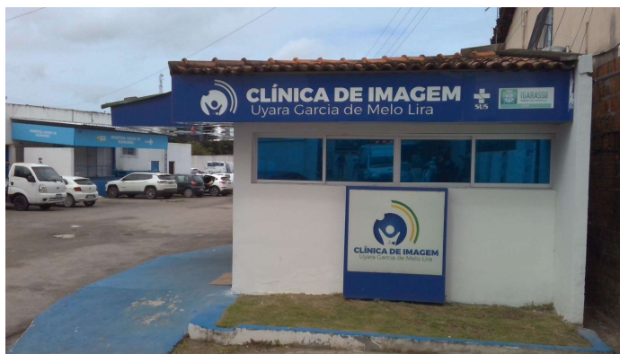
5.1. Clínica de Imagem Uyara Garcia de Melo Lira