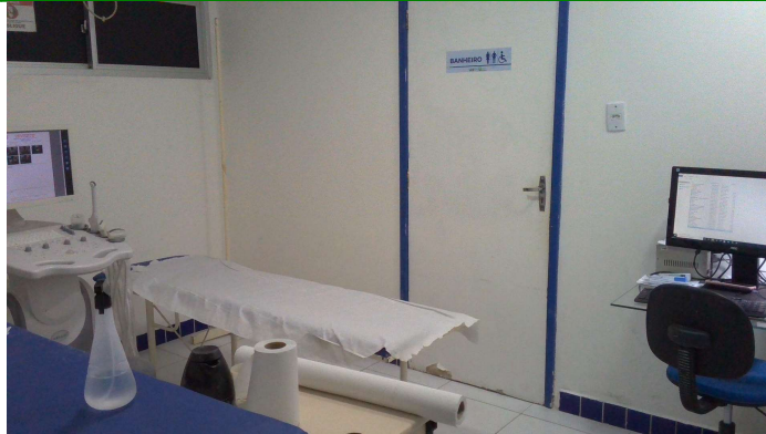
5.4. Sala de ultrassonografia com banheiro anexo