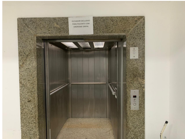
17.6. elevador covid