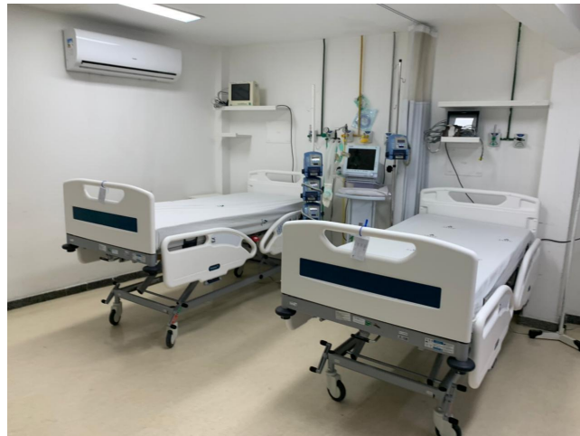
17.7. sala vermelha