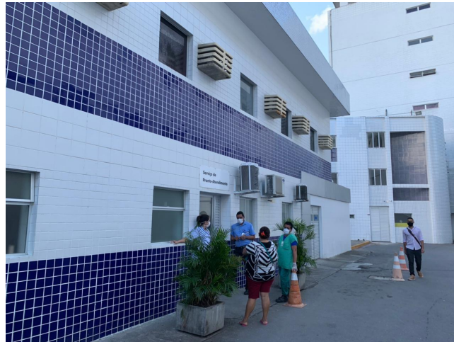
17.1. Entrada do SPA