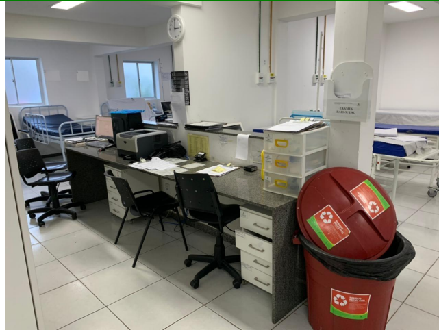
17.8. posto de enf de leitos de obs