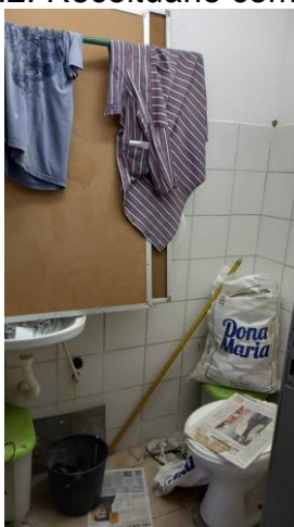
29.3. Área física adequada para o que se propõe