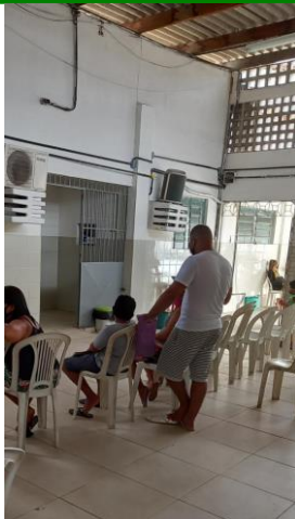
29.4. Recepção / Sala de espera