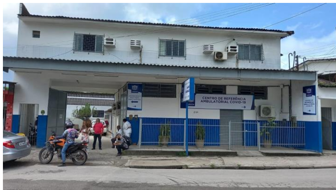
29.1. Publicidade externa / Fachada