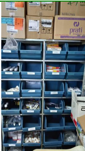
29.11. No momento da vistoria, foi observada a falta de vacinas