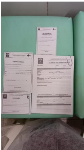
29.2. Receituário comum