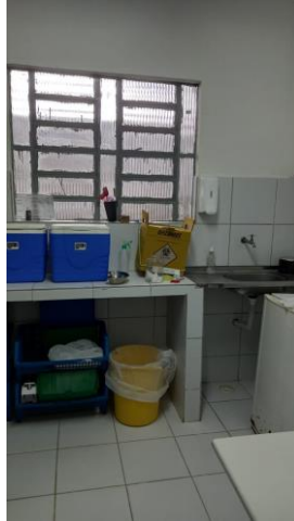
29.8. Sala de imunização / vacinação