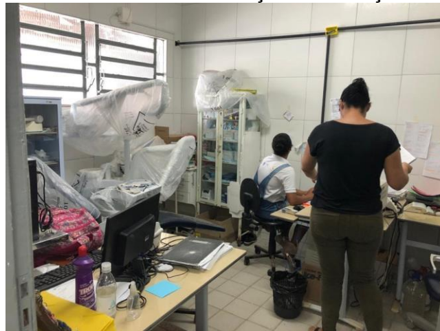
29.9. Consultório Odontológico