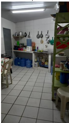
29.12. Mesa para refeições