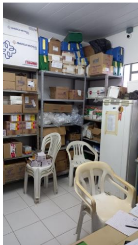
29.10. Armários com chave