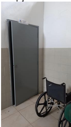
29.5. Local para macas e cadeira de rodas

Imagem indisponível. (farmacia-1.jpeg - Farmácia ou sala de dispensação de medicamentos)