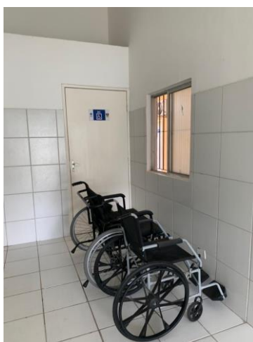
26.9. Cadeiras de roda