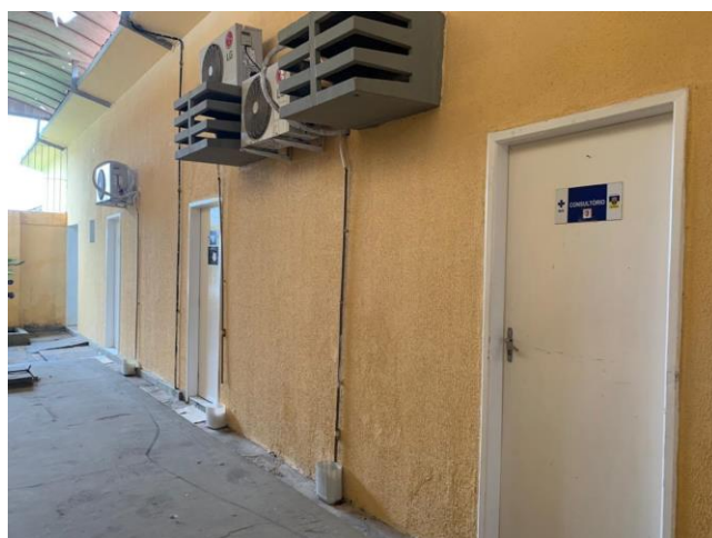
26.4. Consultório médico