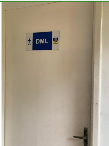
26.8. O serviço é próprio