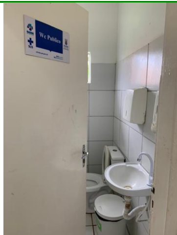
26.18. Banheiro público