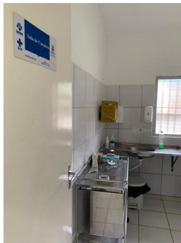
26.12. Sala de Curativo