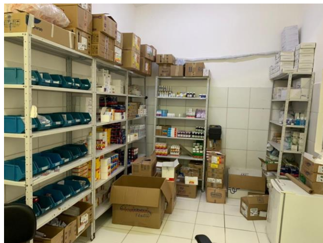
26.14. Farmácia 01