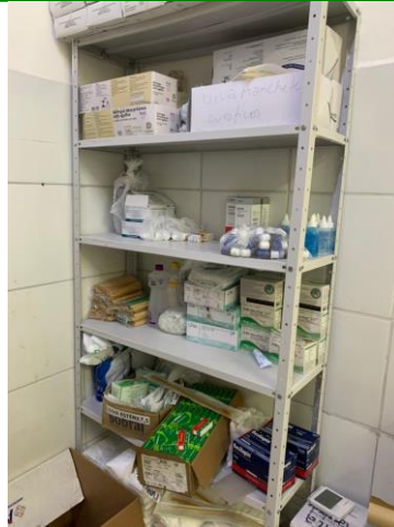
26.13. Materiais descartáveis