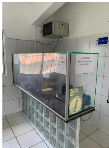
26.2. Sala de recepção / arquivo