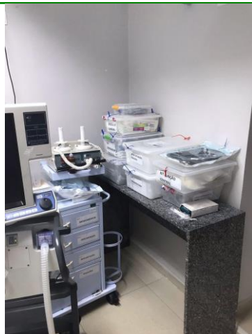
12.3. carrinho de parada, desfibrilador e kits de procedimentos