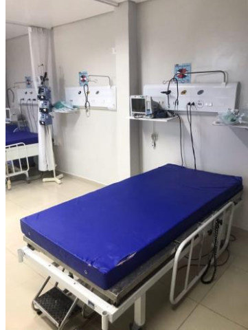
12.8. leito de uti em bom estado de conservação, com monitor e gases encanados.