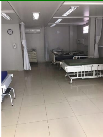
12.10. leitos de uti com distanciamento adequado.