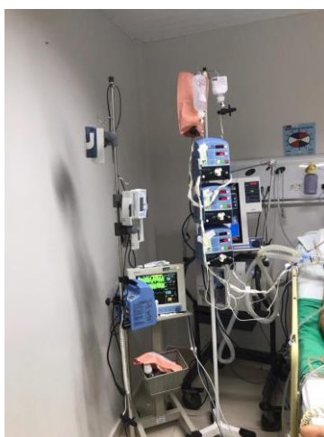
12.11. UTI covid com bombas de infusão e monitor em uso e bom estado de funcionamento.