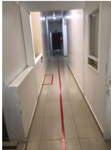
12.1. corredor com sinalização