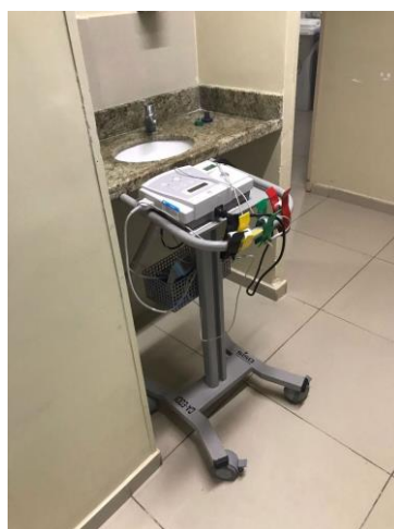
12.4. carro de ECG