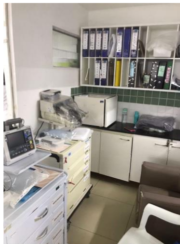
12.2. guarda de prontuários e kits de procedimentos