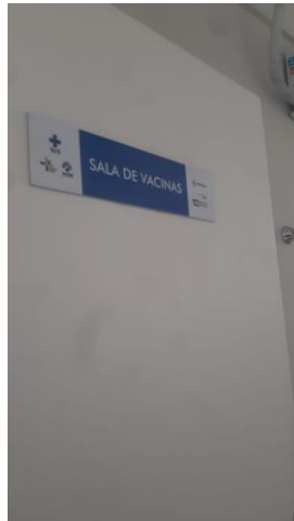
18.1. Sala de vacinação 1