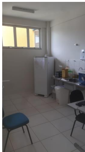
18.2. Sala de vacinação 2