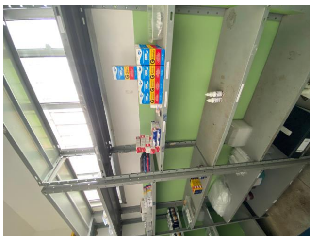
25.14. Falta de medicamentos