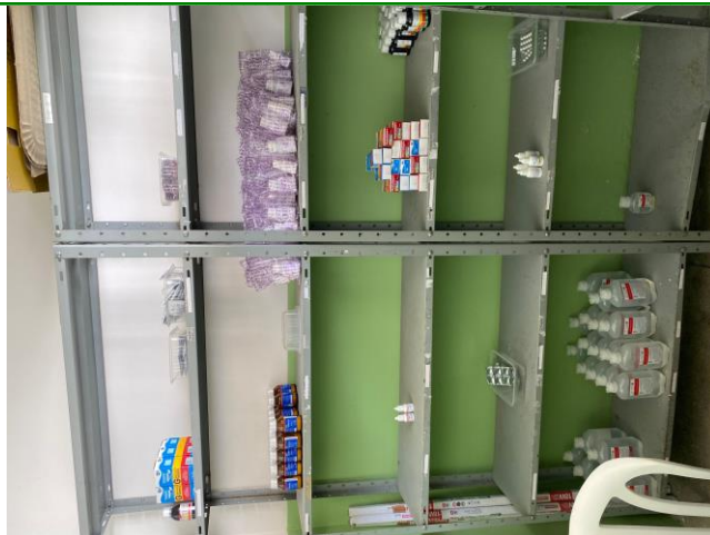
25.13. Falta de medicamentos