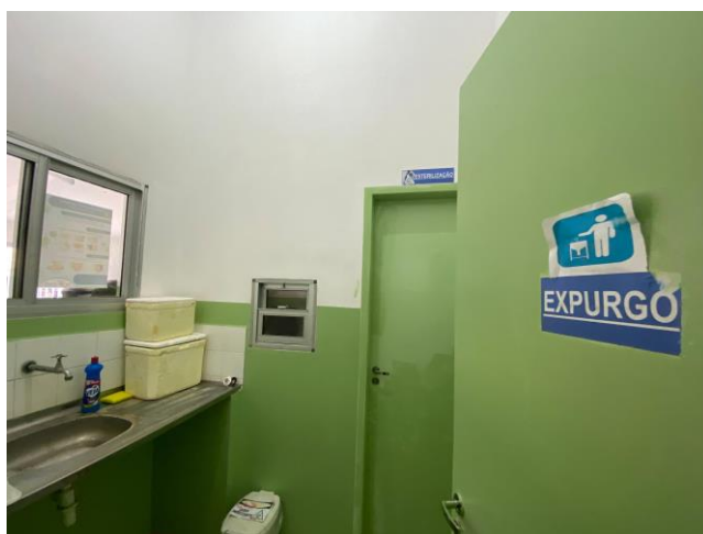
25.9. Sala de Expurgo