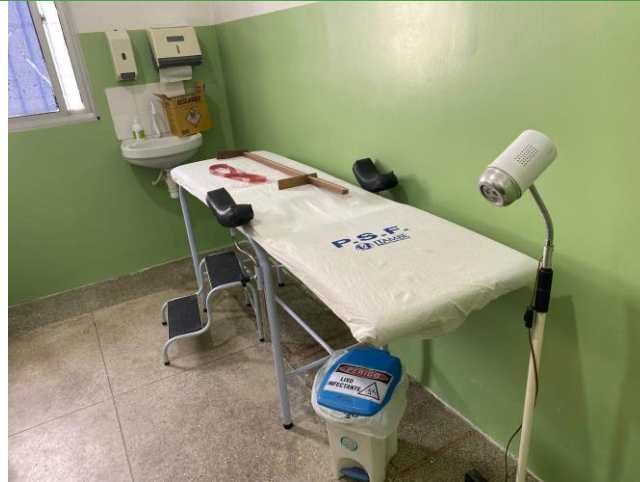
25.3. Mesa para Coleta de Material ginecológico, sem privacidade e sem banheiro na sala