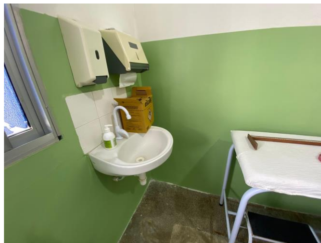
25.4. Cons. de Enfermagem