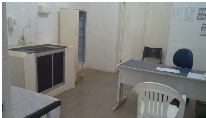
21.11. Consultório médico