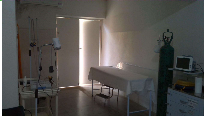
21.4. Sala vermelha (observar DEA, monitor multiparâmetros e eletrocardiógrafo)