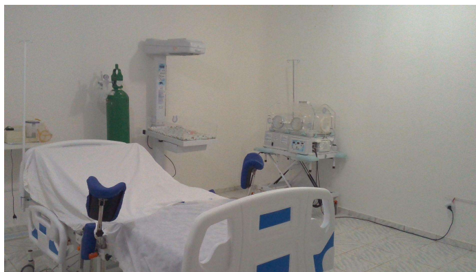
21.9. Sala de parto