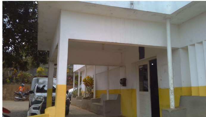
21.1. Maternidade Unidade Mista Santa Rita