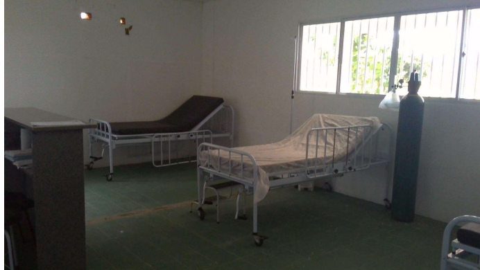
21.10. Setor covid