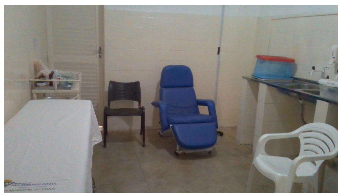
21.3. Sala de procedimentos