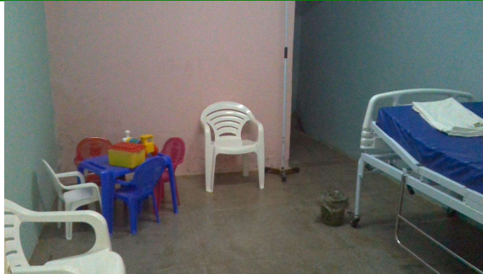
21.7. Sala de observação pediátrica