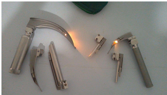
21.5. Laringoscópio adulto e pediátrico