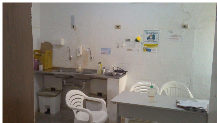
21.2. Sala de medicação e triagem