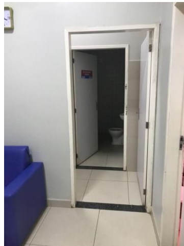
25.2. Banheiro do estar dos funcionários