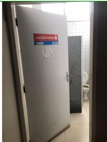
25.13. Sanitário pacientes