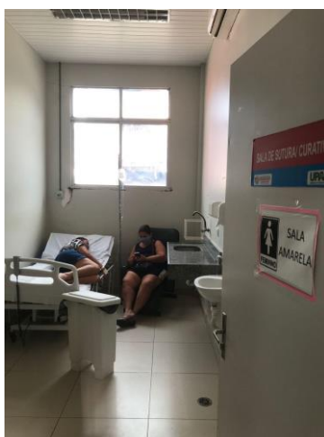
25.4. sala amarela adaptada