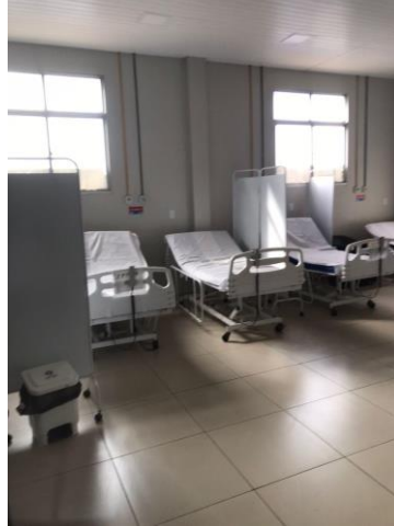
25.23. Sala de medicação da área covid