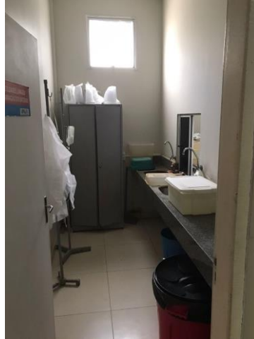
25.18. Sala de material contaminado