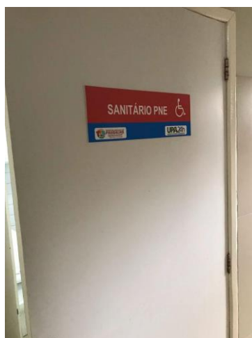
25.14. Sanitário pessoa com deficiência