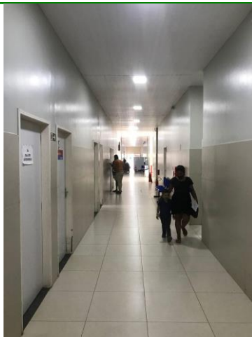
25.8. Corredor da área não crítica