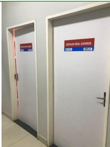
25.3. Quarto de repouso