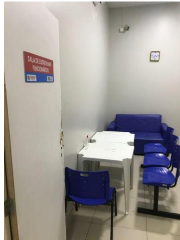
25.1. Sala de estar dos funcionários