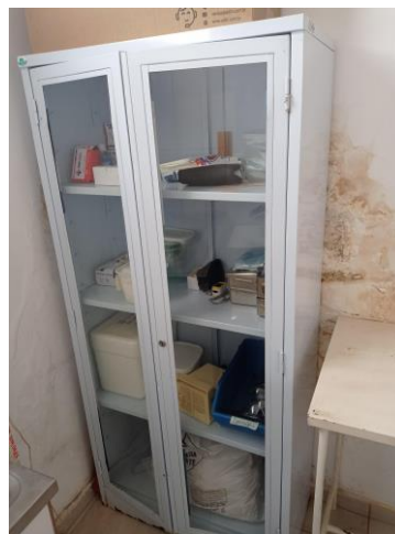
27.9. ARMÁRIO AMBULATÓRIO