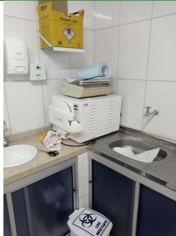
27.28. ESTUFA ACOMODADA NO CONSULTÓRIO ODONTOLÓGICO