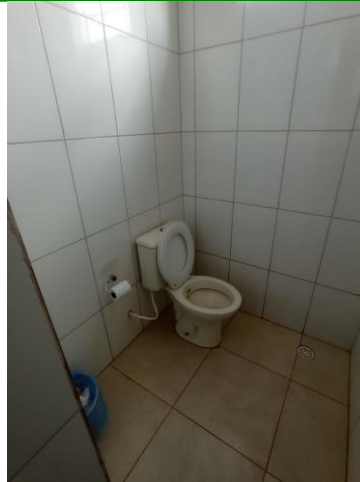
27.18. INTERIOR WC FUNCIONÁRIO