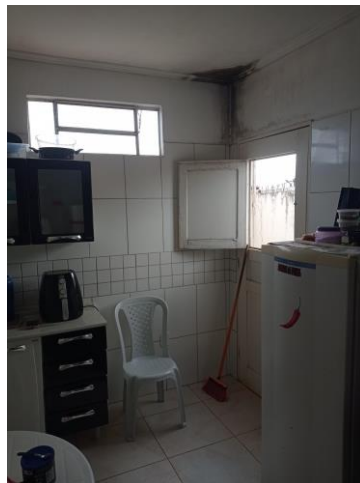
27.34. INFILTRAÇÃO NA ÁREA DE COZINHA