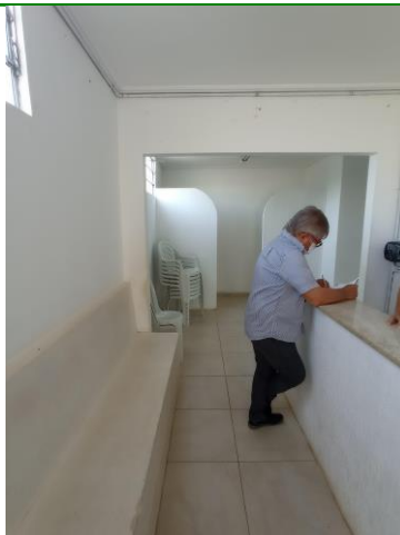
27.3. SALA DE ESPERA