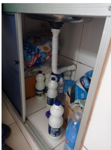
27.24. CONTINUAÇÃO DO DML