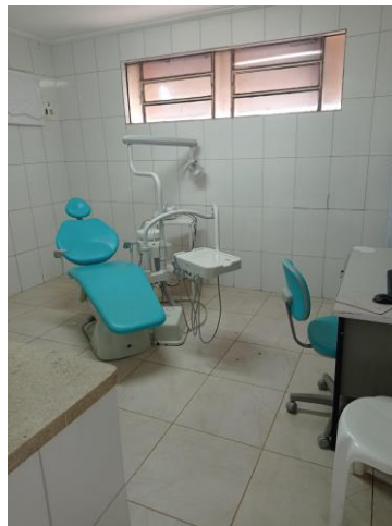
27.29. INTERIOR DO CONSULTÓRIO ODONTOLÓGICO