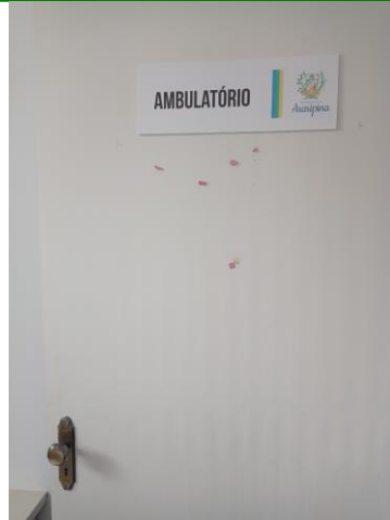
27.8. ENTRADA AMBULATÓRIO