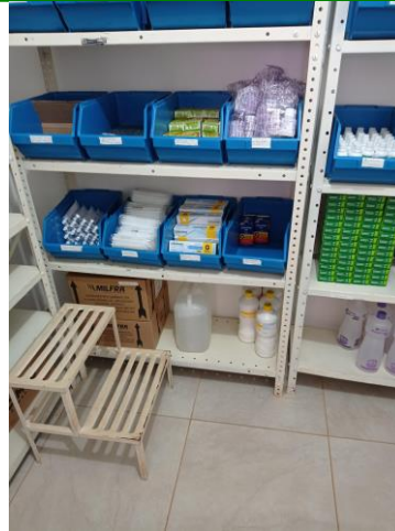
27.13. FARMÁCIA 1