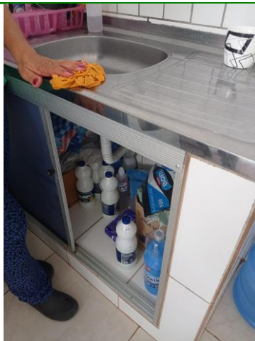
27.23. LOCAL ONDE E FEITO O DML