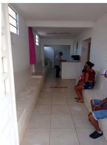
27.4. SALA DE ESPERA E RECEPÇÃO