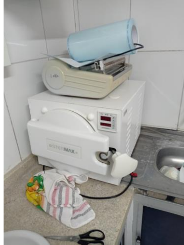
27.33. ESTUFA NO CONSULTÓRIO ODONTOLÓGICO