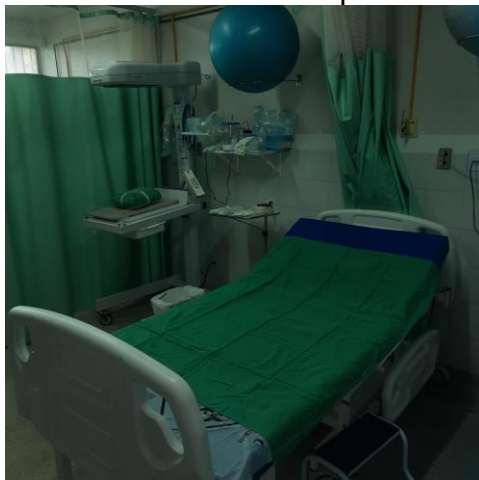
13.9. Leito de Pré-parto