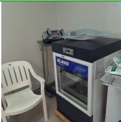
13.10. Miniagência transfusional no bloco obstétrico