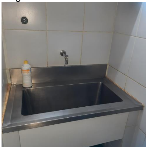
13.11. Lavabo do bloco com materiais descartáveis e acionamento da bica por cotovelo