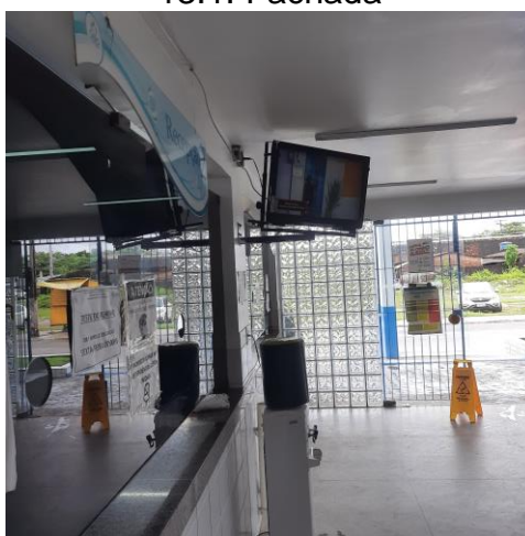
13.2. Sala de Espera e Recepção