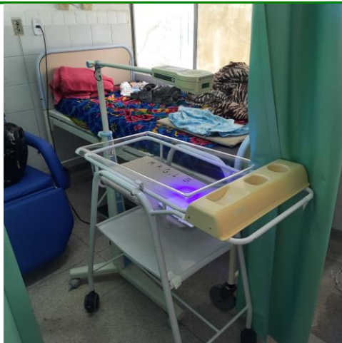
13.4. Leito de Puerpério