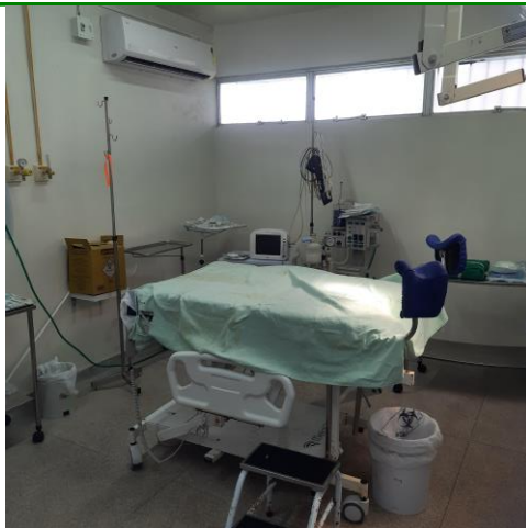
13.7. Sala de parto normal equipada