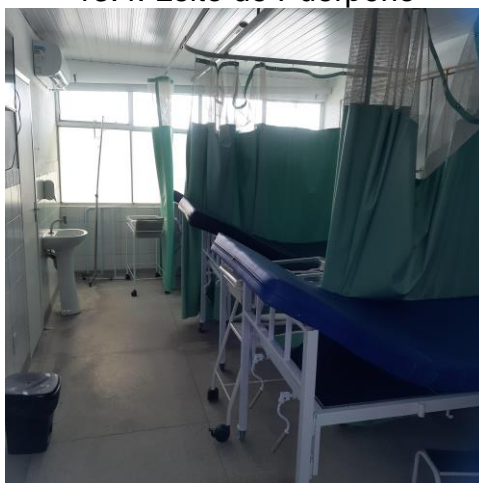
13.5. Enfermaria de puerpério