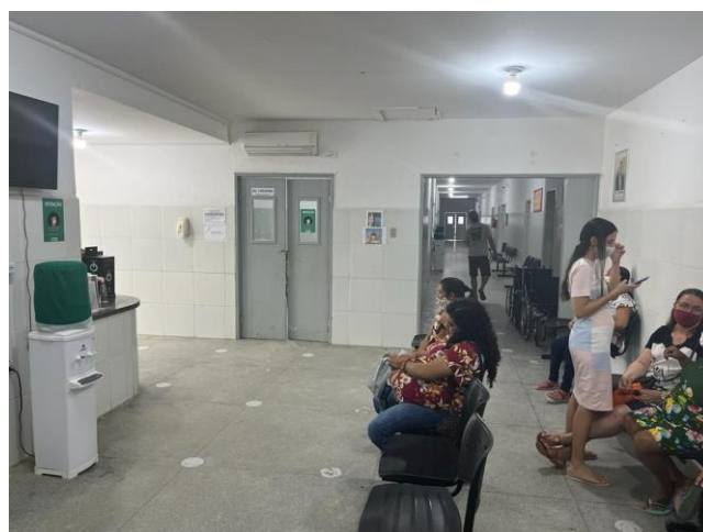
26.7. Sala de espera