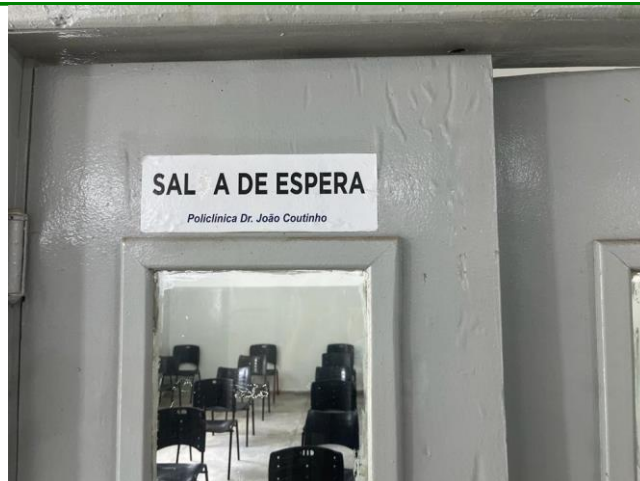
26.6. Sala de espera