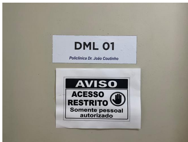
26.2. Sinalização de acessos