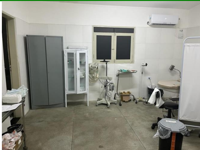
26.11. Saúde da mulher