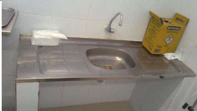
33.13. Sala de procedimentos / curativos