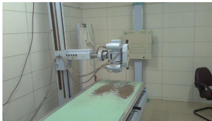
33.17. Sala de raios-x