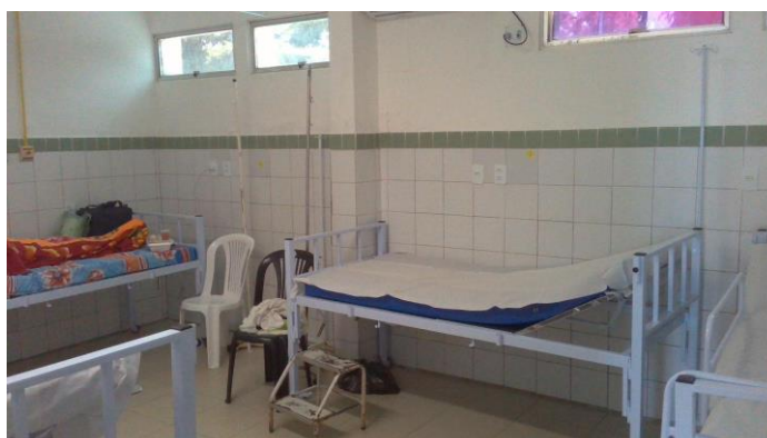
33.15. SALA DE OBSERVAÇÃO