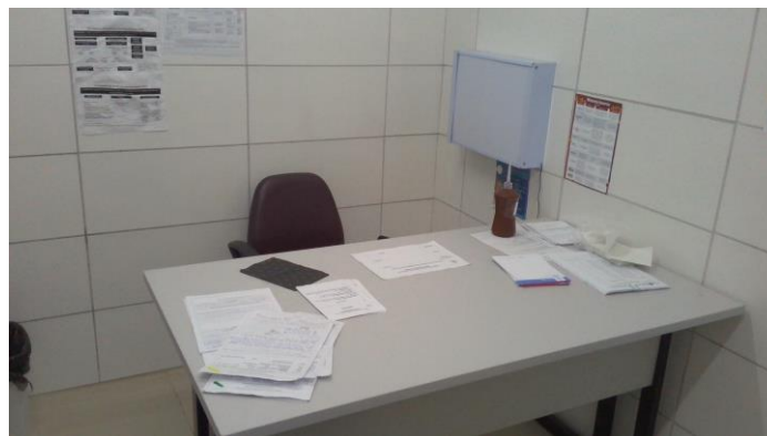
33.5. Consultório médico