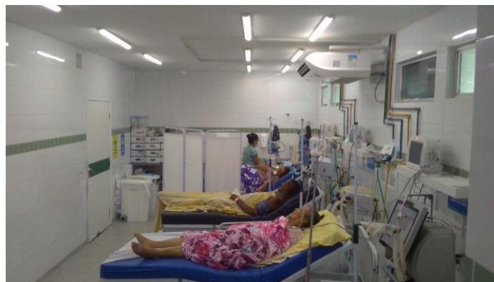
33.11. sala vermelha