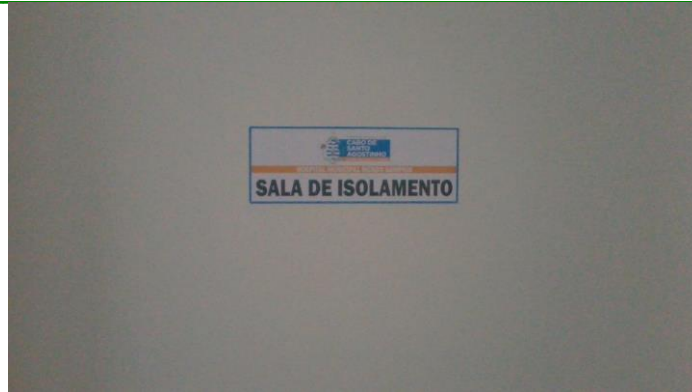
33.16. SALA ISOLAMENTO