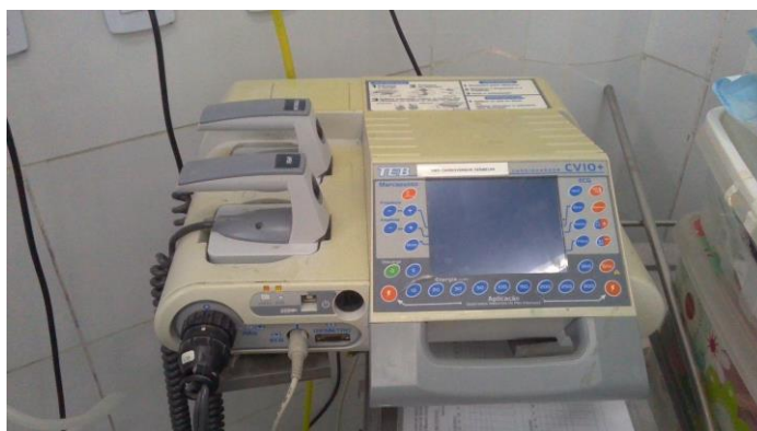
33.9. Desfibrilador com monitor