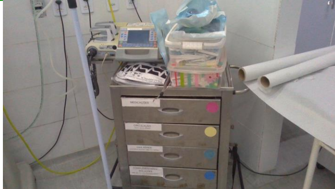
33.7. Carrinho, maleta ou kit contendo medicamentos e materiais para atendimento às emergências