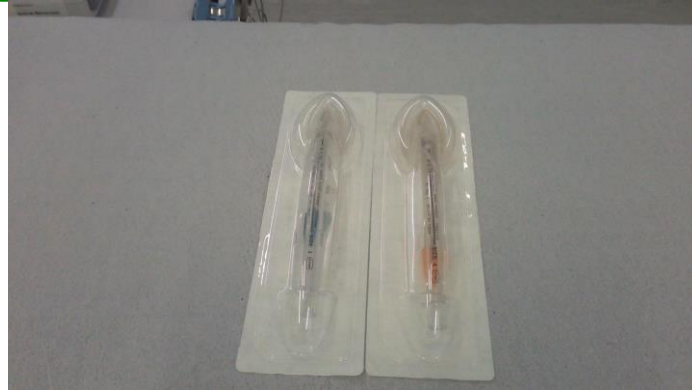
33.10. Máscara laríngea