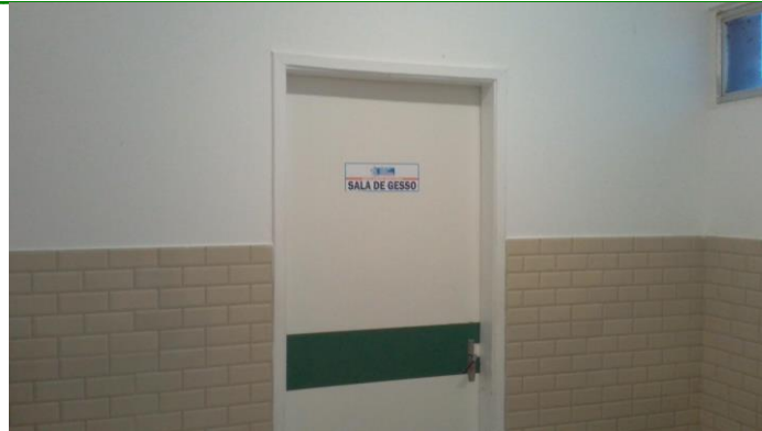
33.4. Sala de gesso