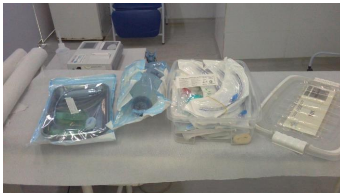
33.8. Cânulas / tubos endotraqueais