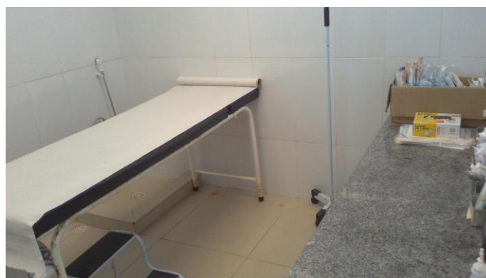
33.12. Sala de procedimentos / curativos