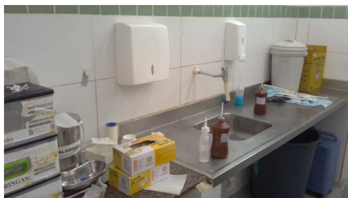
33.6. Pia com água corrente para uso da equipe de saúde