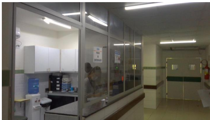
33.14. Posto de enfermagem instalado a cada 12 leitos