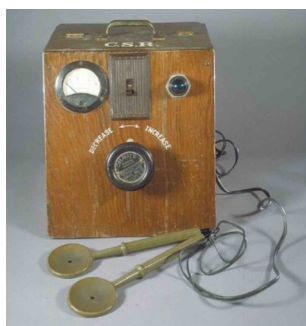
Fig. 1 - Modelo Beck (1947)