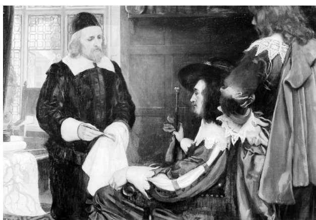
William Harvey demonstrando sua teoria sobre a circulação sanguínea (pintura sobre óleo de Ernest Board).

William Harvey (1578-1657), médico inglês, foi um dos primeiros a descrever como se processa a circulação sanguínea.