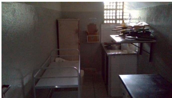
6.3. UBS atingida pela enchente do rio Capibaribe-Mirim