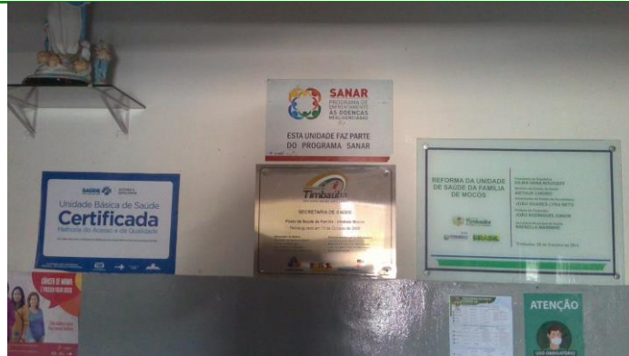
6.4. UBS atingida pela enchente do rio Capibaribe-Mirim