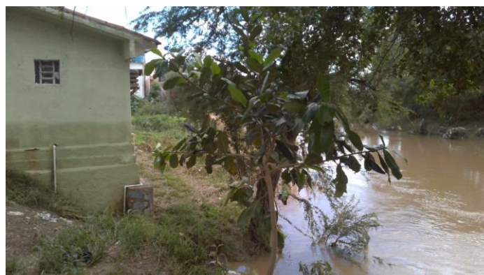
6.6. Rio Capibaribe-mirim e UBS