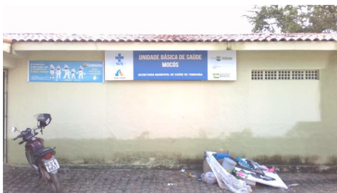
6.1. FACHADA - UBS atingida pela enchente do rio Capibaribe-Mirim