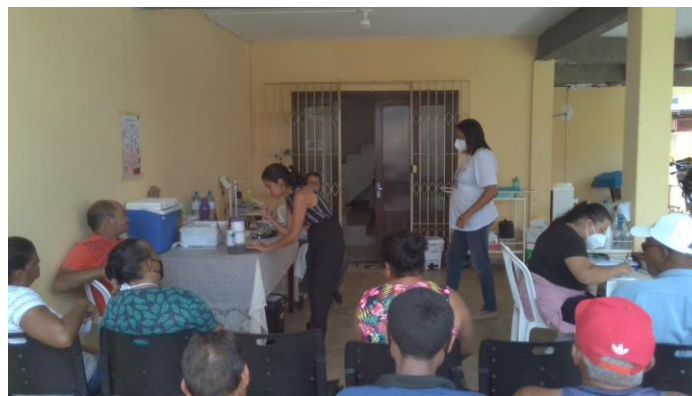
6.5. UBS atingida pela enchente do rio Capibaribe-Mirim - Atendimento provisório em casa particular