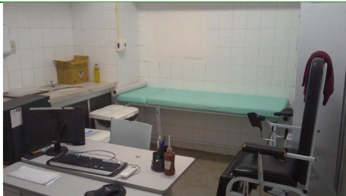
26.4. Consultório médico na sala de coleta