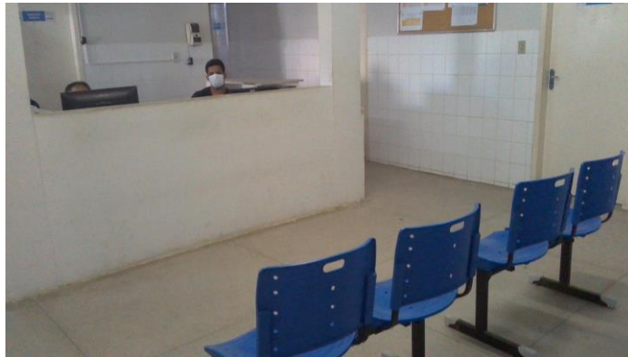
26.1. Recepção / sala de espera