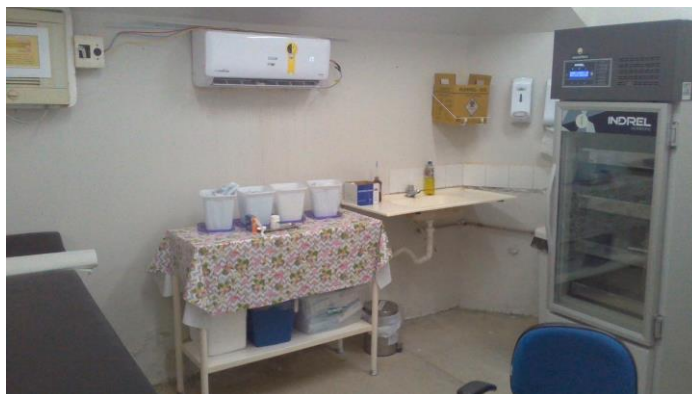
26.8. Dispõe de sala de imunização / vacinação