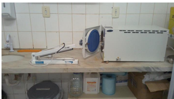
26.6. autoclave e seladora da sala onontologica