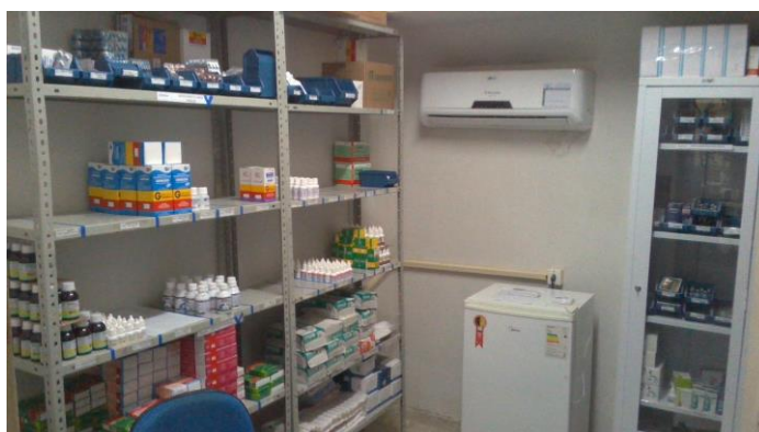
26.9. Armários com chave