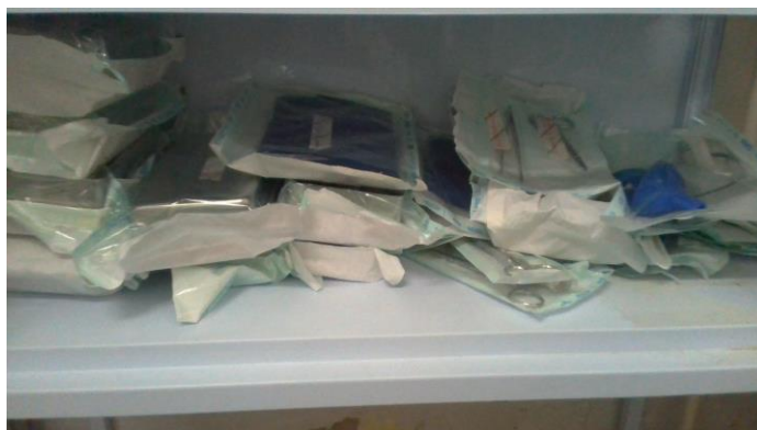
26.5. Material para anestesia local