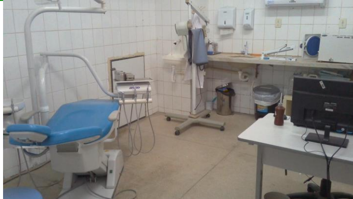
26.7. CONSULTÓRIO ODONTOLÓGICO