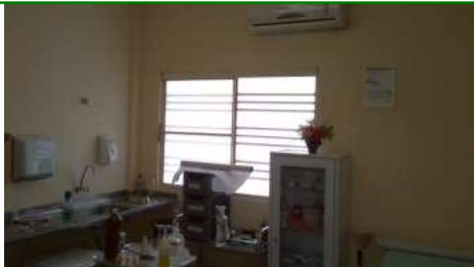
35.10. Sala de Procedimentos / Curativos