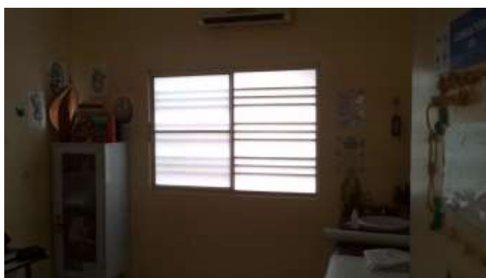
35.2. CONSULTÓRIO 5