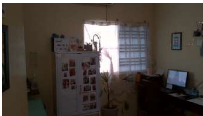
35.3. CONSULTÓRIO 6