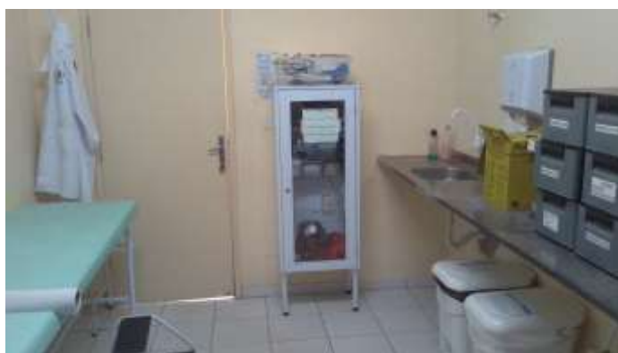
35.12. Sala de reidratação