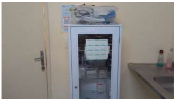
35.11. Sala de reidratação/PROCEDIMENTOS