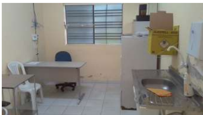
35.9. Sala de Coleta