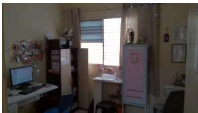
35.1. CONSULTÓRIO 4