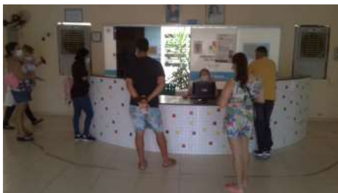
35.8. Recepção / sala de espera