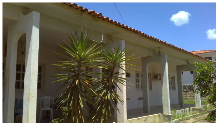
21.2. CAPS I Ouricuri (foto 2)