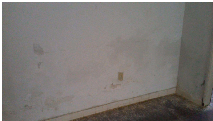
21.11. Paredes com infiltração