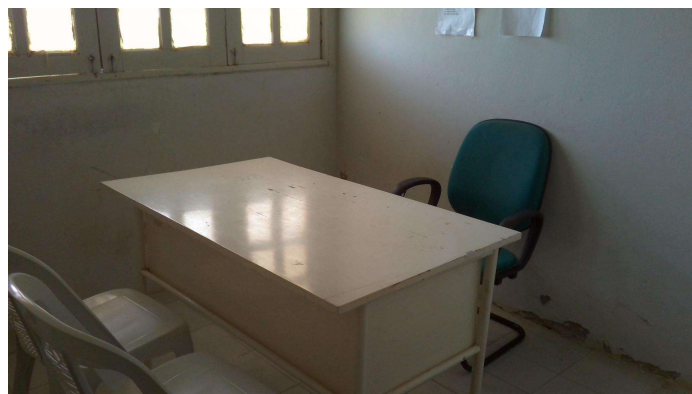
21.3. Sala de atendimento individual