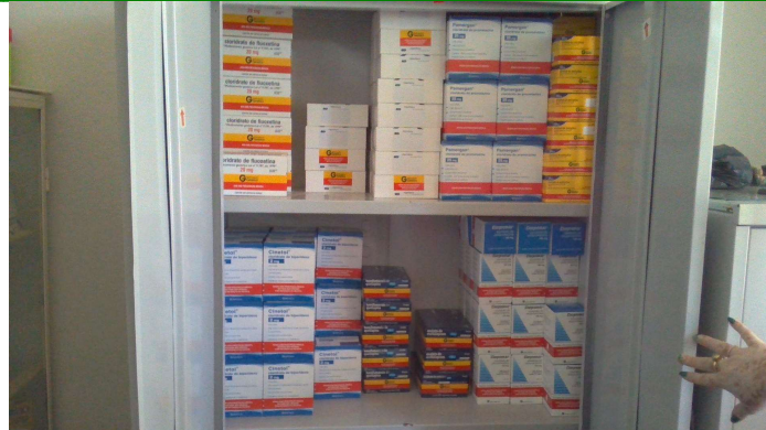
21.7. Medicamentos (foto 2)