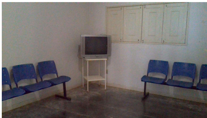
21.12. Recepção 2