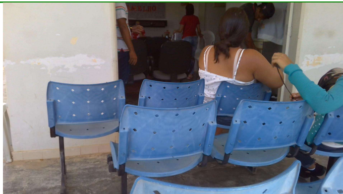
21.4. Recepção e sala de espera