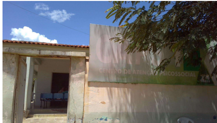
21.1. CAPS I Ouricuri