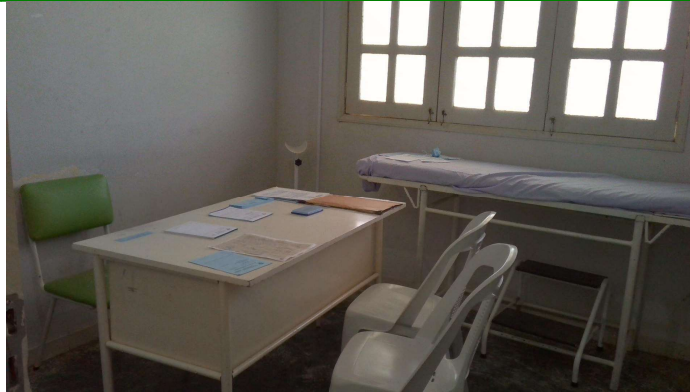
21.13. Consultório médico