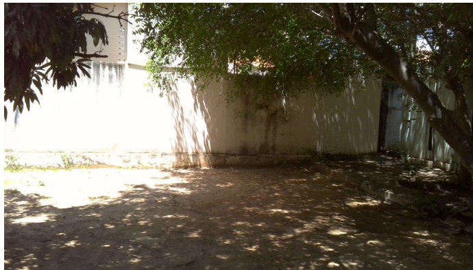
21.14. Local de atendimento dos grupos