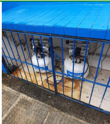
33.11. Abrigo externo para compressores odontológicos