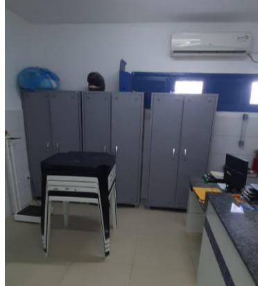
33.9. Armários na recepção guardam prontuários físicos antigos.