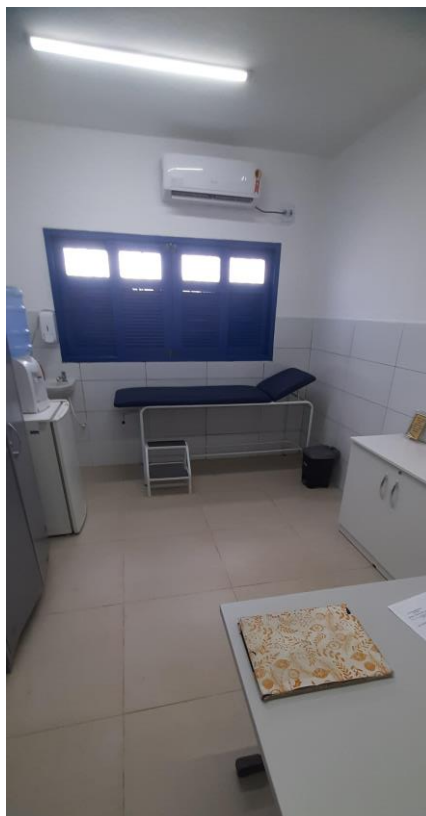
33.2. Consultório de enfermagem