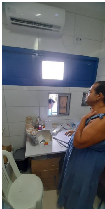
33.6. Dispensação de medicamentos