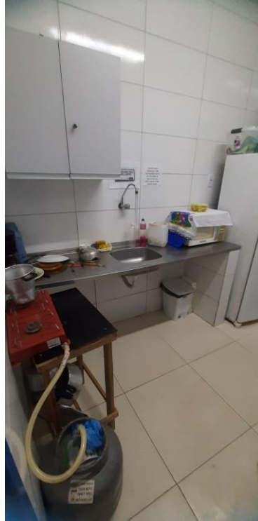
33.7. Copa com botijão de gás no meio