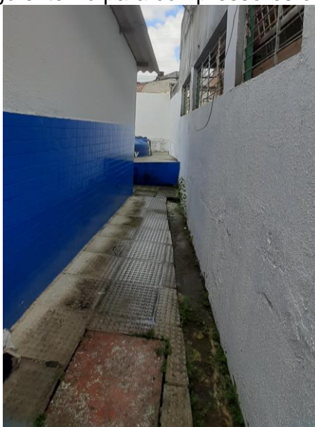
33.12. Corredor lateral da unidade leva a cisterna