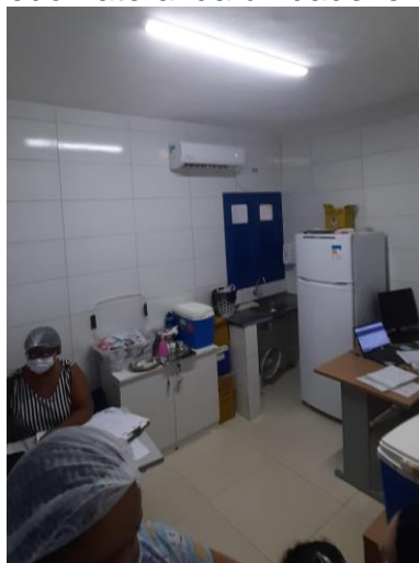
33.13. Sala de vacina comum às 02 equipes, sem bancada