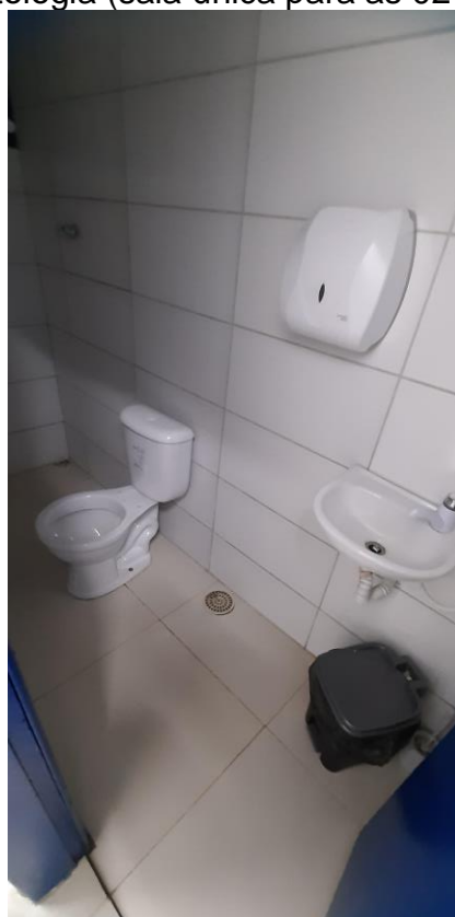
33.4. Banheiro para Funcionários com vaso sem tampa e sem aeração