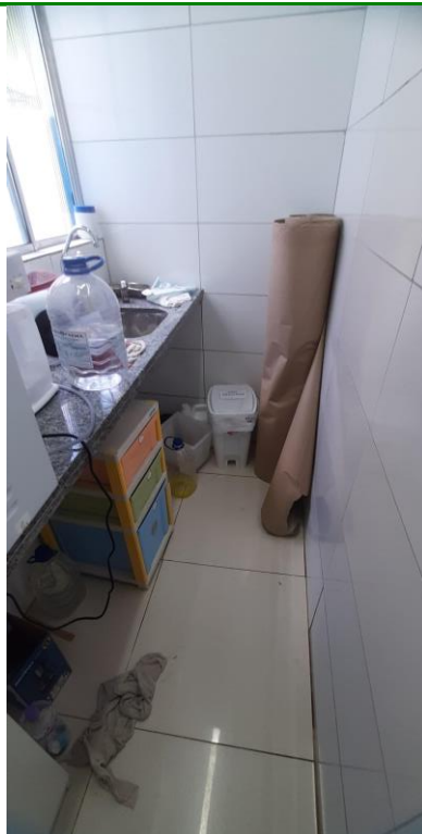
33.14. Esterilização/ Expurgo sem fluxos nem rotinas adequadas.