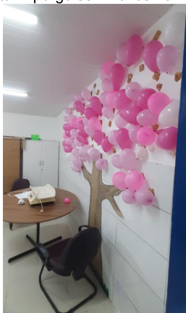
33.15. Sala dos ACS