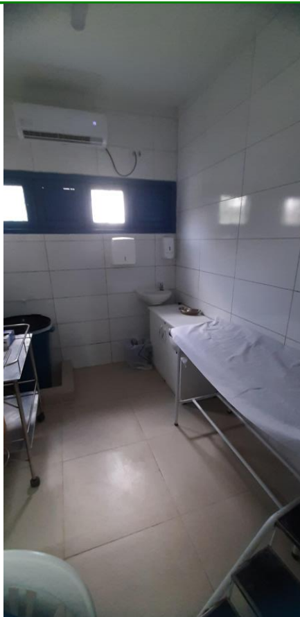
33.5. Sala de Procedimentos