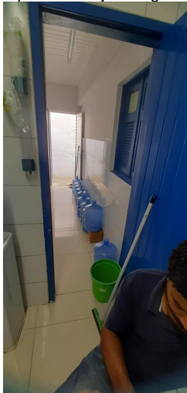
33.8. No fluxo da copa há materiais de limpeza e garrafas de água depositados no chão