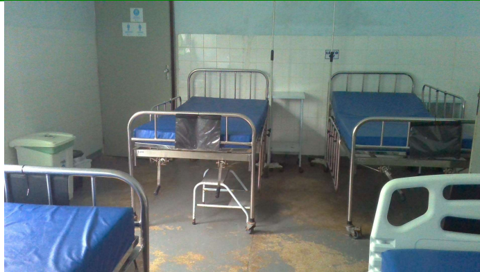
24.13. Enfermaria com banheiro anexo