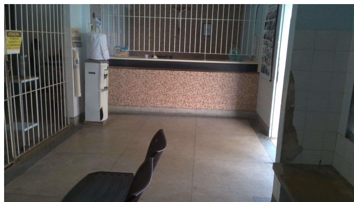
24.2. Recepção e sala de espera