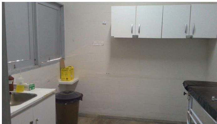
24.11. Sala de sutura