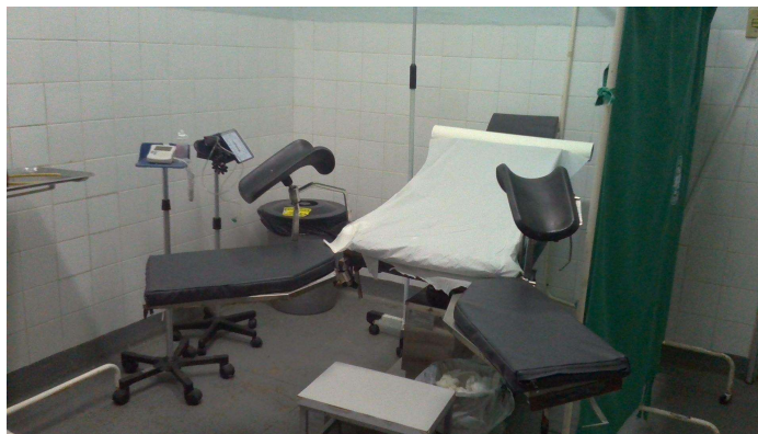
24.14. Sala de parto (foto 1)