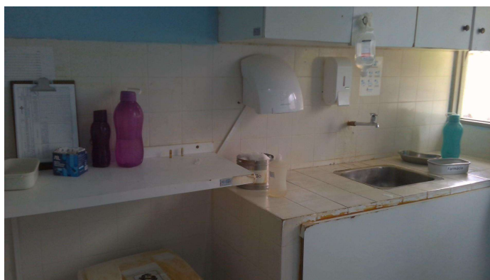
24.9. Sala de medicação