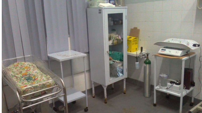
24.16. Sala de parto (foto 3)