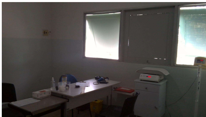
24.12. Classificação de risco