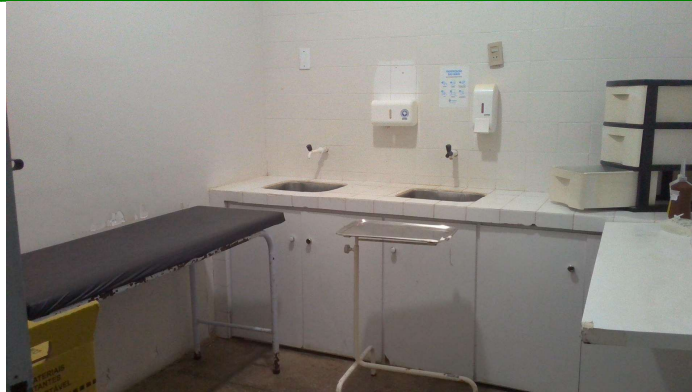
24.10. Sala de curativo