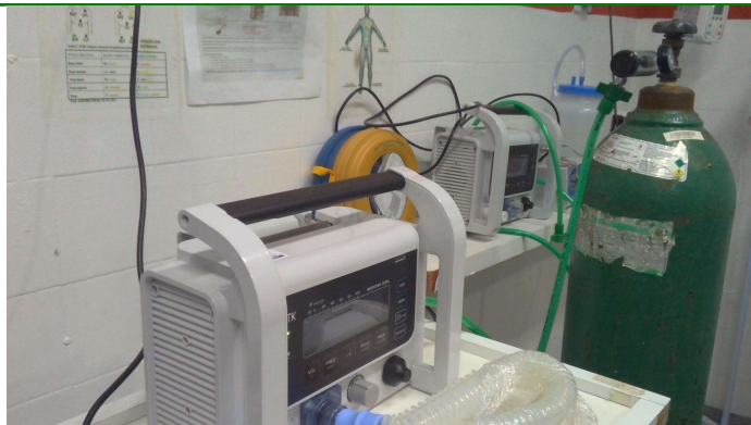
24.4. Respiradores e DEA