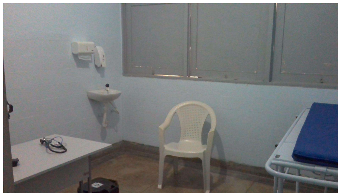
24.8. Consultório médico