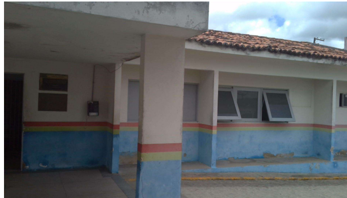
24.1. Hospital Municipal José Veríssimo de Souza