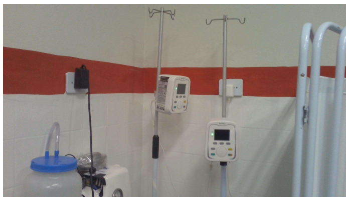
24.5. Bombas de infusão