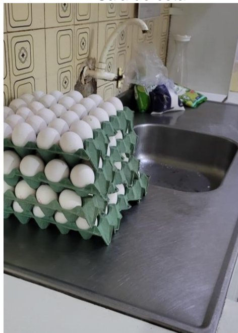
41.8. Copa/ Cozinha 01