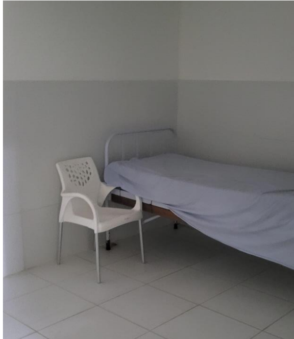
41.5. Sala de Estabilização: sem equipamentos de reanimação, com cama comum