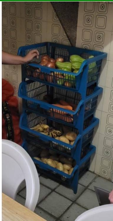
41.15. Copa: fruteira com alguns perecíveis, como batata, cebola e cenoura