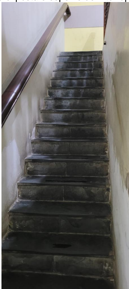
41.18. Circulação interna com acessos apresentando barreiras físicas, como batentes, degraus e escadas.