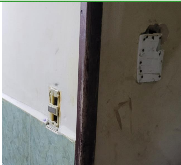
41.17. Fiação exposta e espelho de Interruptor danificado