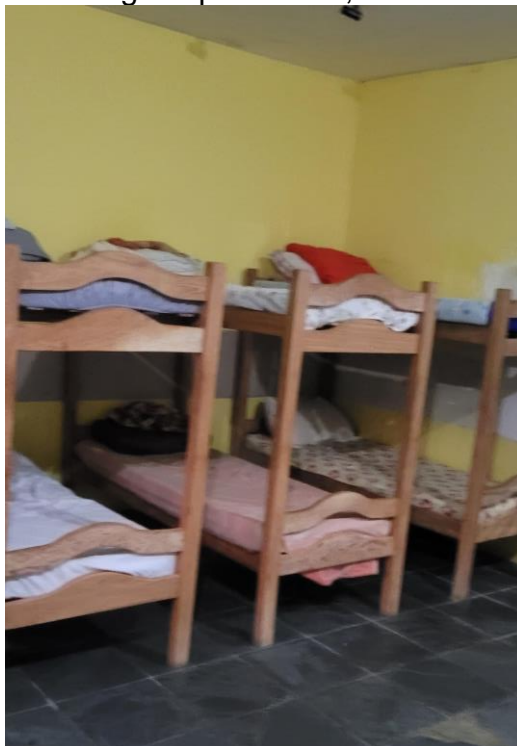
41.16. Área com cerca de 05 beliches próximos (10 usuários)