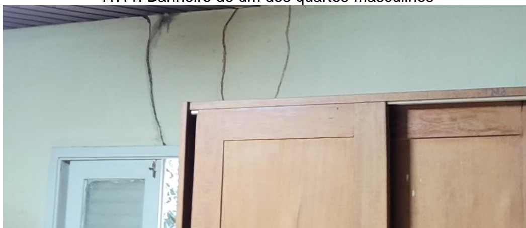
41.12. Caminhos de Cupim vindos do Lambri