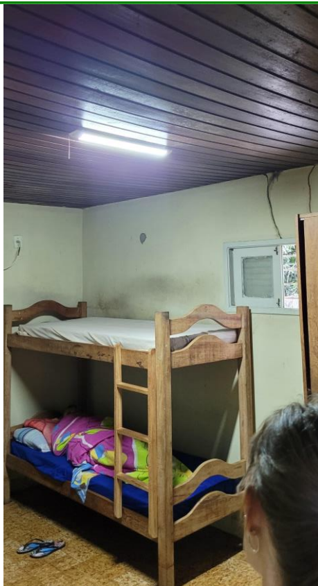
41.13. Acomodação em outro Quarto Masculino