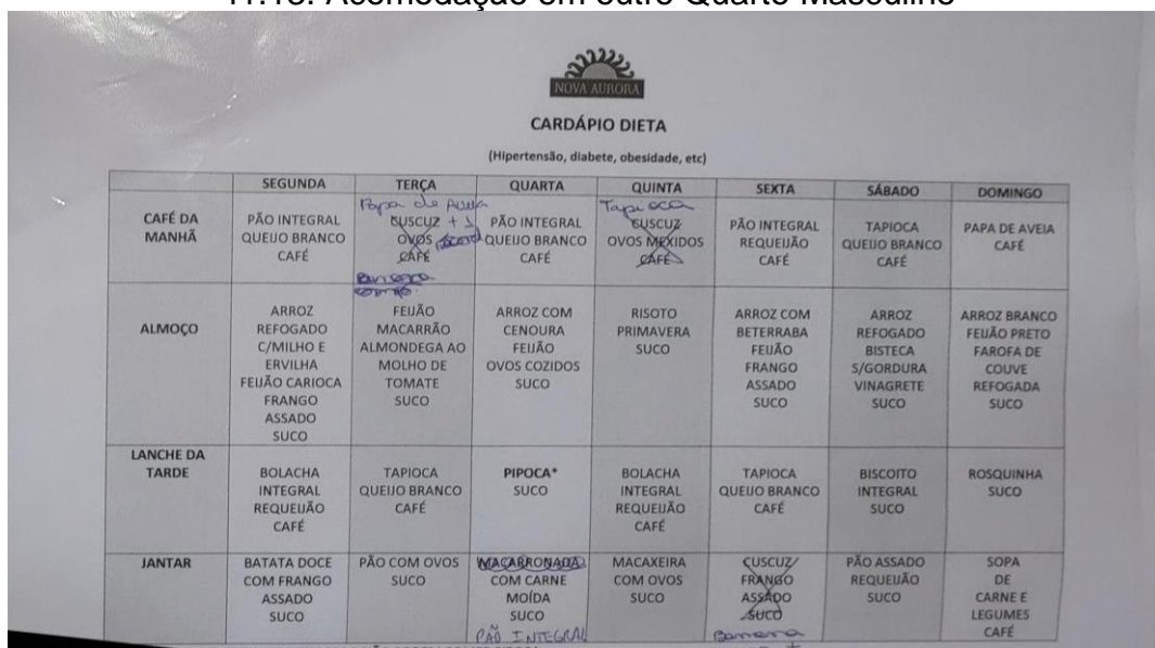
41.14. Cardápio Impresso