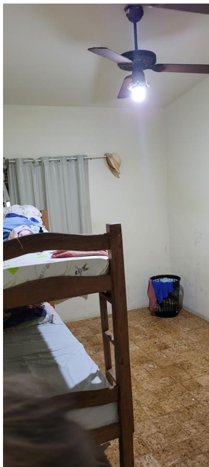
41.10. Acomodação em um dos quartos, sem banheiro interno