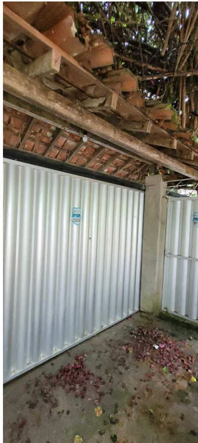
41.4. Fachada sem Identificação