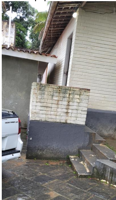
41.6. Sala administrativa/ Consultório multiuso: acesso só por escada