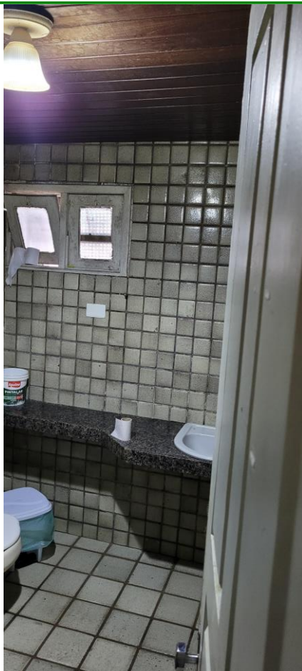
41.11. Banheiro de um dos quartos masculinos