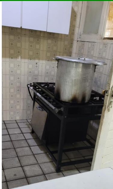
41.9. Copa/ Cozinha: sem exaustão nem telas nas janelas