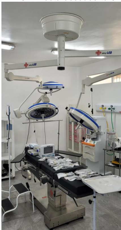
27.17. Sala cirúrgica para procedimentos eletivos