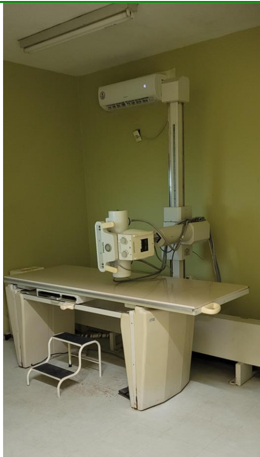
27.25. Aparelho de Raios-X