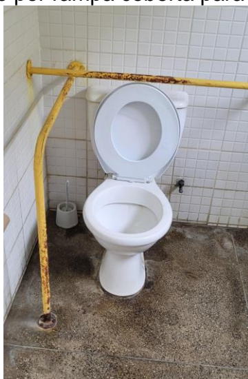
27.2. Banheiro para usuários em espera fica numa policlínica ao lado