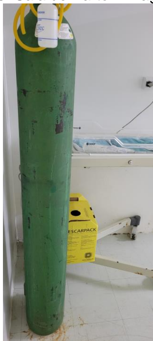
27.14. Torpedo de Oxigênio sem fixação na Sala de Parto