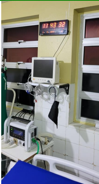
27.7. Equipamentos na Sala Vermelha