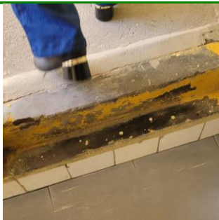
27.20. Há barreiras físicas, como batentes.