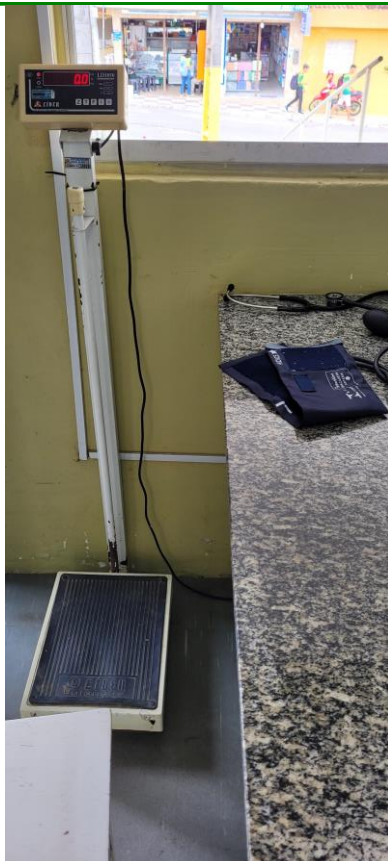
27.5. Balança e balcão da Pré-consulta (triagem)