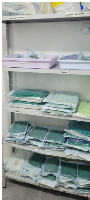
27.19. Estante no CME - Central de Material Esterilizado