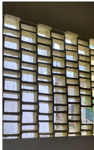
27.24. Lavanderia - Cobogó sem telas