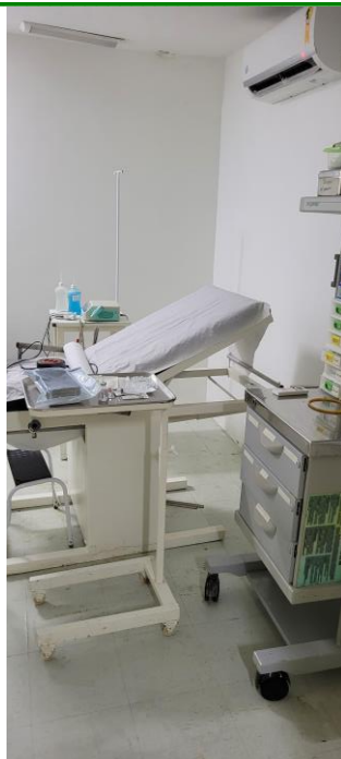
27.13. Sala de Parto - Imagem b