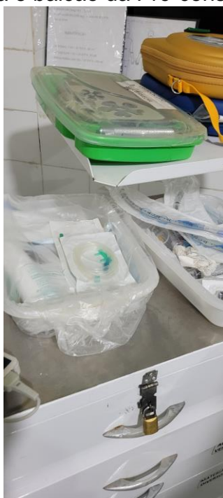
27.6. Materiais para Reanimação na Sala Vermelha