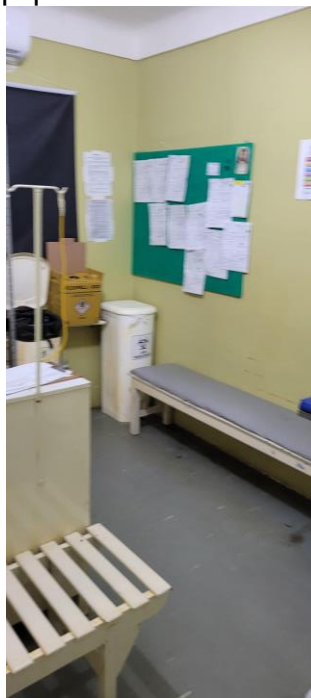
27.8. Posto de Enfermagem/ Sala de Medicação