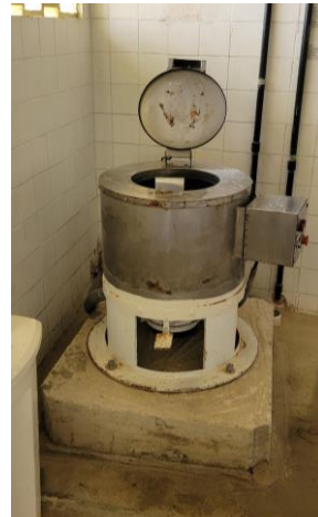
27.23. Lavanderia - Centrífuga