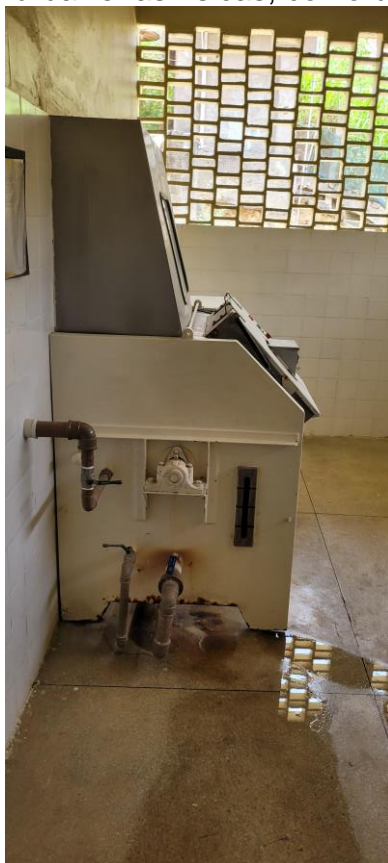
27.21. Máquina de Lavar de Barreira