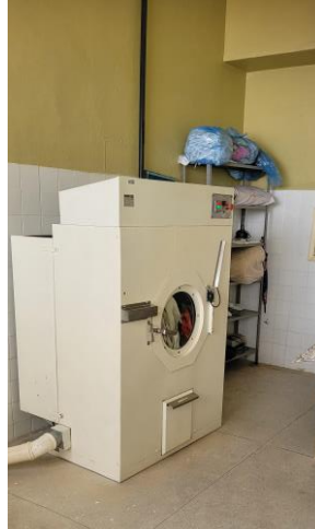
27.22. Lavanderia - Secadora