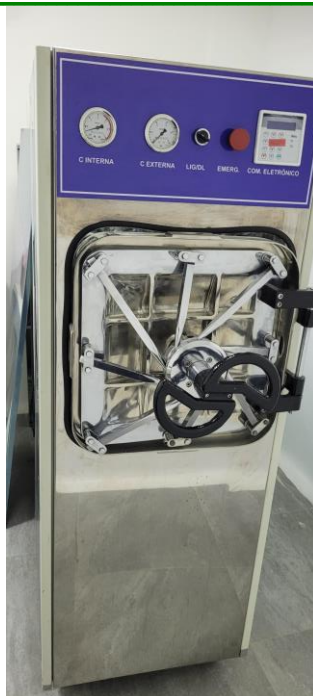
27.18. Autoclave CME - Central de Material Esterilizado