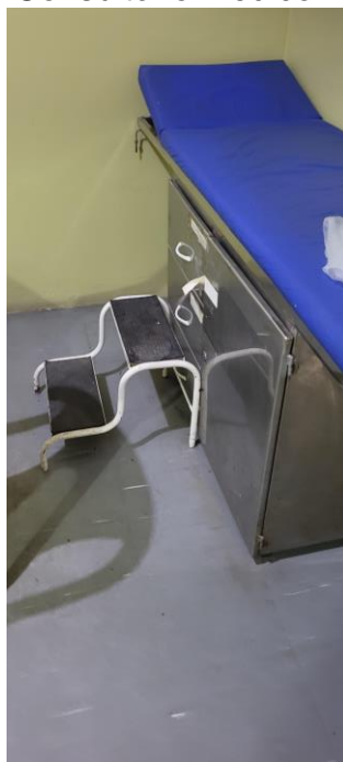
27.10. Consultório Médico - maca