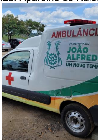
27.26. Uma das ambulâncias da unidade - visão externa