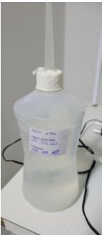
27.16. Pinceta descoberta 02