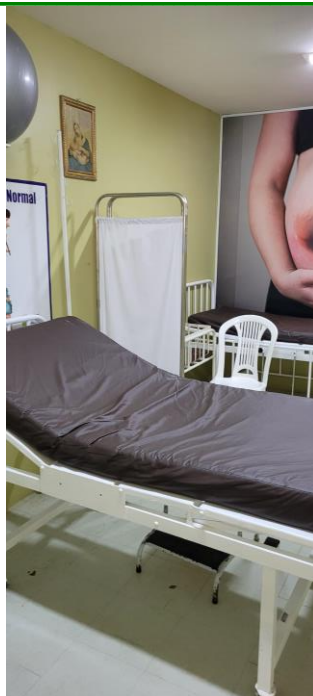
27.11. Expectação/ Pré-parto