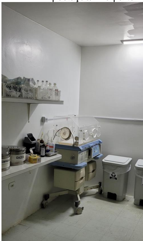
27.12. Sala de Parto - Imagem a