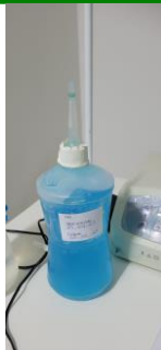
27.15. Pinceta descoberta 01