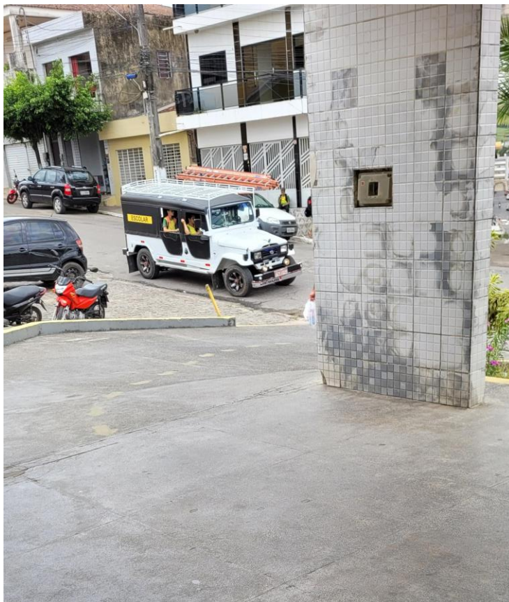
27.1. Acesso por rampa coberta para ambulâncias