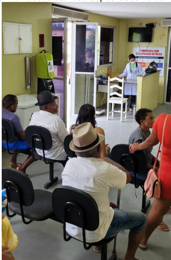
27.4. Sala de Espera