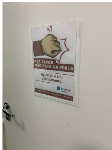
11.14. Consultorio Medico