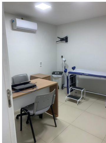
11.19. Consultorio Ginecologia Split