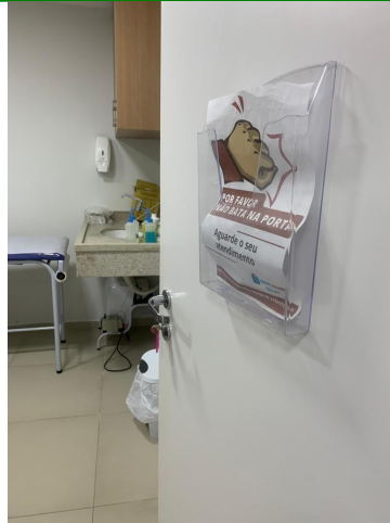
11.18. Consultorio Ginecologia