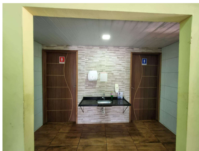
29.6. Área comum banheiros