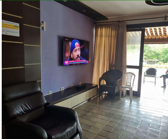
29.17. Sala de convivência