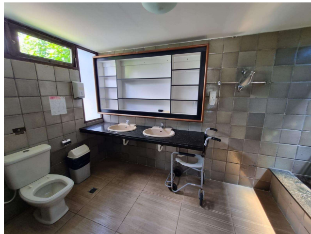
29.10. Banheiro masculino (foto 1)