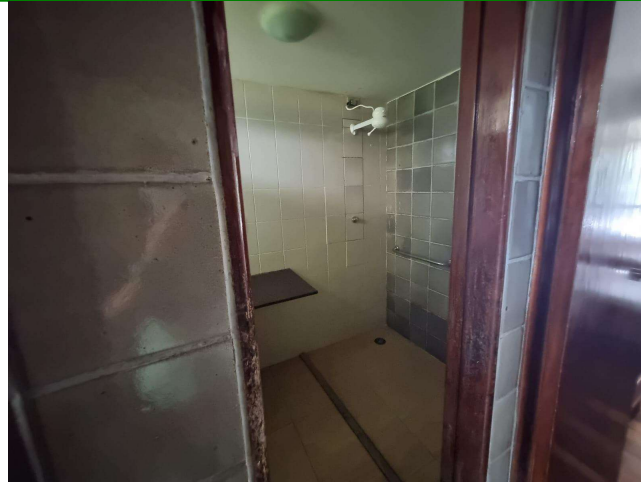
29.9. Banheiro feminino (foto 2)