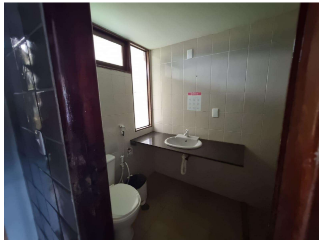
29.8. Banheiro feminino (foto 1)