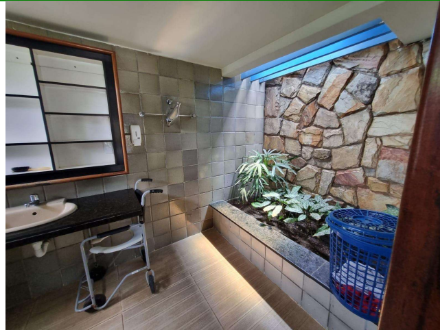
29.11. Banheiro masculino (foto 2)