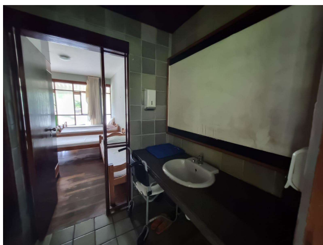
29.14. Pia e cadeira de banho (quarto feminino)