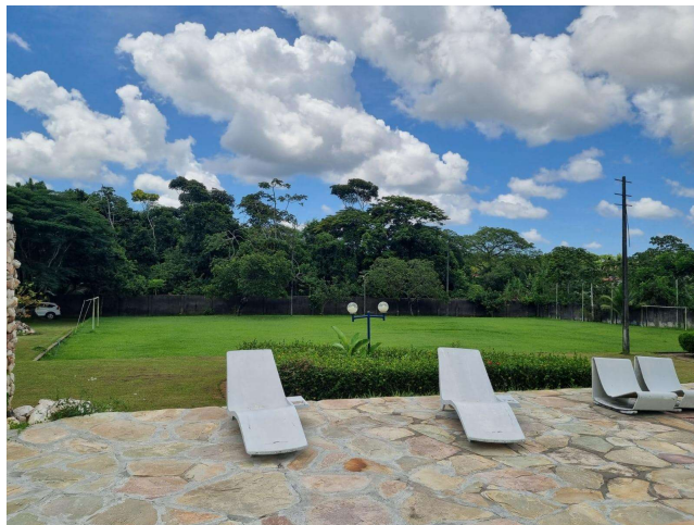
29.4. Campo de futebol