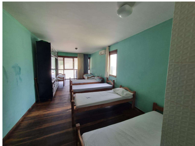
29.16. Enfermaria masculina