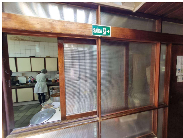
29.20. Sinalização de saída