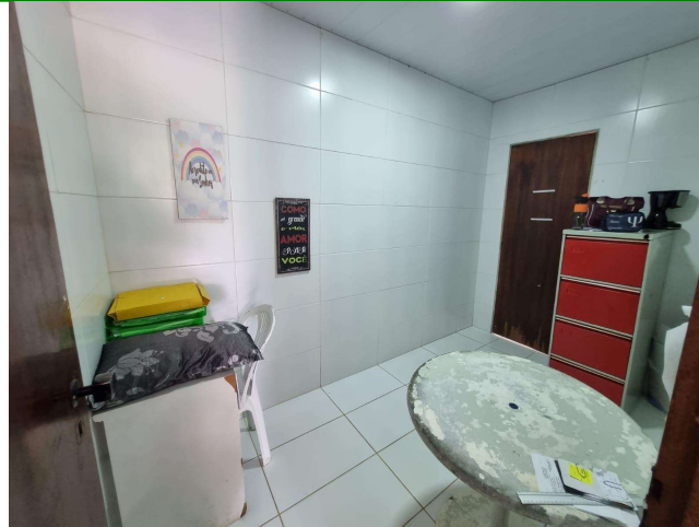
29.19. Sala da assistente social