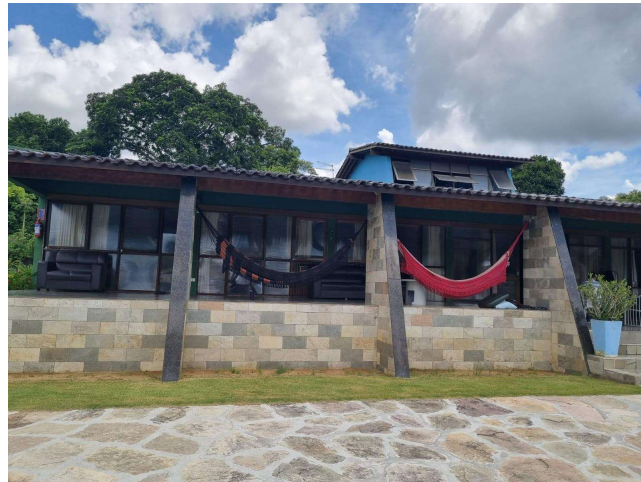
29.1. Clínica de Reabilitação Passos para a Vida