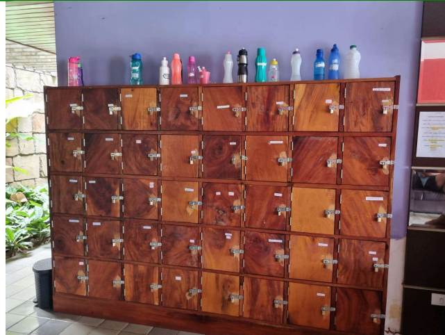
29.7. Armários dos pacientes