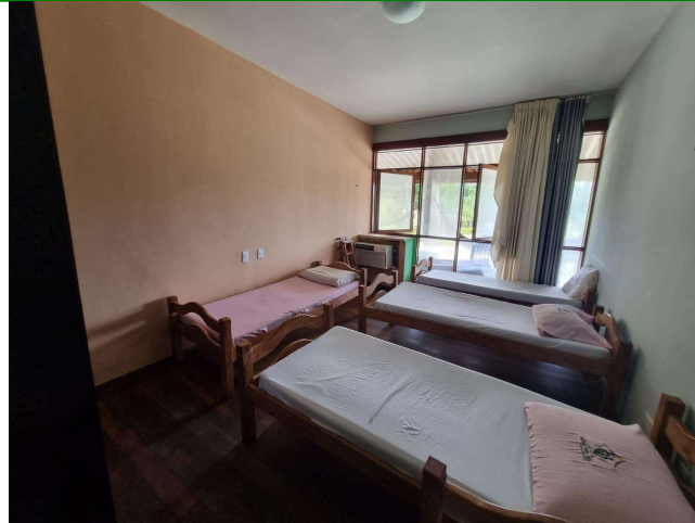
29.15. Enfermaria feminina