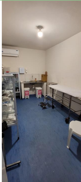
28.9. Sala de sutura