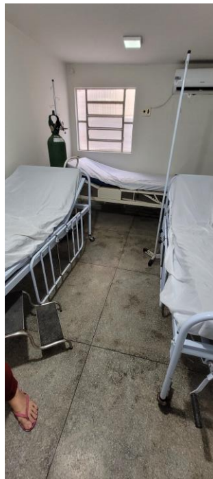
28.6. Observação única