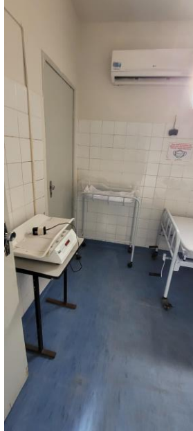
28.11. Sala de parto (imagem 2)