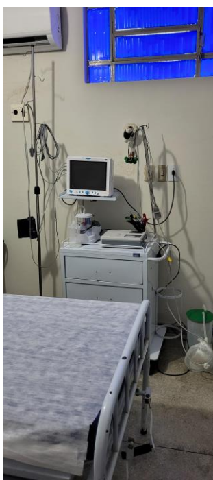
28.2. Sala vermelha