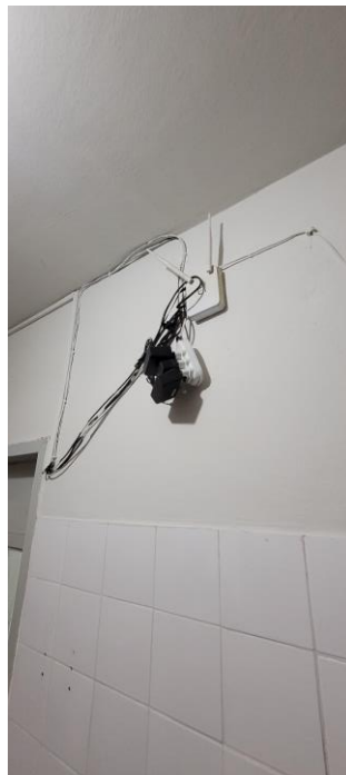
28.8. Fiação e gambiarra exposta