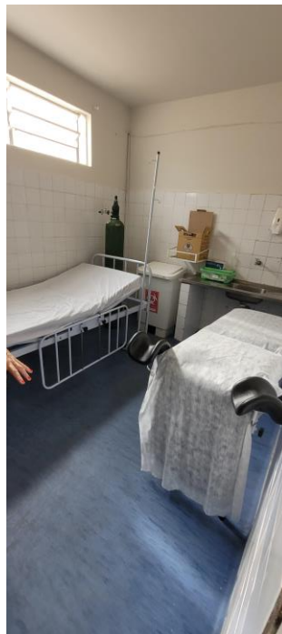
28.10. Sala de parto (imagem 1)