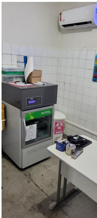
28.3. Sala de vacinas/ Triagem com Câmara Fria