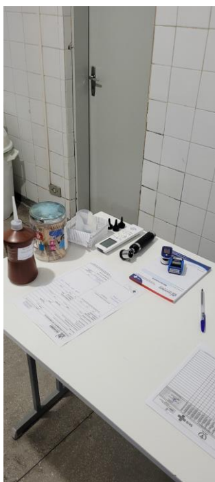
28.4. Consultório médico com banheiro anexo