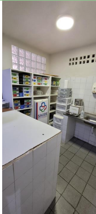
28.5. Posto de enfermagem