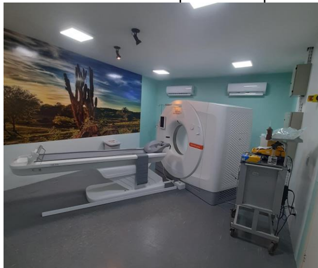
24.14. Tomógrafo é legado da Pandemia