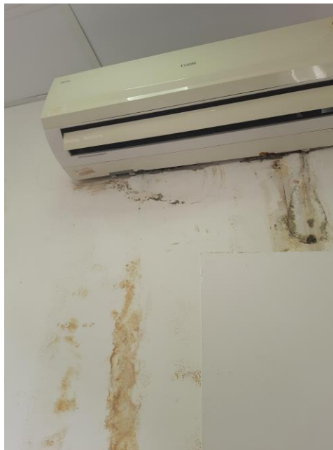
24.12. Consultório Médico com infiltrações e mofo