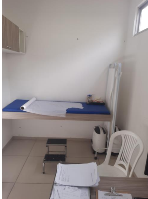
24.11. Consultório Médico