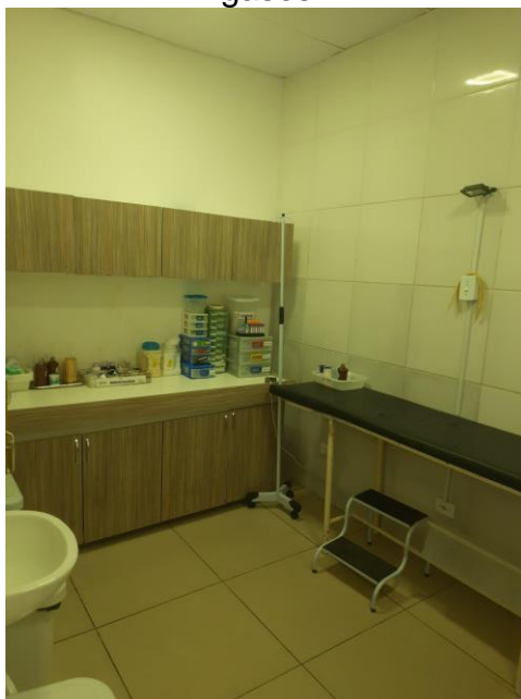
24.10. Posto de enfermagem