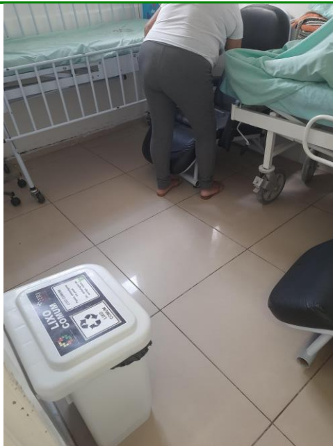
24.7. Observação com 02 leitos