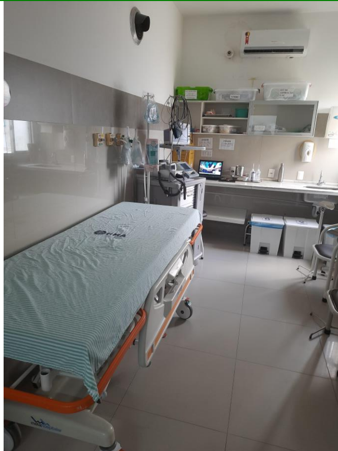
19.5. Sala Vermelha com apenas 01 leito