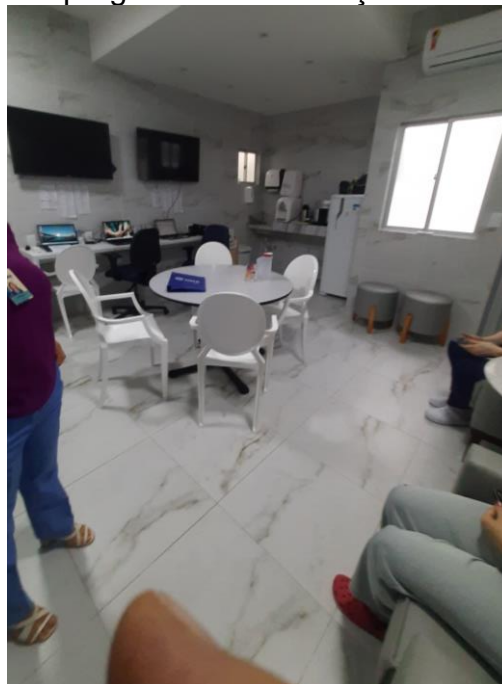
19.10. Bloco cirúrgico