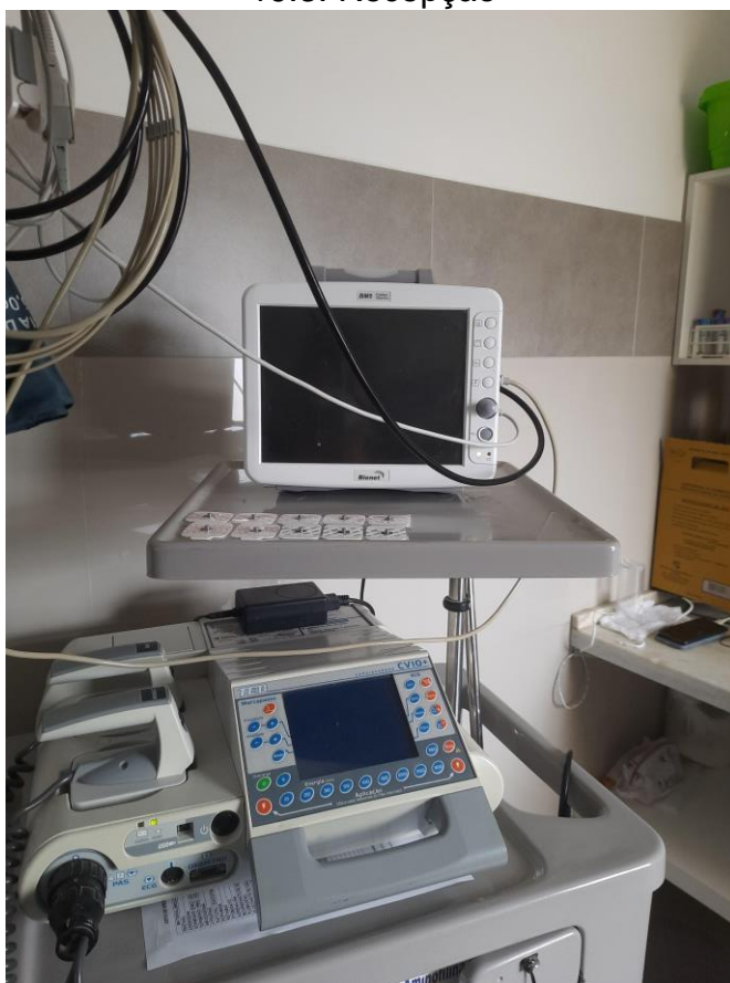
19.4. Equipamentos da Sala Vermelha