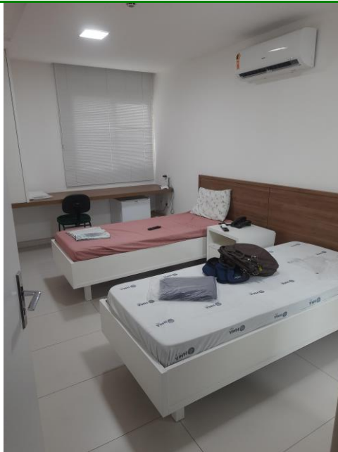
19.11. Repouso Médico