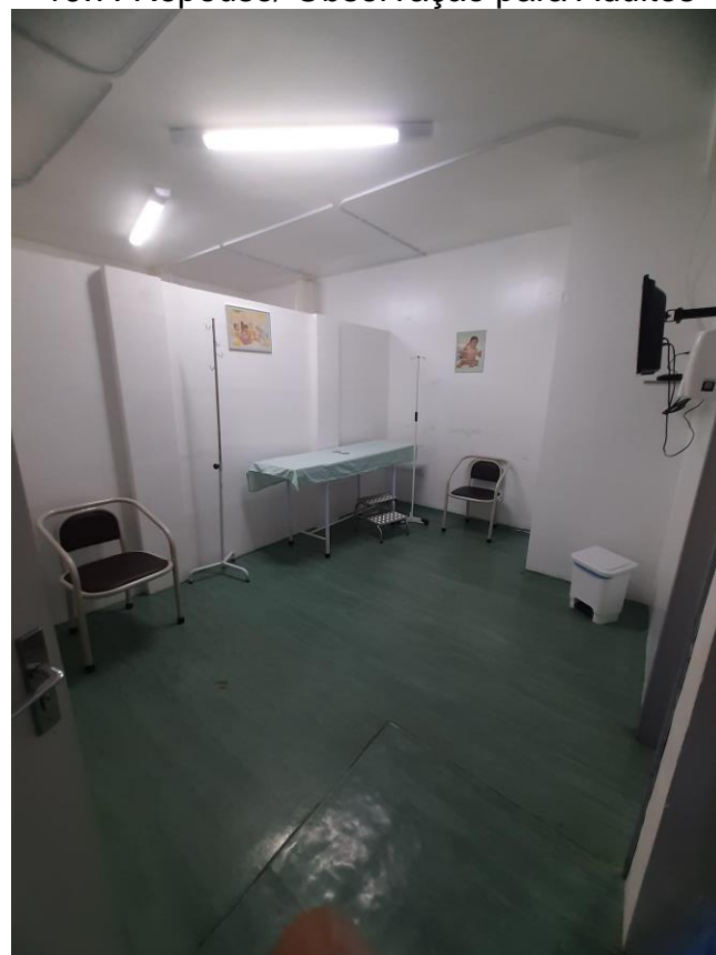
19.8. Repouso Infantil