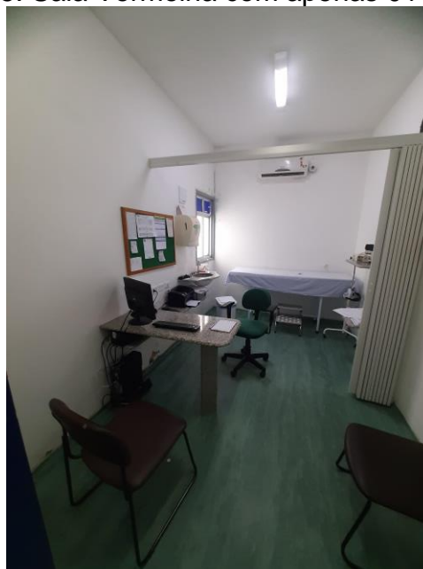
19.6. Consultório Médico