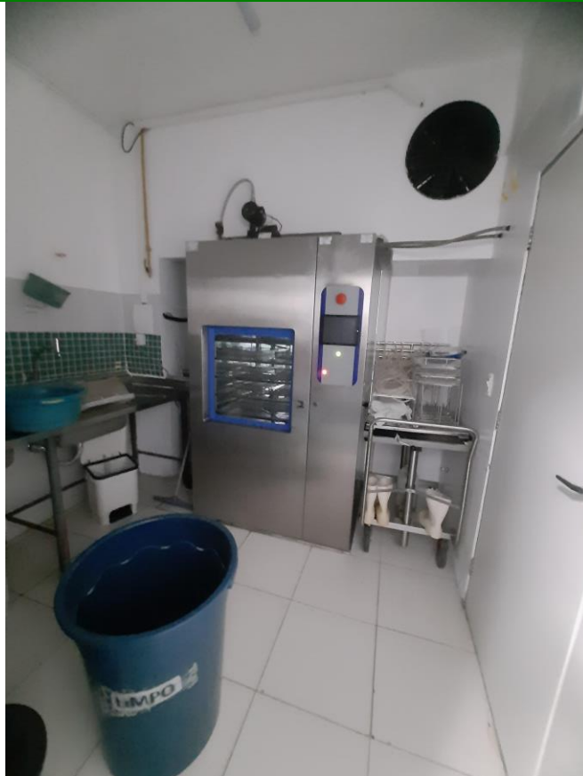
19.9. Expurgo com Esterilização de Barreira