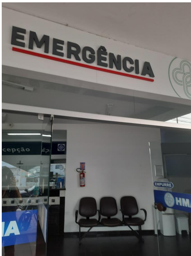
19.1. Entrada da Emergência