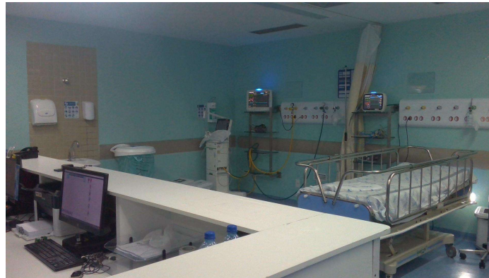
6.1. SRPA (foto 1)