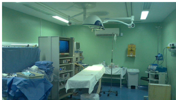
6.3. Sala de cirurgia