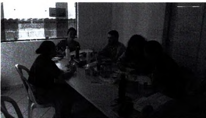
37.6. SALA DE TRABALHO EM GRUPO