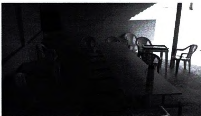
37.8. SALA PARA TERAPIAS