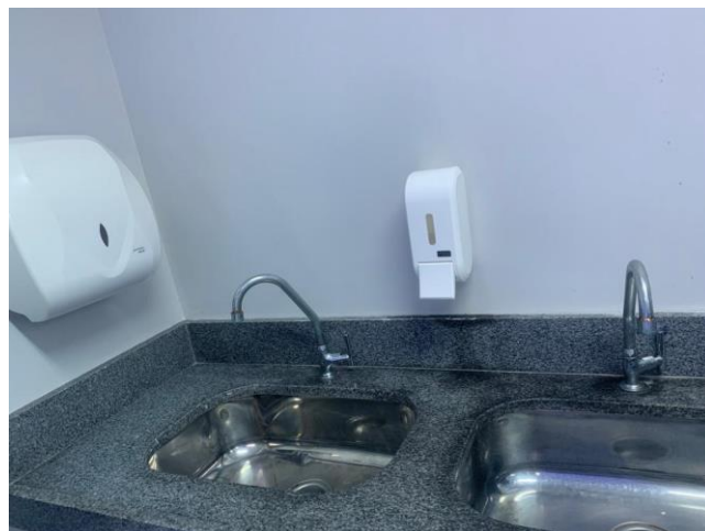
39.19. Sala Vermelha Pia Sem Papel Toalha