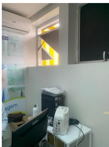
39.9. Classif Risco Sem Pia Split