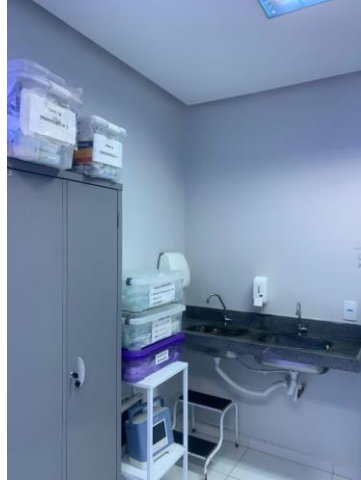
39.18. Sala Vermelha