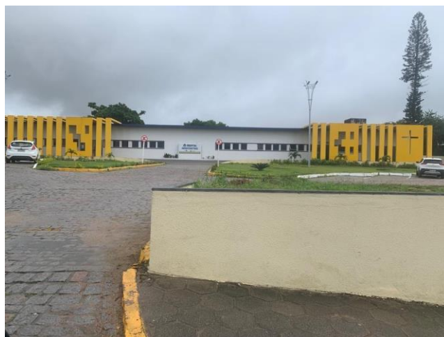
39.1. Area Externa