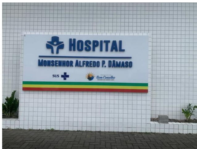
39.2. Area Externa