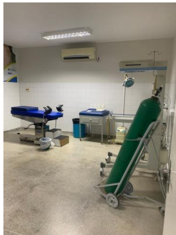
39.34. Sala Parto