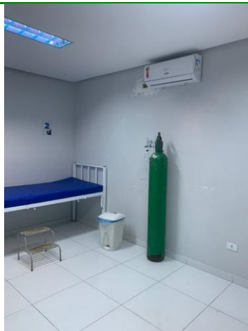
39.23. Observação Split