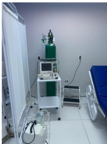
39.16. Sala Vermelha