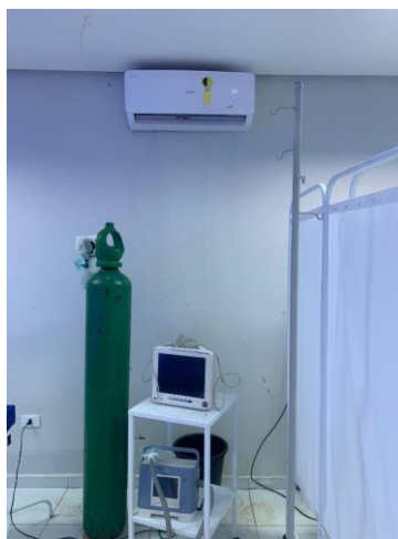
39.17. Sala Verm Split Cilindro Oxig Não Fixado