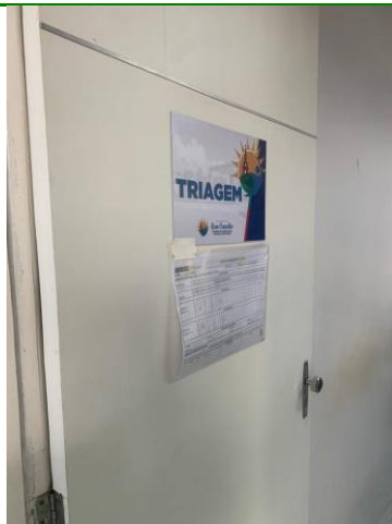
39.8. Classificação Risco