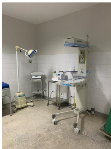
39.37. Sala Parto