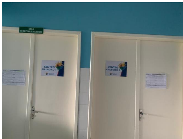
39.42. Centro Cirurgico