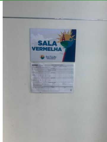
39.13. Sala Vermelha