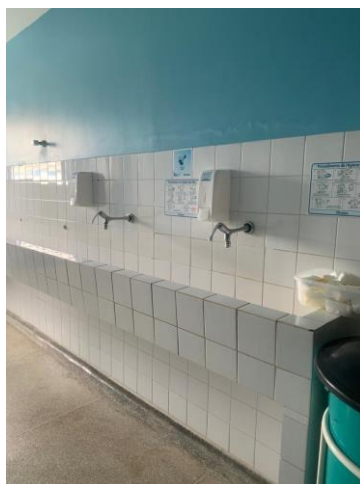
39.41. Centro Cirurgico Lavabo