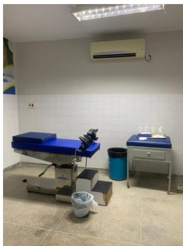
39.36. Sala Parto Split