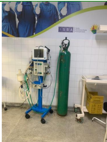
39.48. Centro Cirurgico