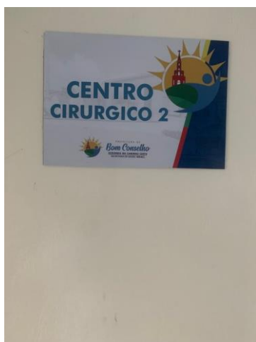
39.49. Centro Cirurgico