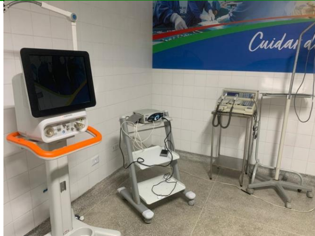
39.53. Centro Cirurgico