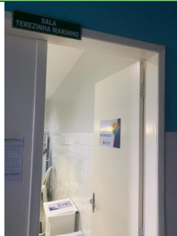
39.43. Centro Cirurgico