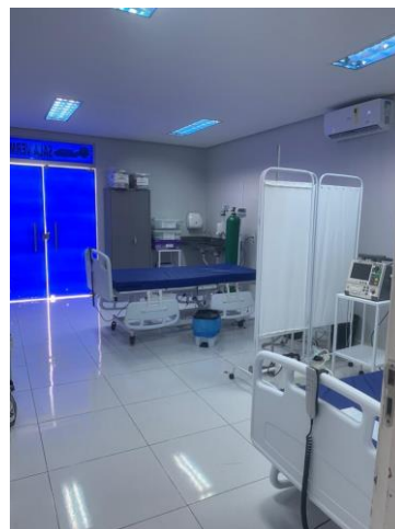
39.14. Sala Vermelha Split