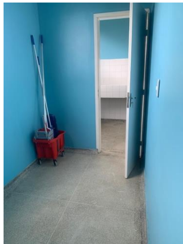
39.39. Acesso centro Cirurgico