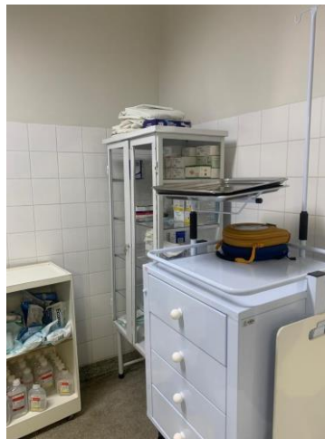
39.47. Centro Cirurgico