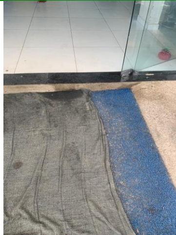
39.3. Recepção Entrada