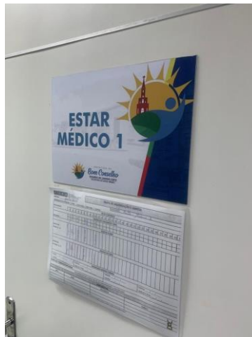
39.54. Repouso Medico