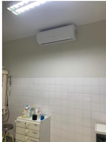
39.46. Centro Cirurgico Split