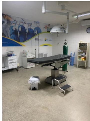
39.52. Centro Cirurgico