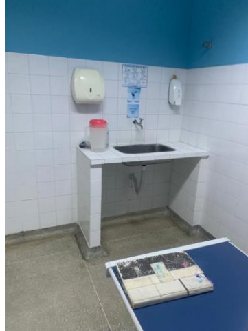
39.38. Posto Enfermagem