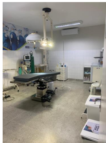
39.44. Centro Cirurgico Split