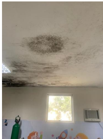
39.29. Pediatria Mofo