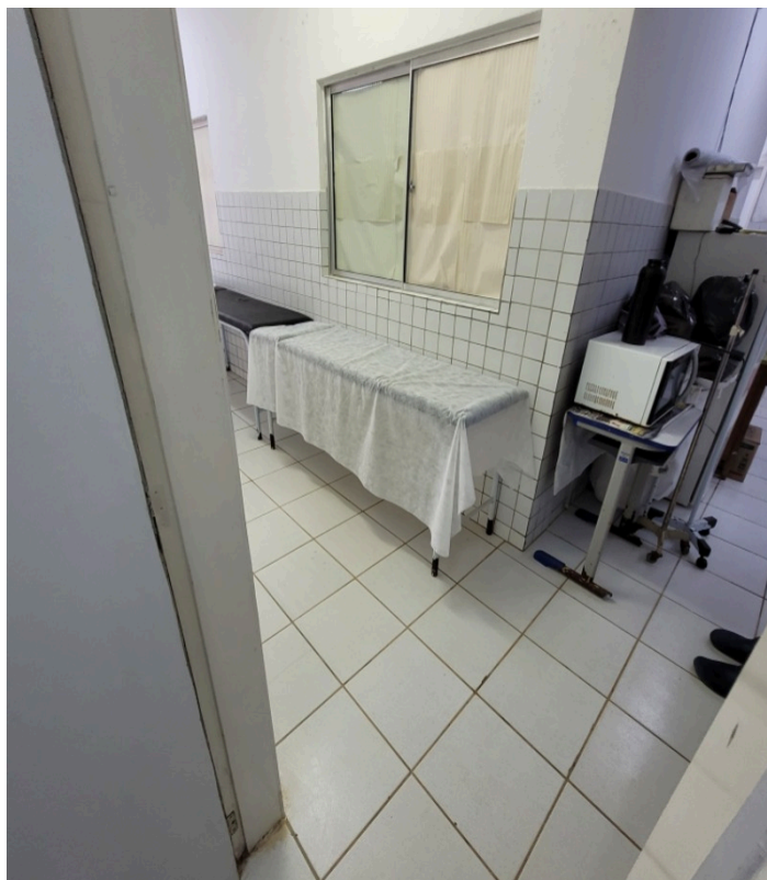
Maca fica em corredor ao lado externo do consultório por falta de espaço comprometendo a privacidade dos usuários e usuárias