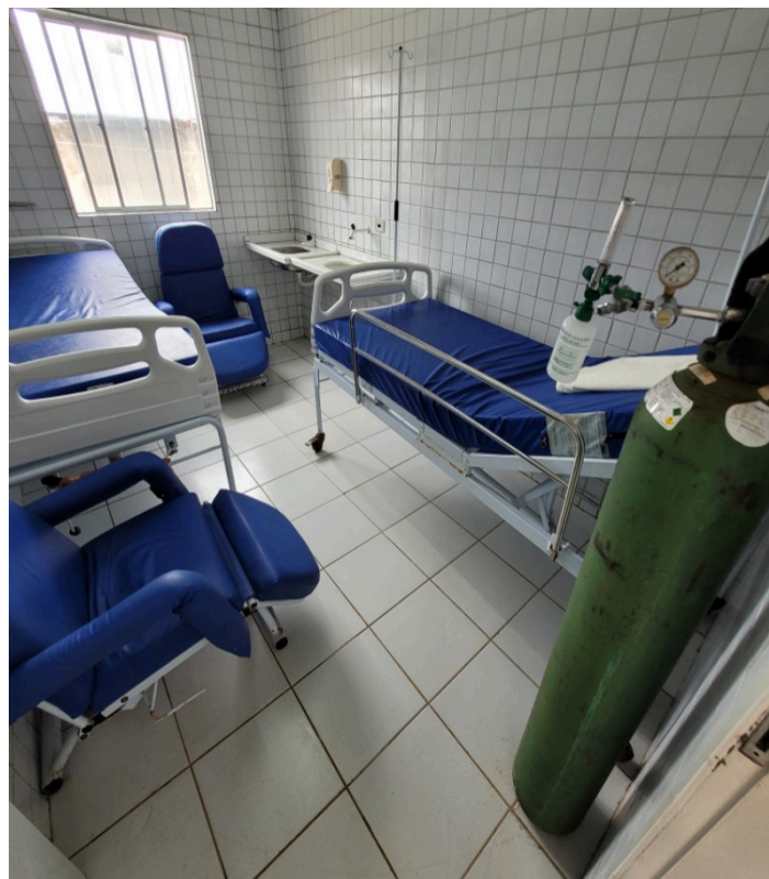
Salas para Observação Clínica estavam sem pacientes, havia infiltrações. Não contam com banheiros anexos