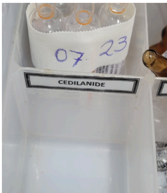
Cedilanide em falta no carrinho de medicações de urgência