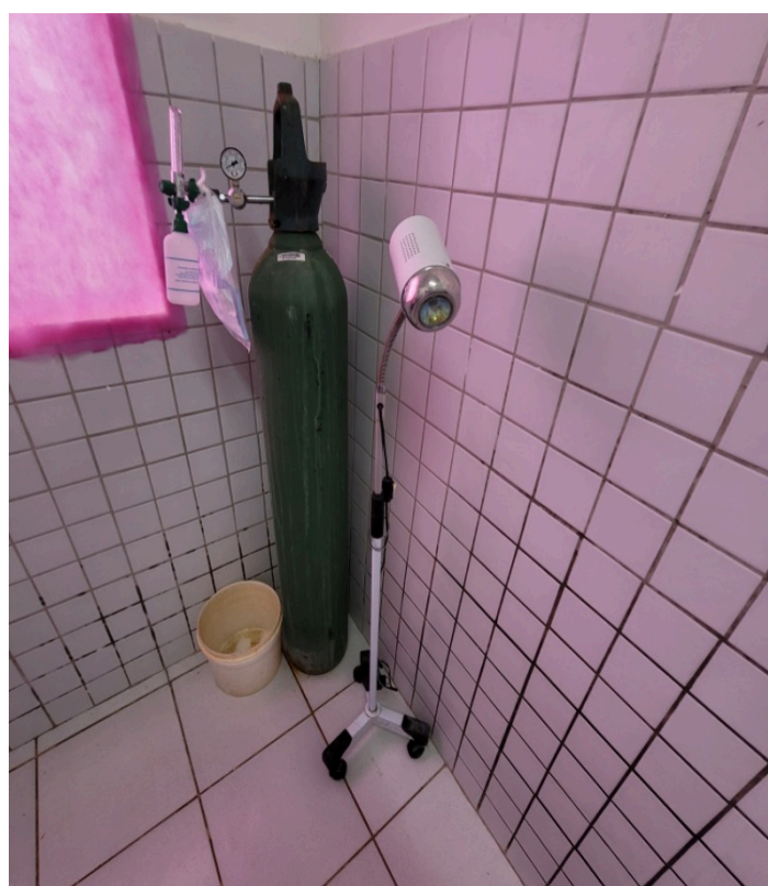
Cilindro de oxigênio na sala de parto não possui fixação em carrinhos ou correntes