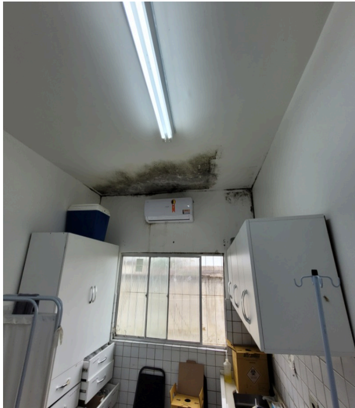
Infiltrações e mofo no teto do posto de enfermagem