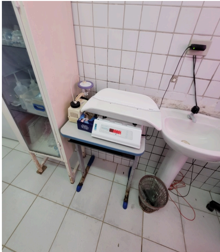
Pia fica ao lado de balança para o recém-nascido na sala de parto