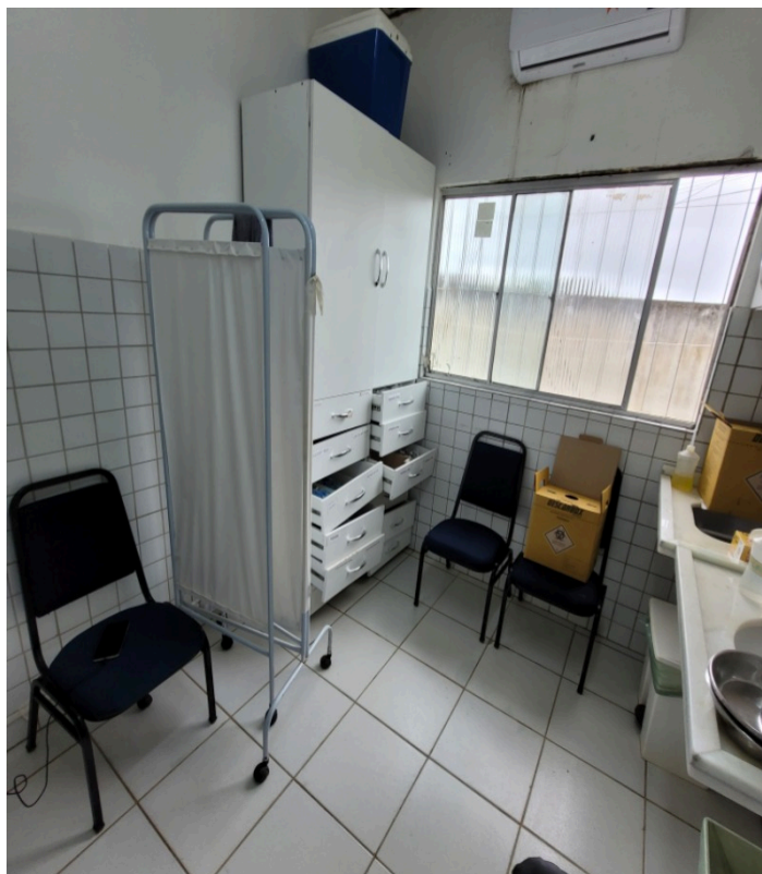
Posto de enfermagem/ sala de medicação com armário precário e sem bancada para o preparo de medicações