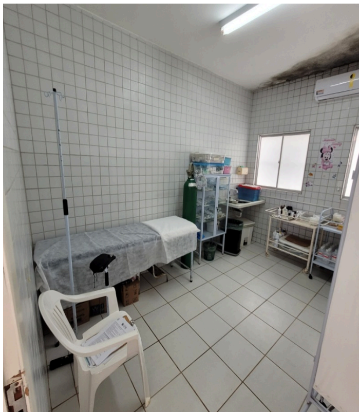
Sala Vermelha (de estabilização)