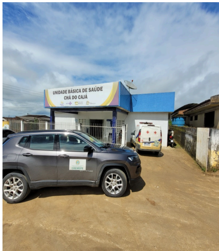
Fachada. Serviço funcionando provisoriamente na UBS Chã do Cajá