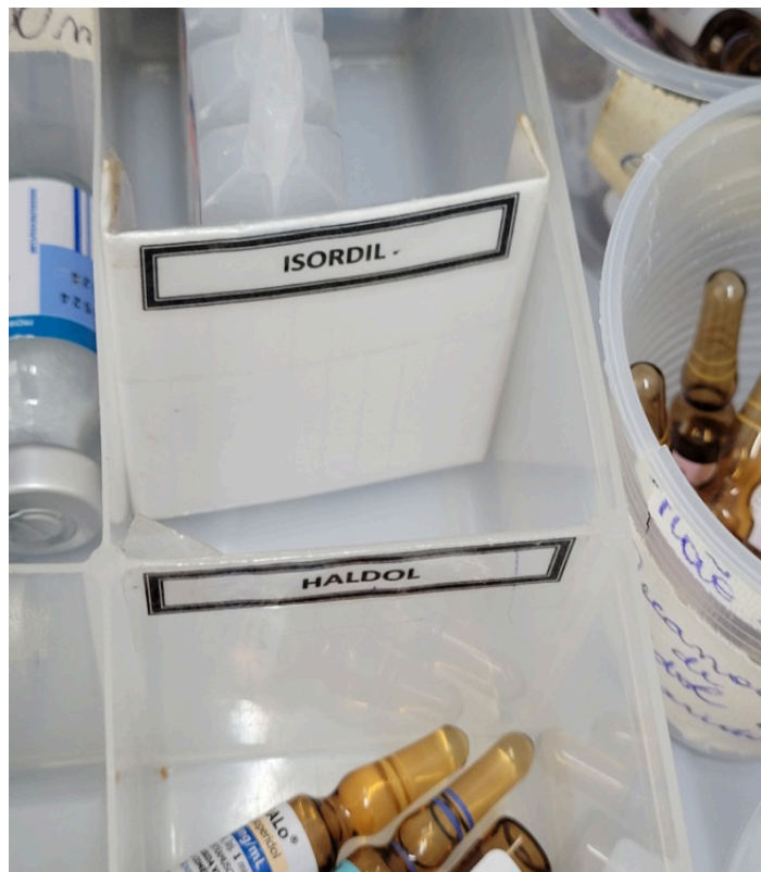
Isordil em falta no carrinho de medicações de urgência