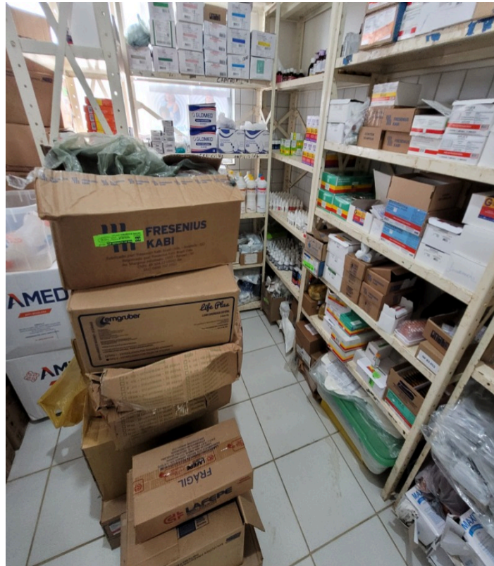
Farmácia abastecida com alguns descartáveis depositados diretamente no chão. Neste ambiente também há infiltrações e mofo