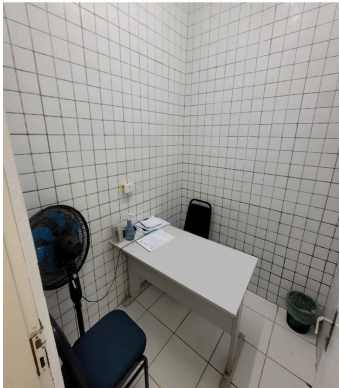
Consultório médico sem janelas nem pia.