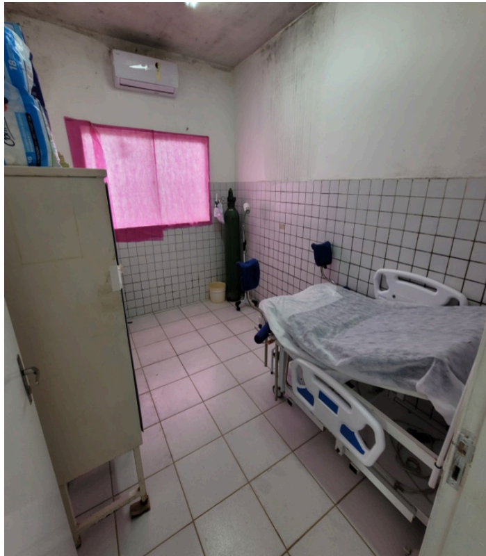
Sala de parto improvisada