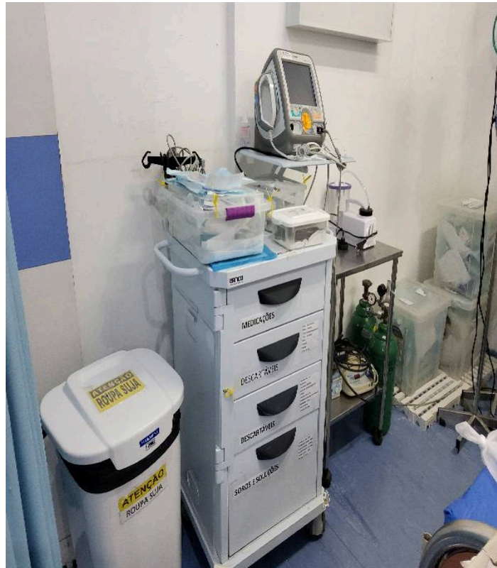
Carrinho, maleta ou kit contendo medicamentos e materiais para atendimento às emergências (adulto e pediátrico)