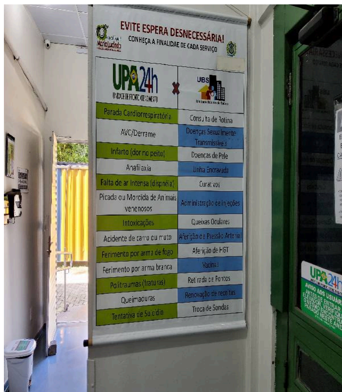
Classificação da UPA