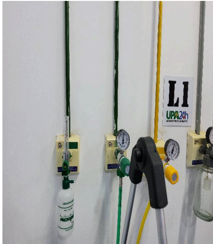
Rede de gases