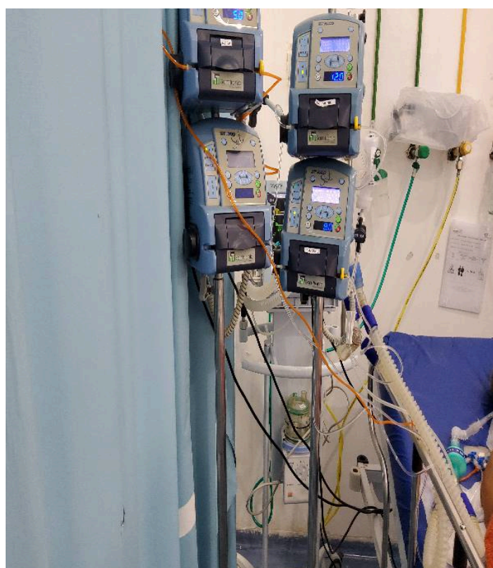
Item não conforme: No momento da vistoria, havia pacientes portadores de doenças de complexidade maior, em iminente risco de vida ou sofrimento intenso