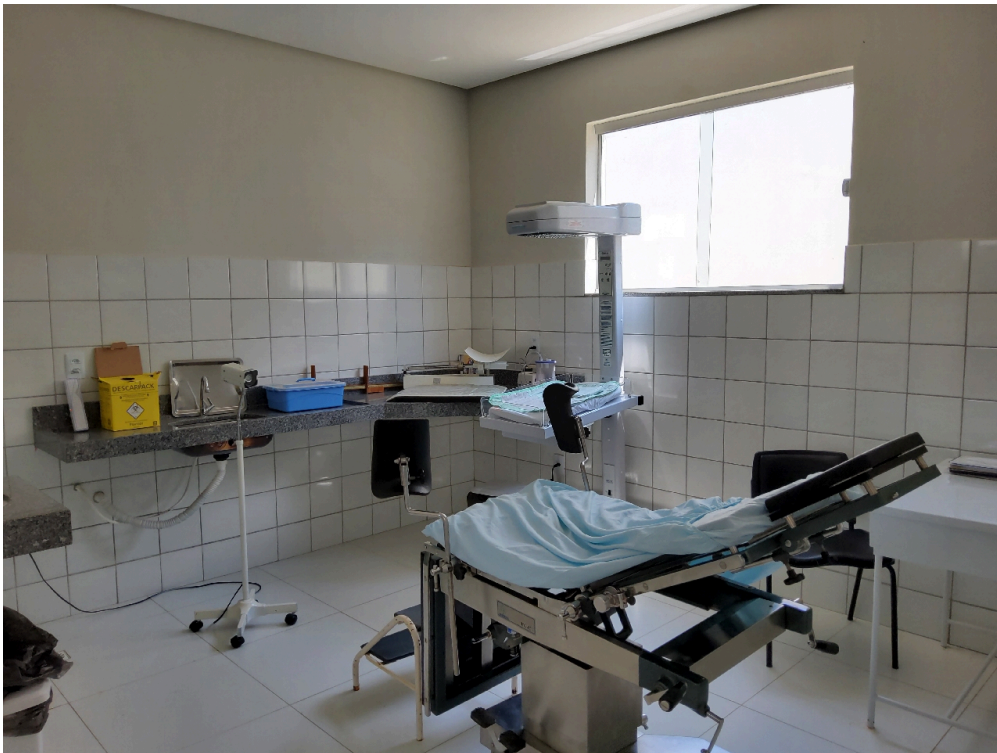
Sala de parto (foto 1)