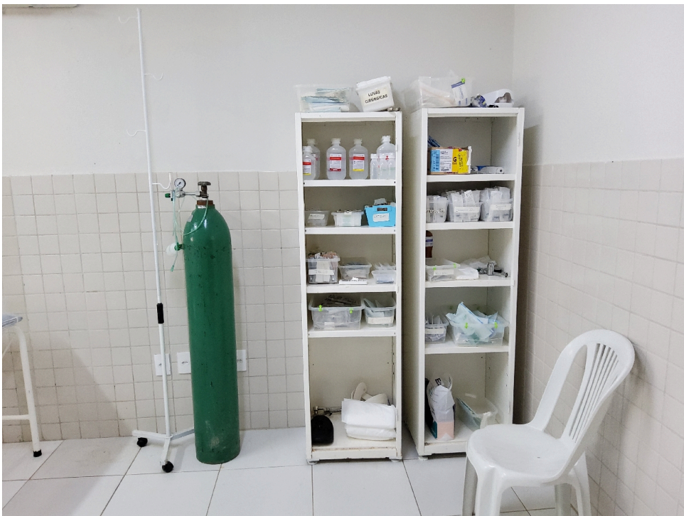
Sala de procedimentos (foto 2)