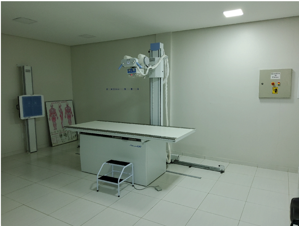
Sala de RX