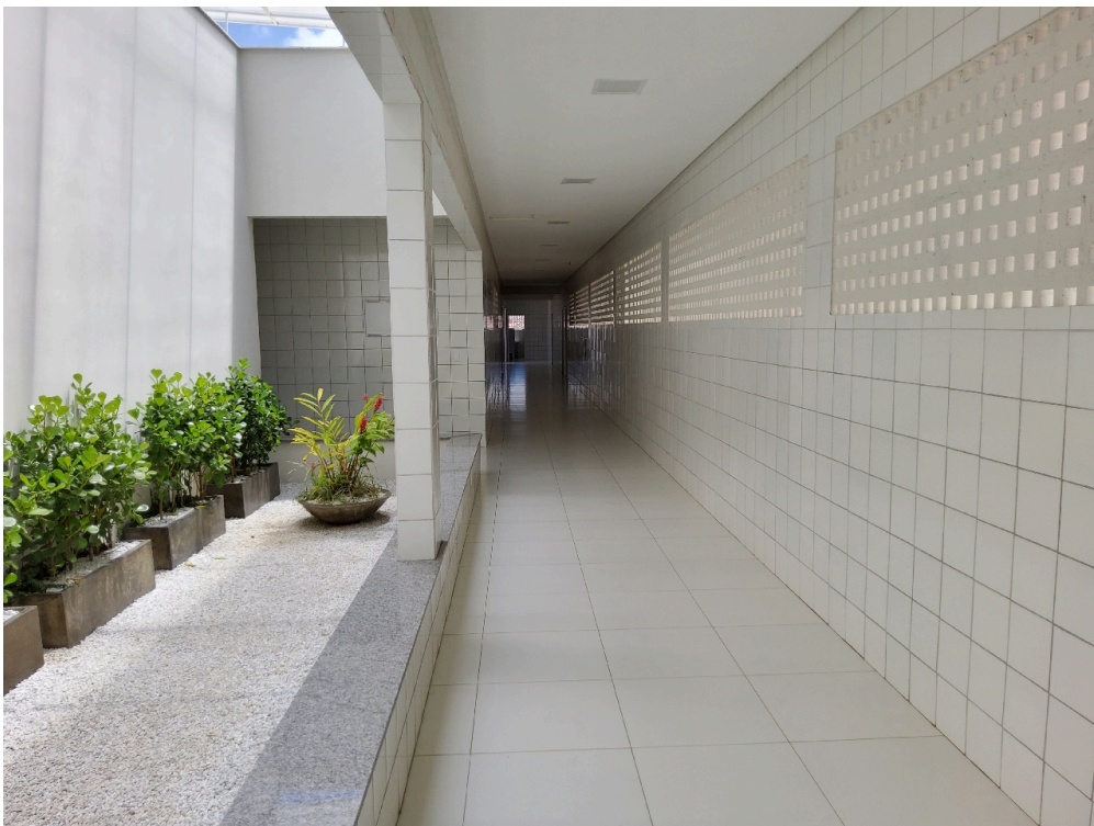
Ala das enfermarias