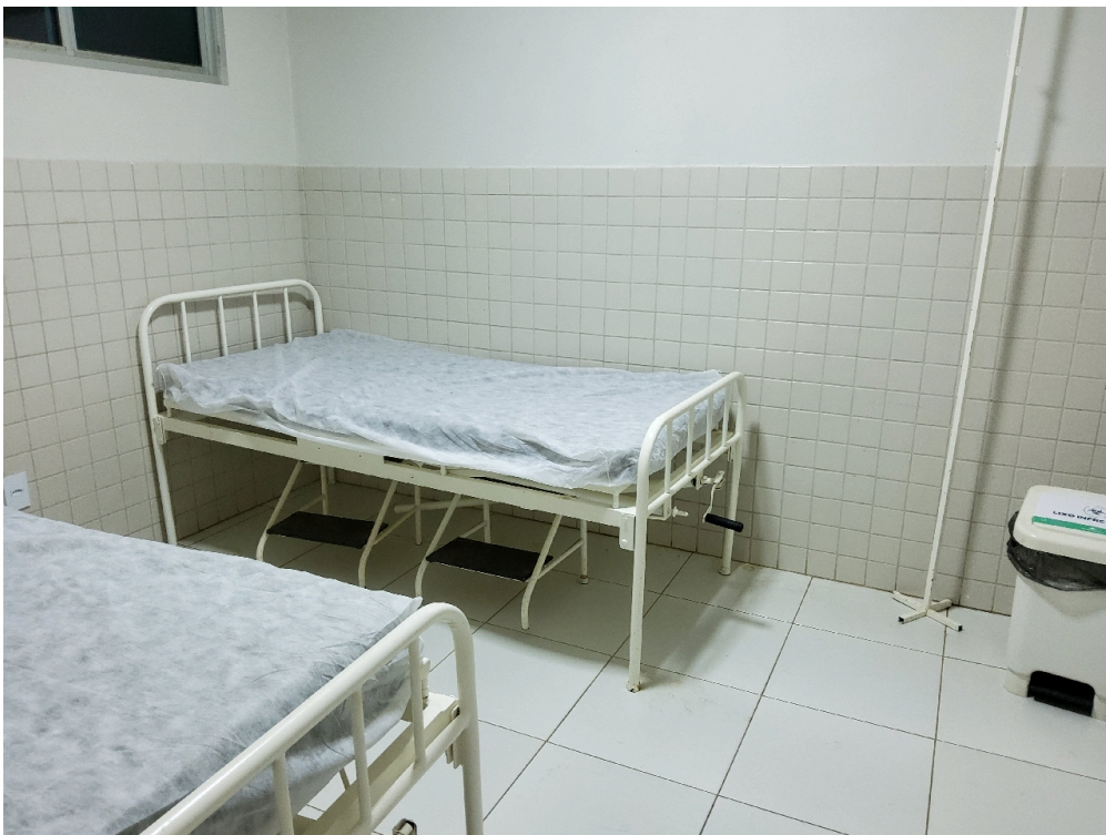
Sala de observação sem divisão por sexo, é tabem infantil