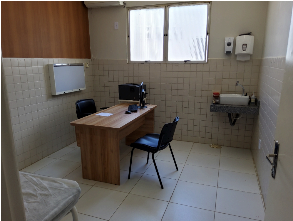
Consultório médico 1