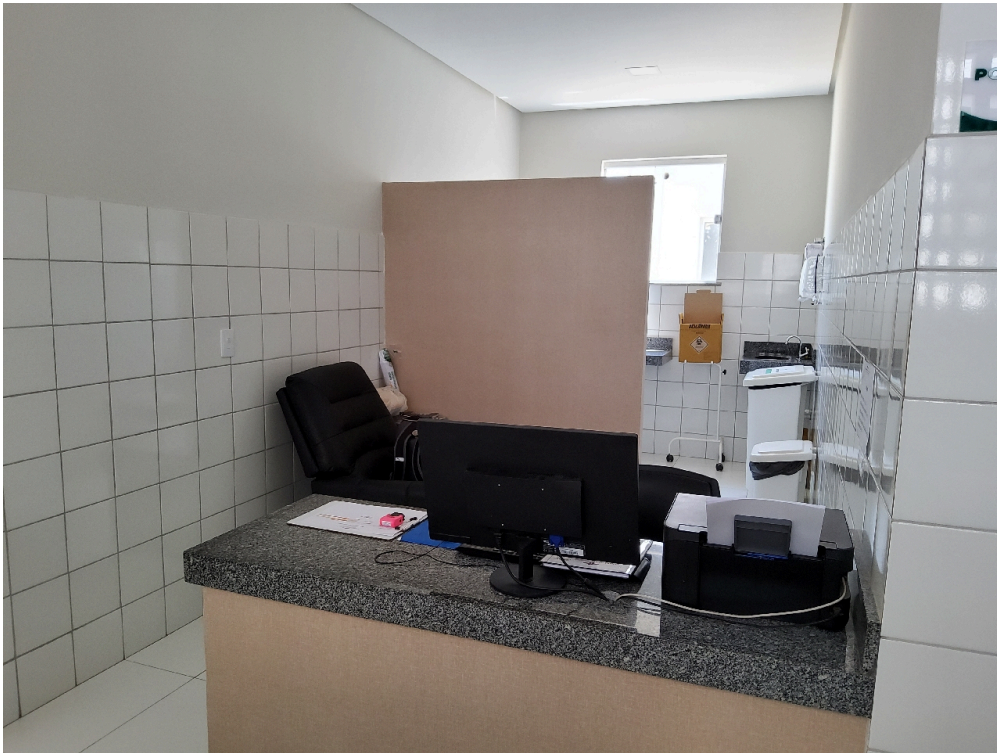
Posto de enfermagem da enfermaria