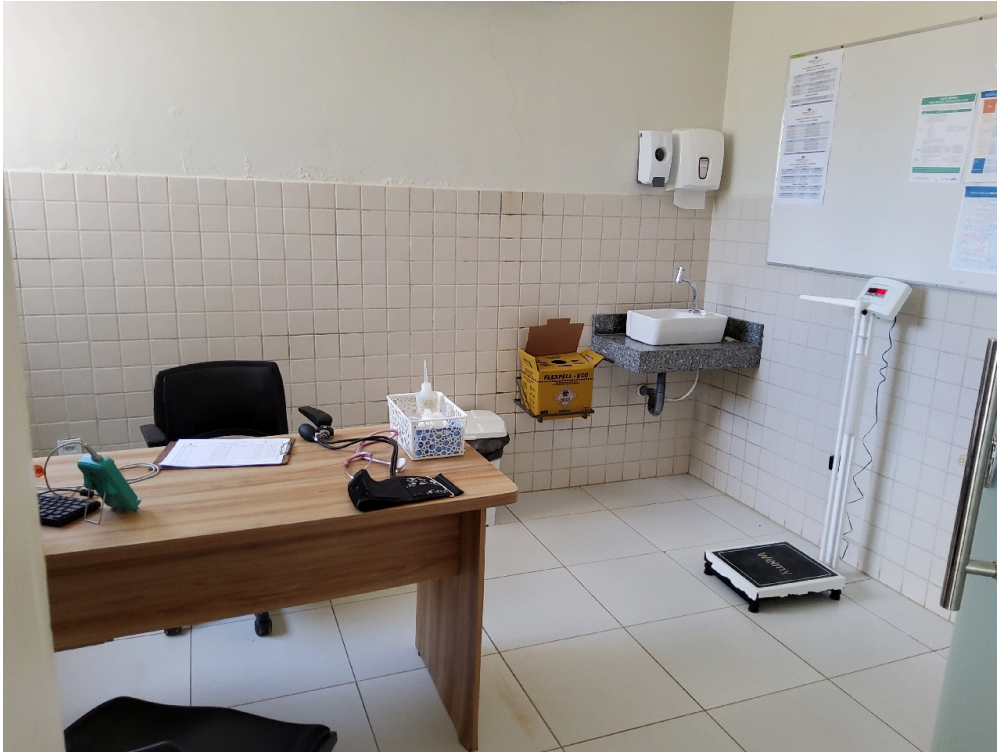
Classificação de risco