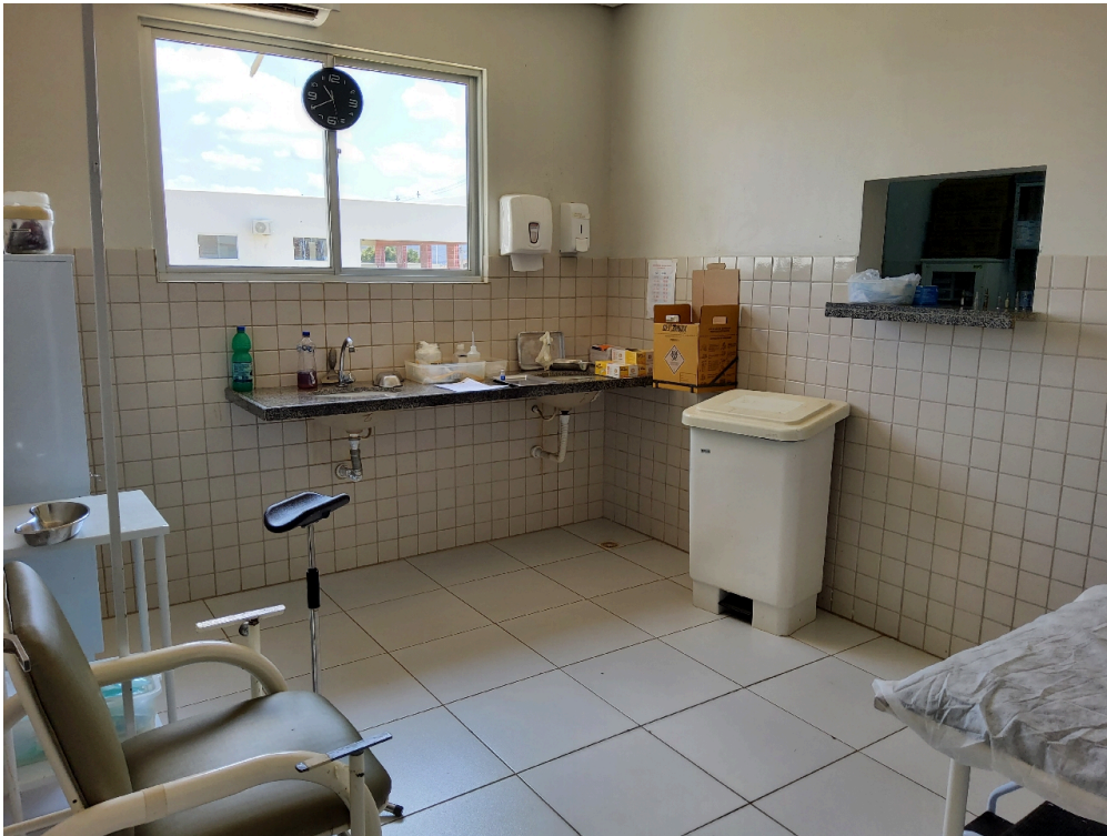
Sala de medicação