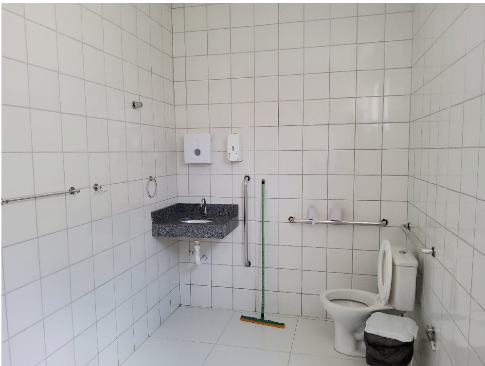
Banheiro da enfermaria