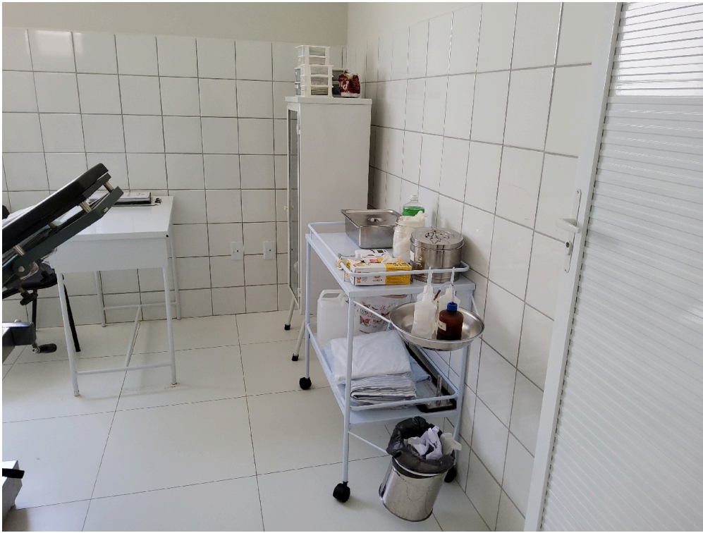
Sala de parto (foto 2)