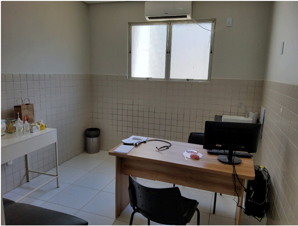
Consultório médico 2