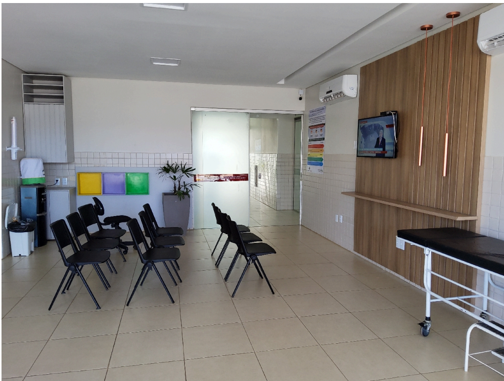
Sala de espera