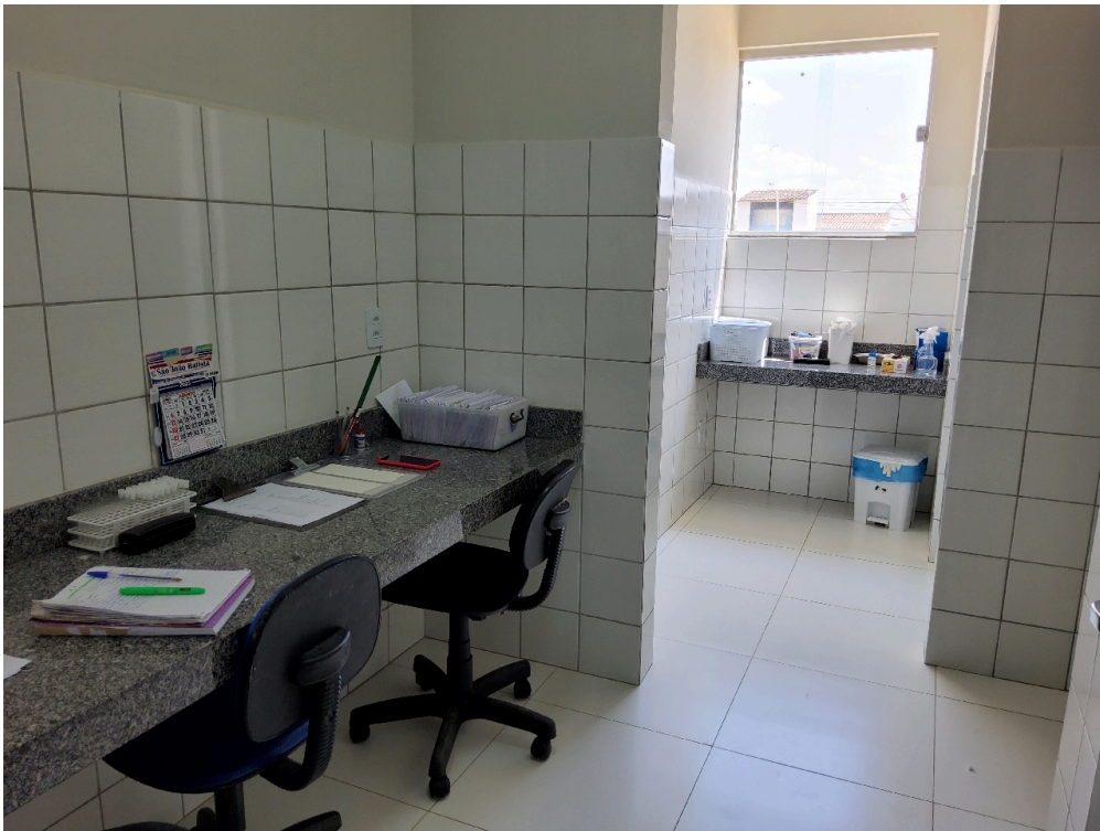
Sala de coleta