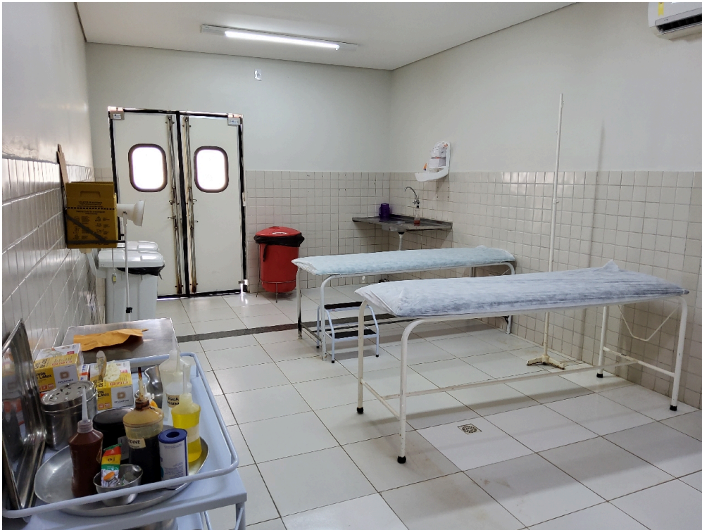
Sala de procedimentos (foto 1)