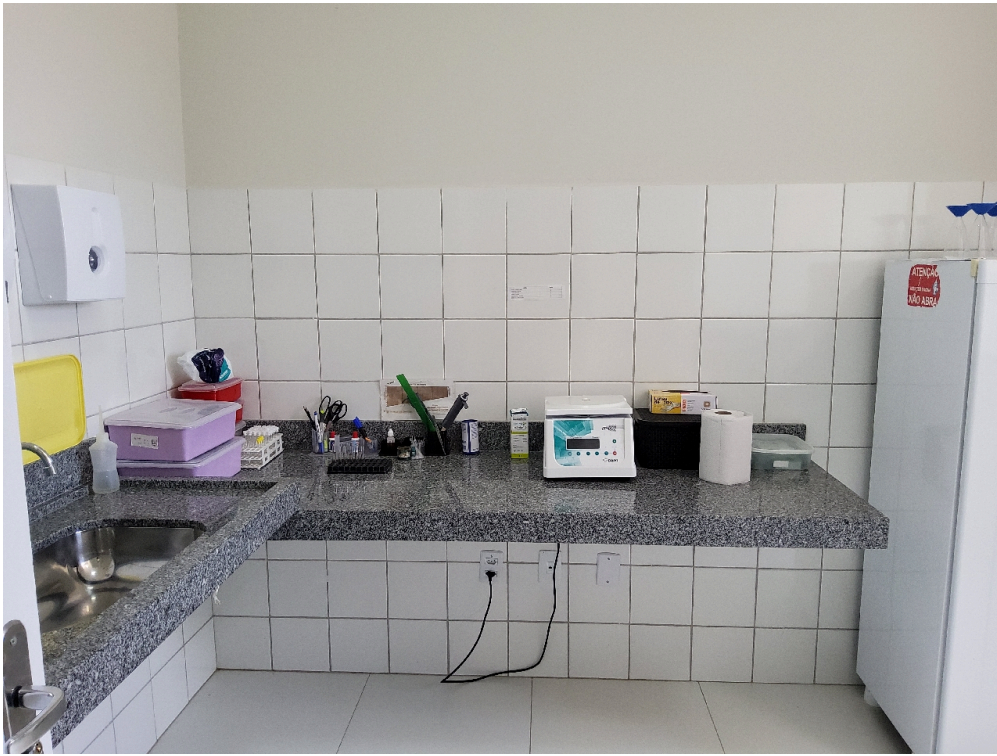
Urínálise e parasito