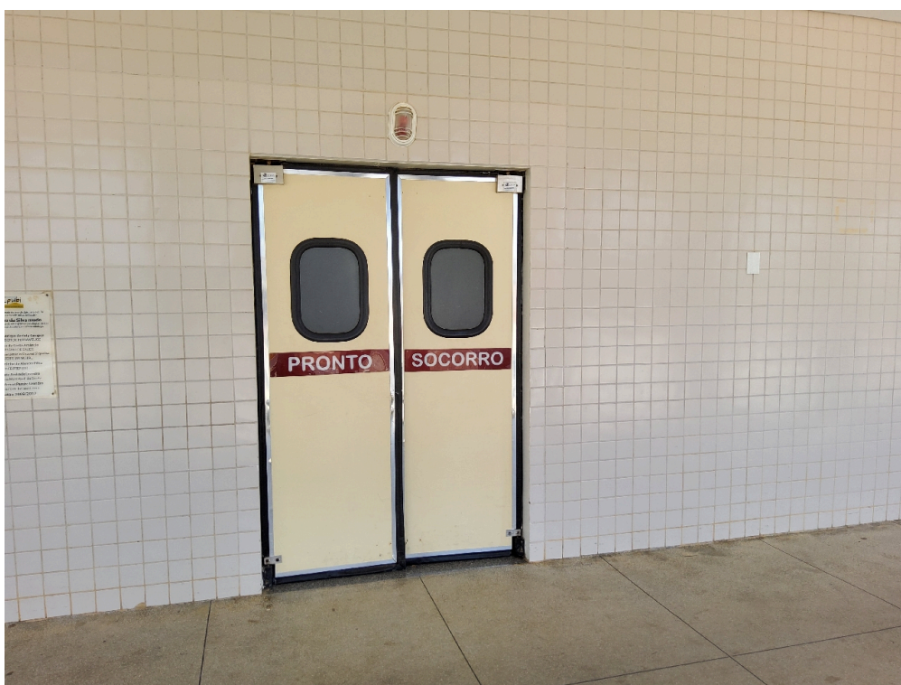
Acesso à sala vermelha