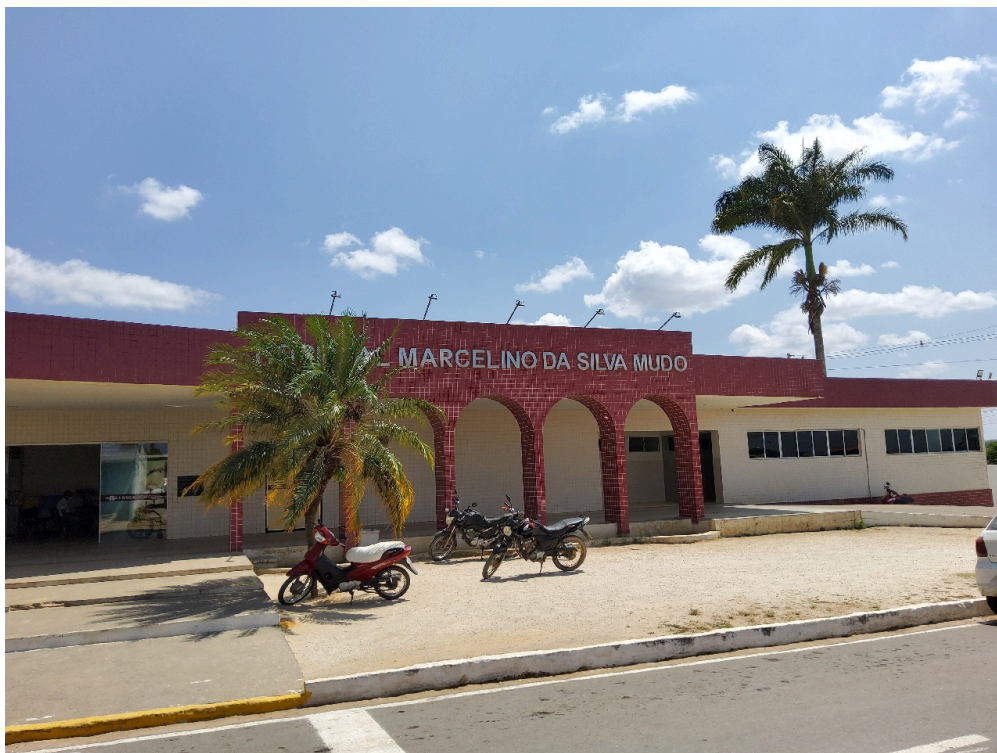
Hspital Municipal Marcelino da Silva Mudo