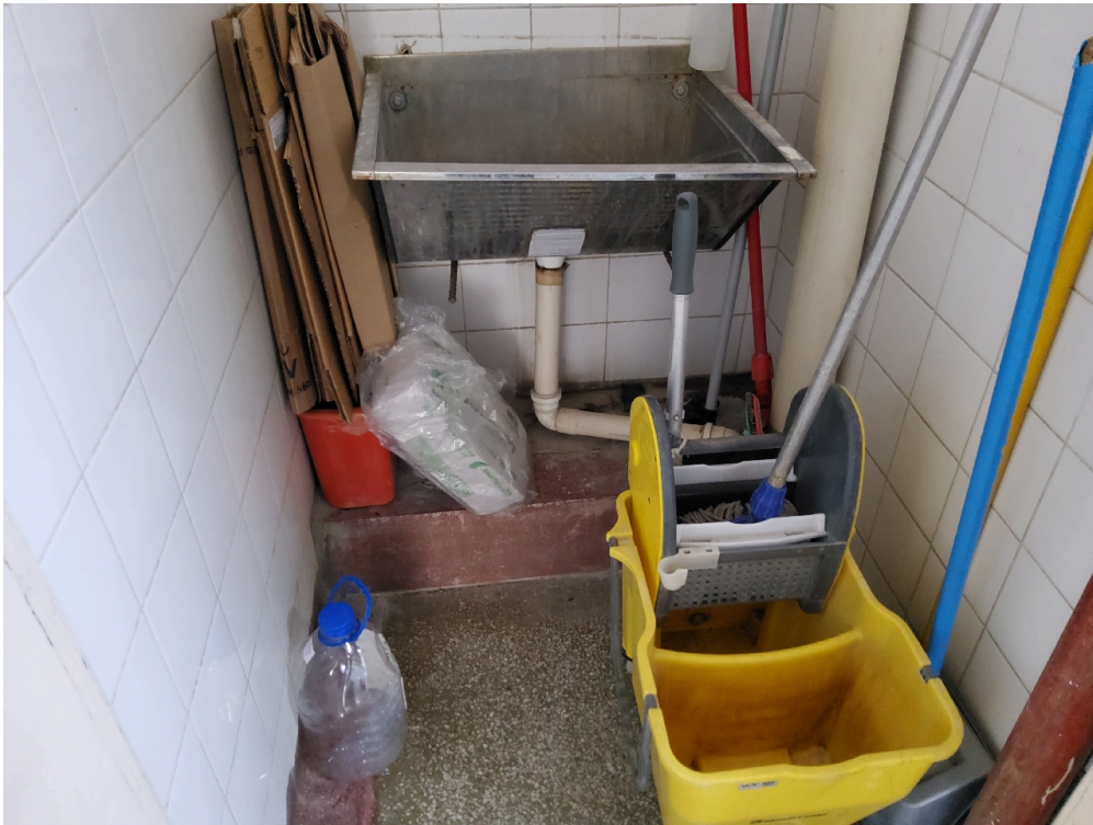
Depósito de material de limpeza (DML)