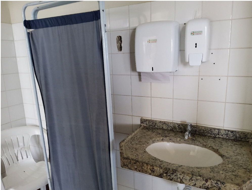
Sinalização de acessos