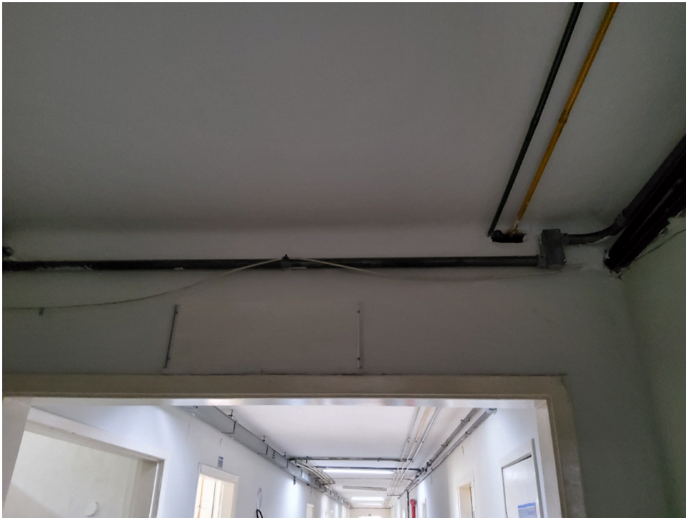
1 posto de enfermagem a cada 30 leitos