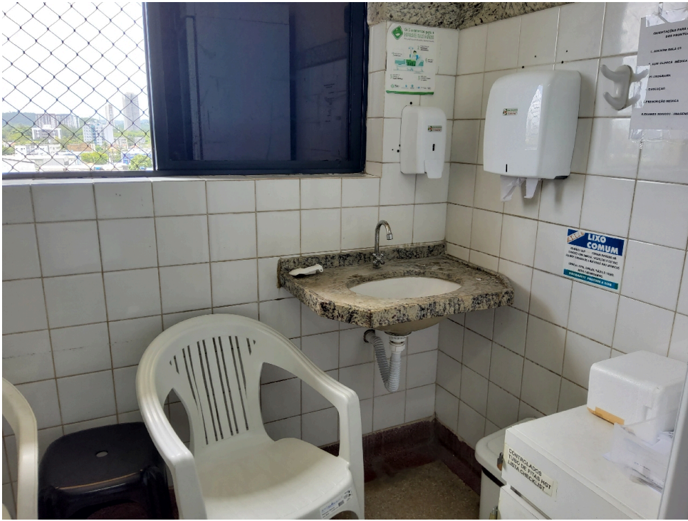
Ambiente com conforto acústico