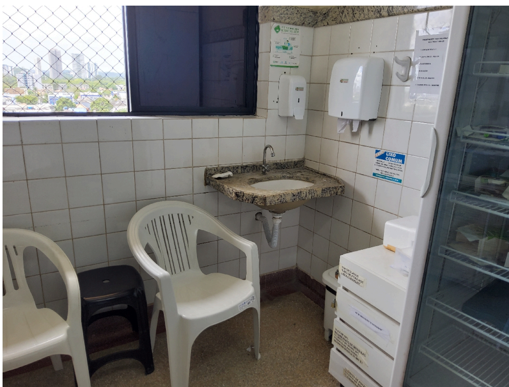
1 posto de enfermagem a cada 30 leitos