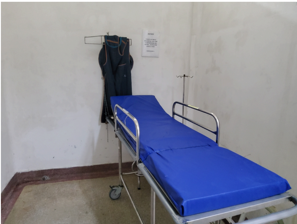
1 posto de enfermagem a cada 30 leitos