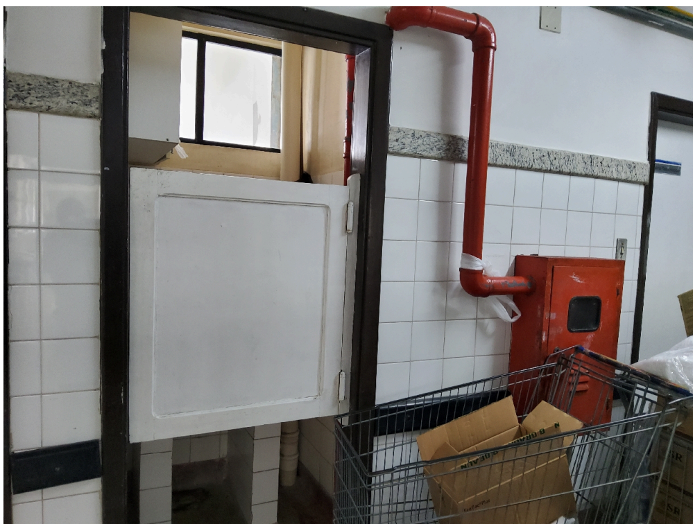
1 posto de enfermagem a cada 30 leitos