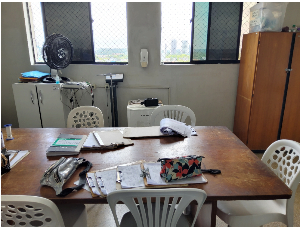
1 posto de enfermagem a cada 30 leitos