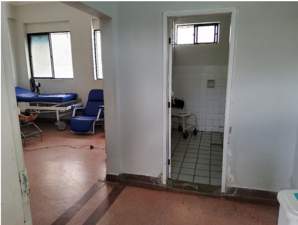
1 posto de enfermagem a cada 30 leitos