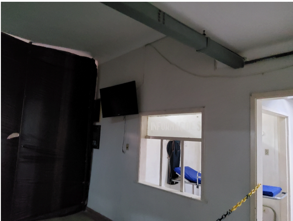
1 posto de enfermagem a cada 30 leitos