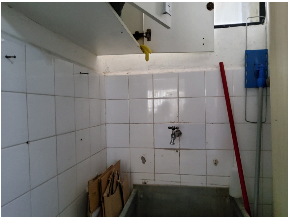
Depósito de material de limpeza (DML)