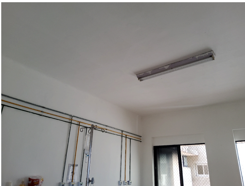
1 posto de enfermagem a cada 30 leitos