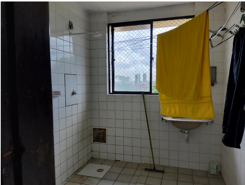
Sinalização de acessos