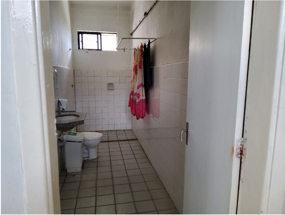
1 posto de enfermagem a cada 30 leitos