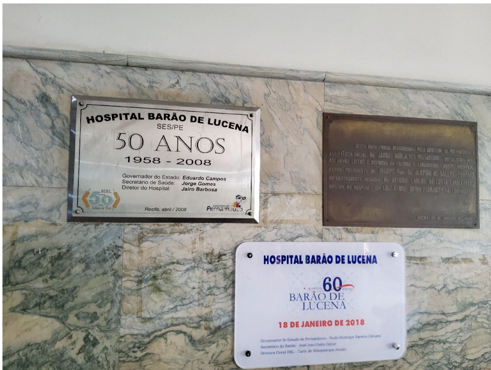
Natureza do Serviço