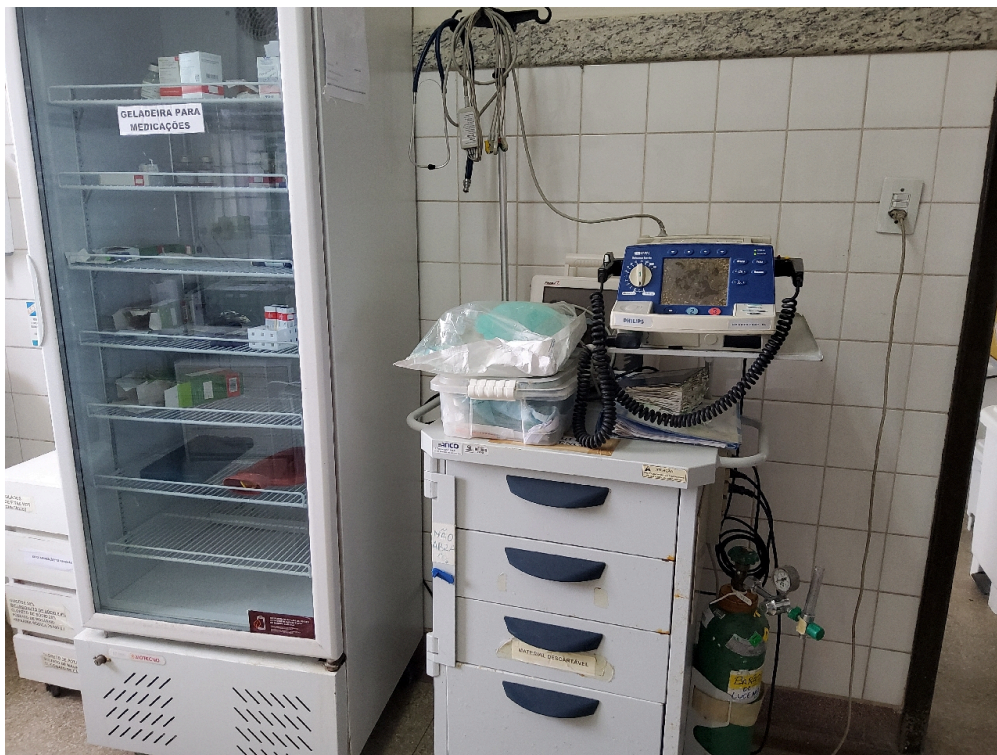
1 posto de enfermagem a cada 30 leitos