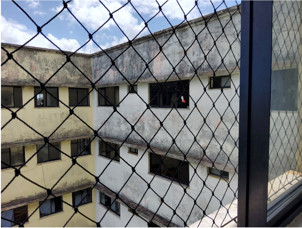
1 posto de enfermagem a cada 30 leitos