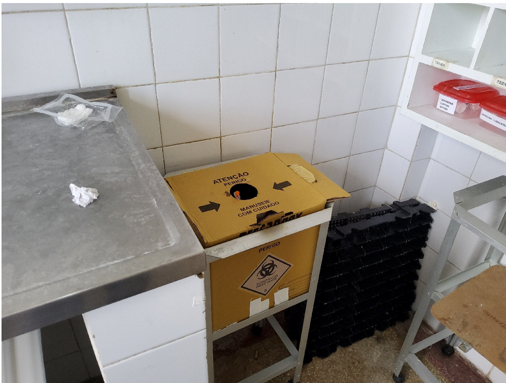
Recipiente rígido para descarte de material perfurocortante