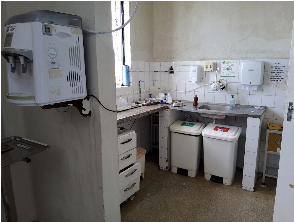
1 posto de enfermagem a cada 30 leitos