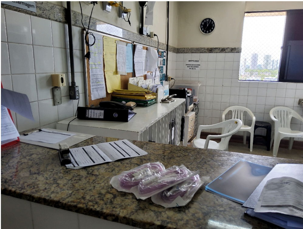
1 posto de enfermagem a cada 30 leitos