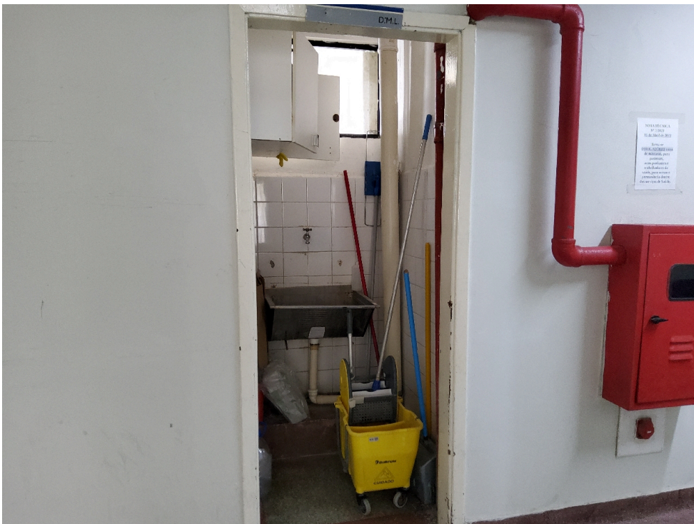
Depósito de material de limpeza (DML)