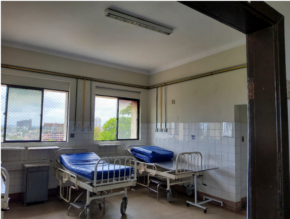
Ambiente com conforto térmico