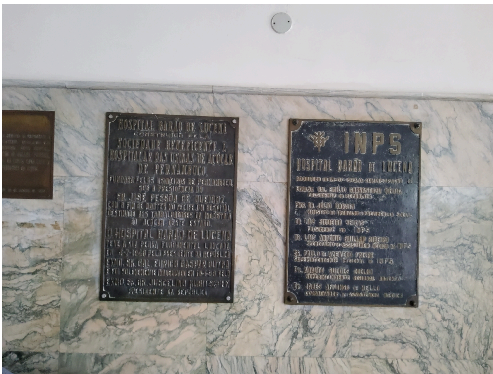
Natureza do Serviço