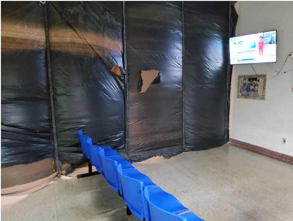
1 posto de enfermagem a cada 30 leitos