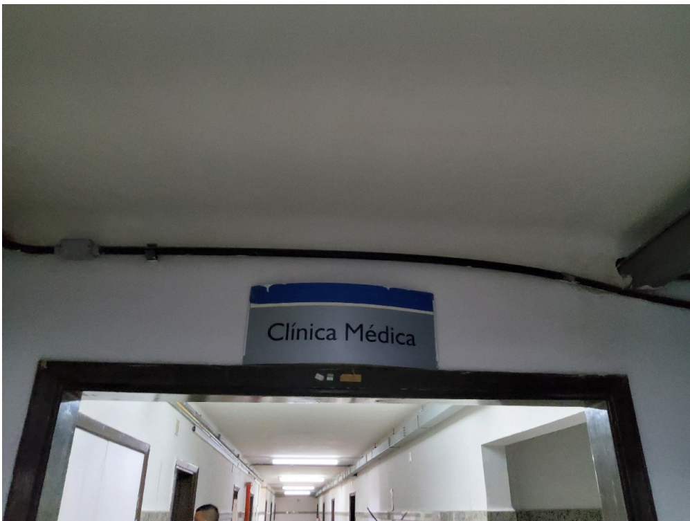
1 posto de enfermagem a cada 30 leitos