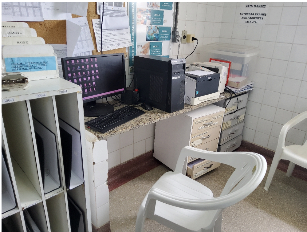
1 posto de enfermagem a cada 30 leitos