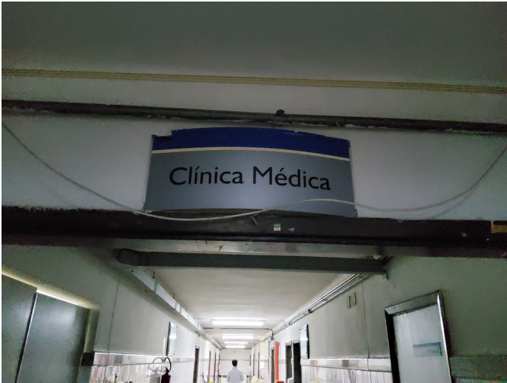
1 posto de enfermagem a cada 30 leitos