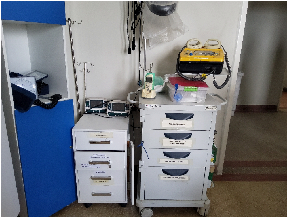
1 posto de enfermagem a cada 30 leitos