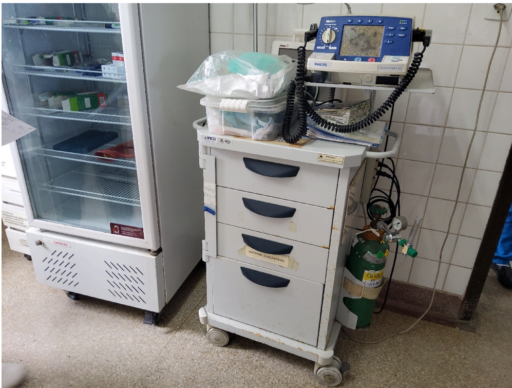
Ambiente com conforto térmico