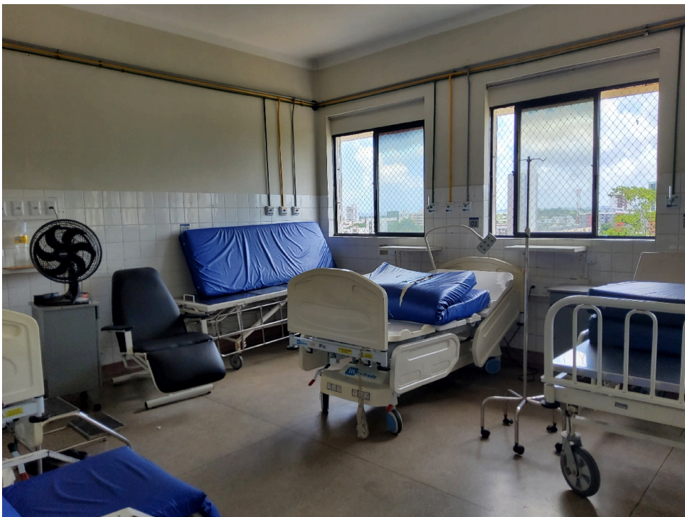
Sinalização de acessos