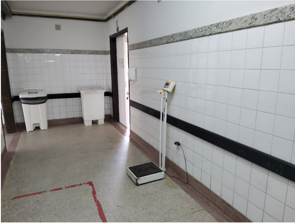
Ambiente com boas condições de higiene e limpeza