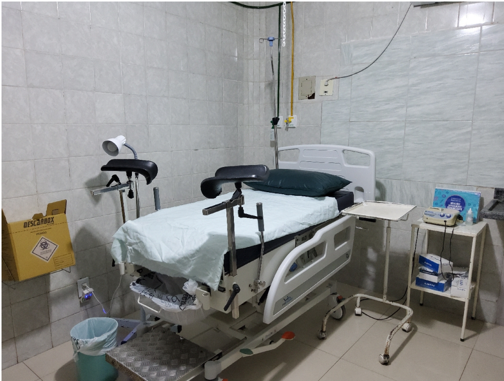
Sala de parto (foto 1)