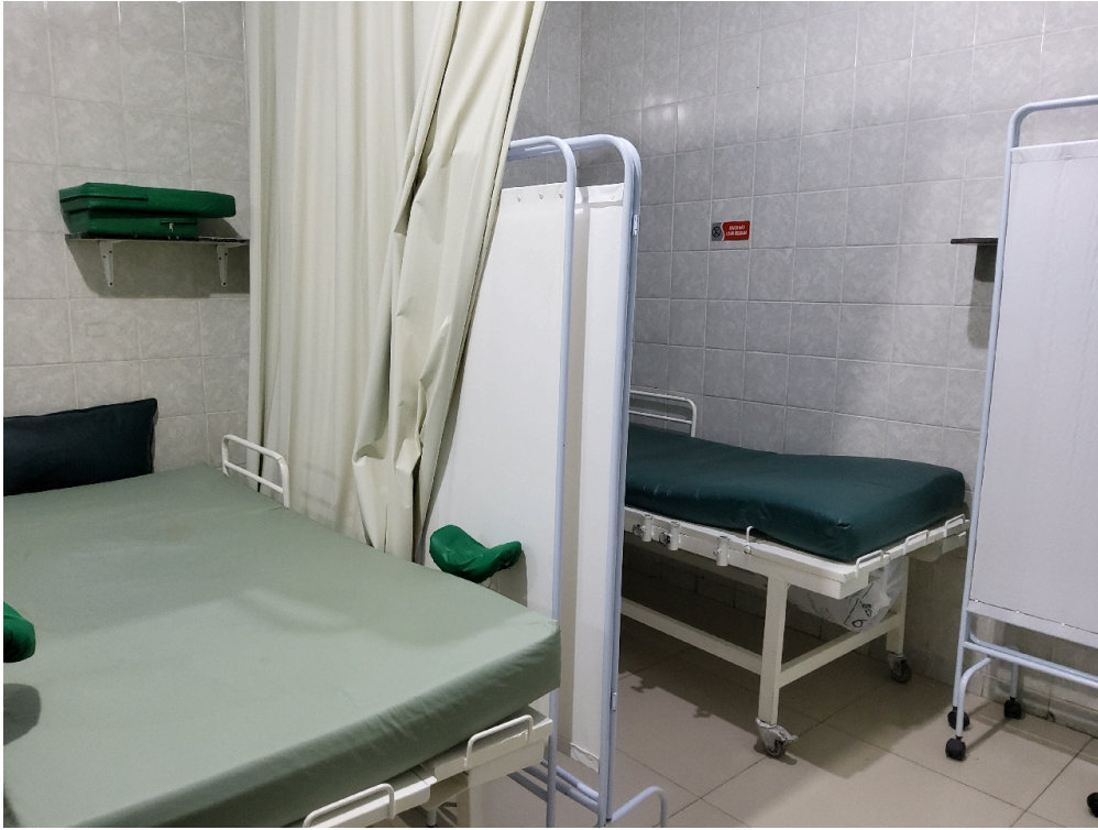
Expectação (foto 1)