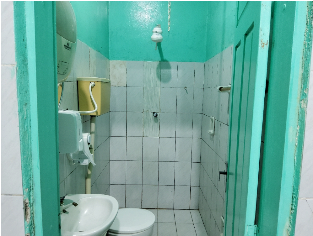
Banheiro do alojamento conjunto (porta estreita)