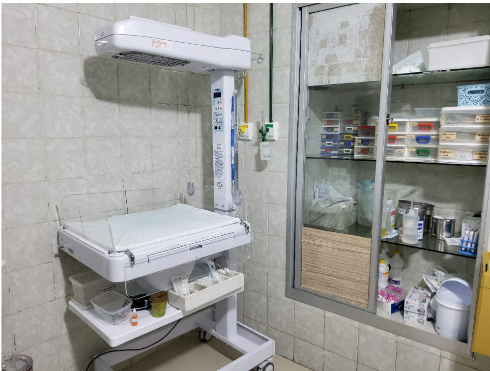
Sala de parto (foto 2)