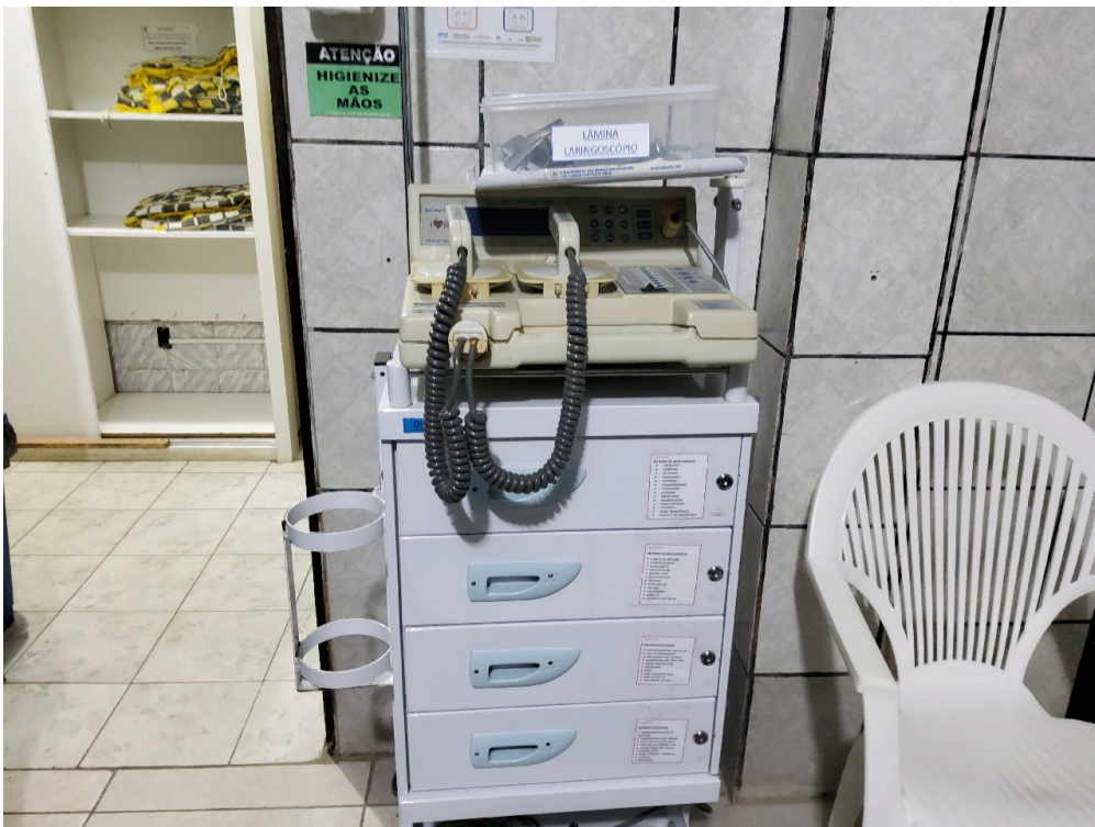
Carrinho de parada do alojamento conjunto