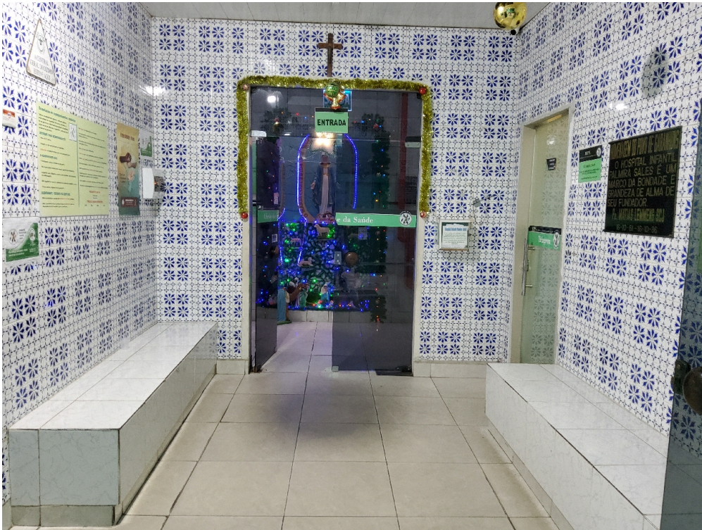
Recepção e sala de espera