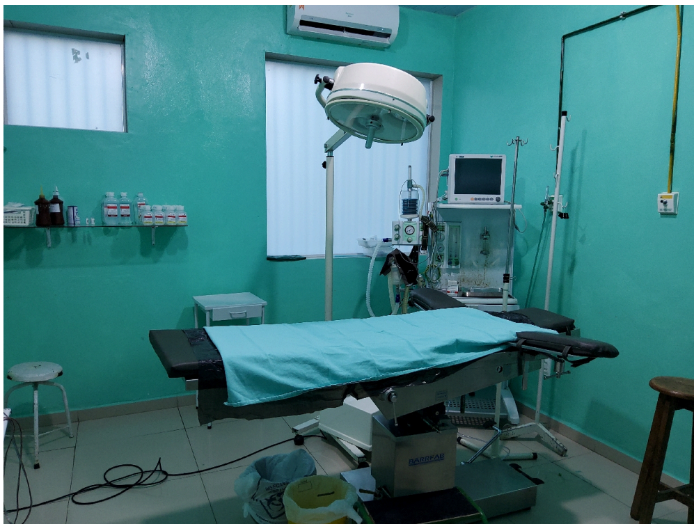
Sala cirúrgica obstétrica (foto 1)