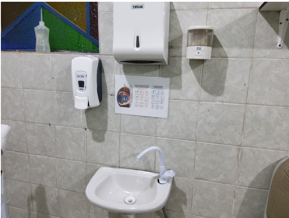
Pia da expectação