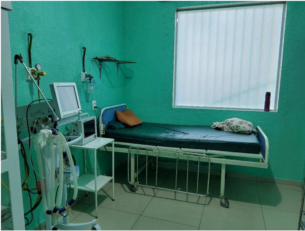
Sala de recuperação pós-anestésica