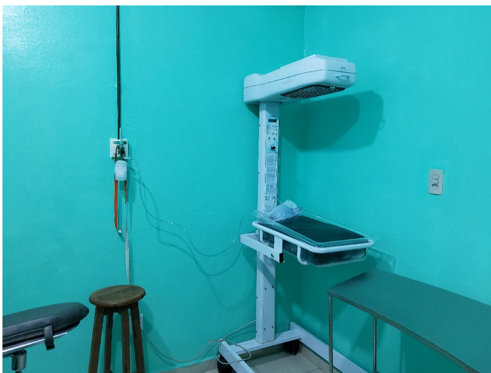
Sala cirúrgica obstétrica (foto 2)