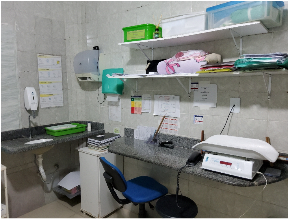
Sala de parto (foto 3)