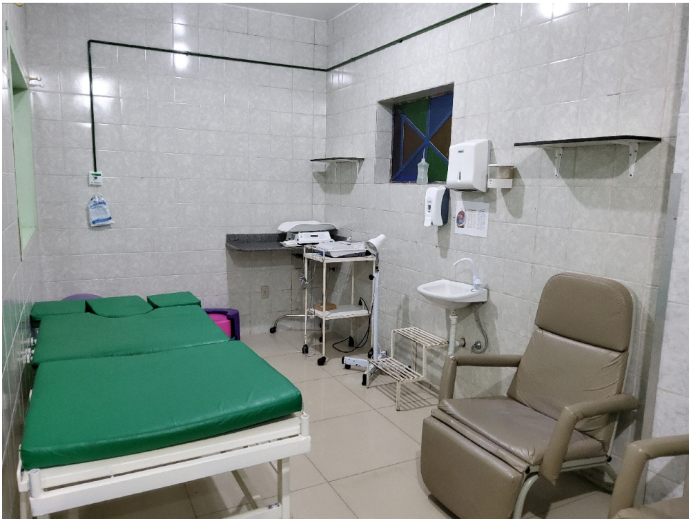
Expectação (foto 2)