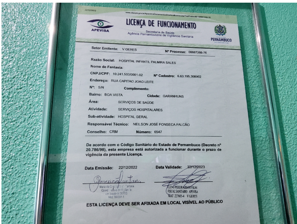
Alvará da Vigilância Sanitária