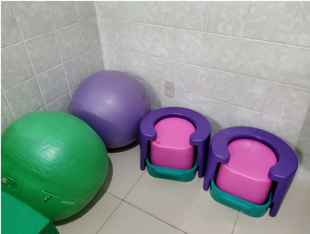
Banquetas e bolas