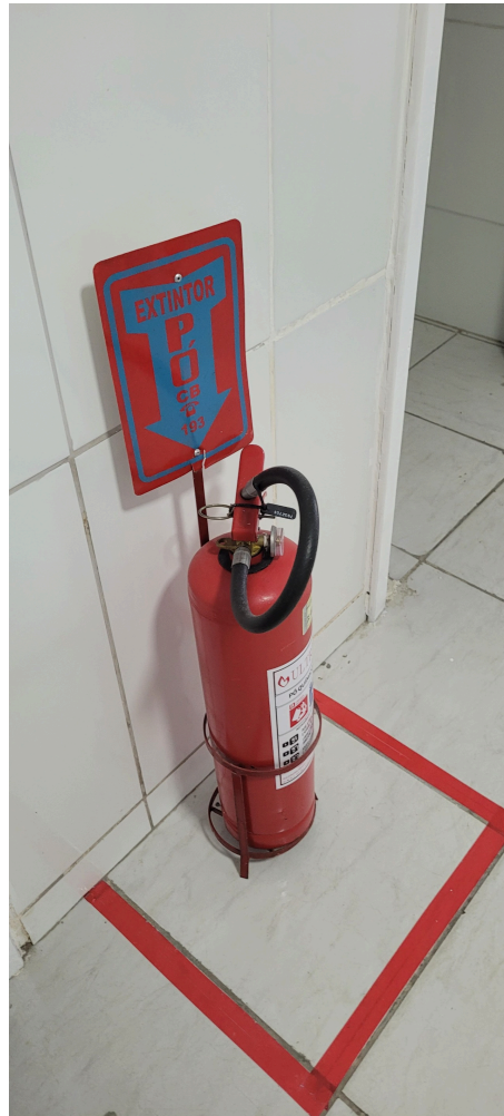
extintor de incêndio