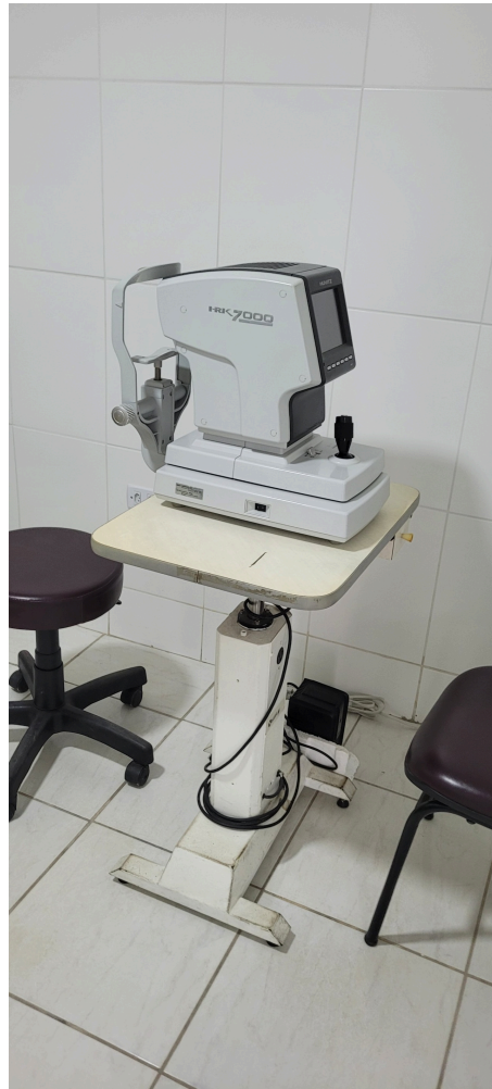
refratômetro fica em outra sala