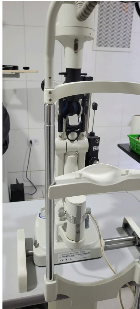
lâmpada de fenda