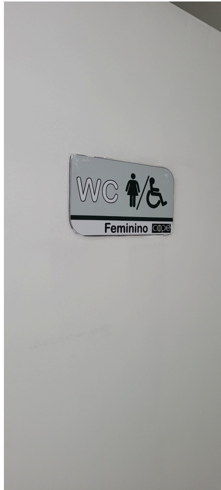
banheiros para usuários