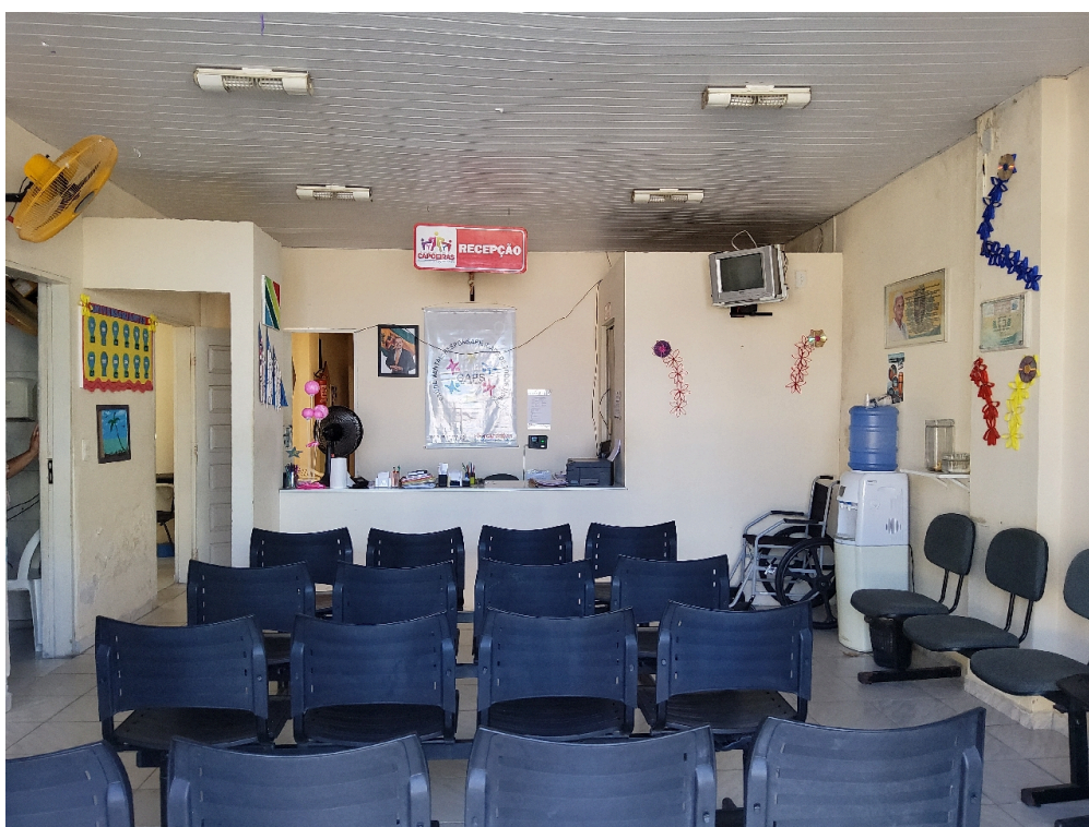
Recepção e sala de espera