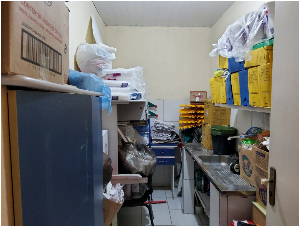
Almoxarifado, arquivo e DML no mesmo local