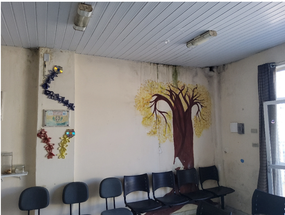
Artes dos pacientes (observar infiltração na parede)