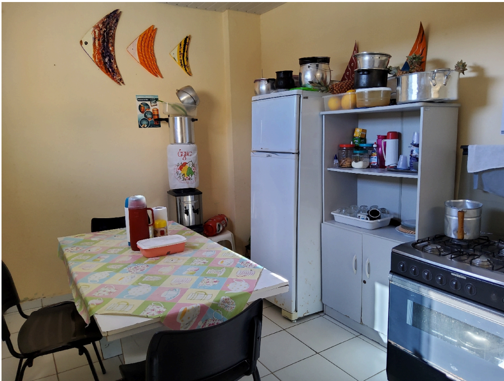
Cozinha (foto 2)