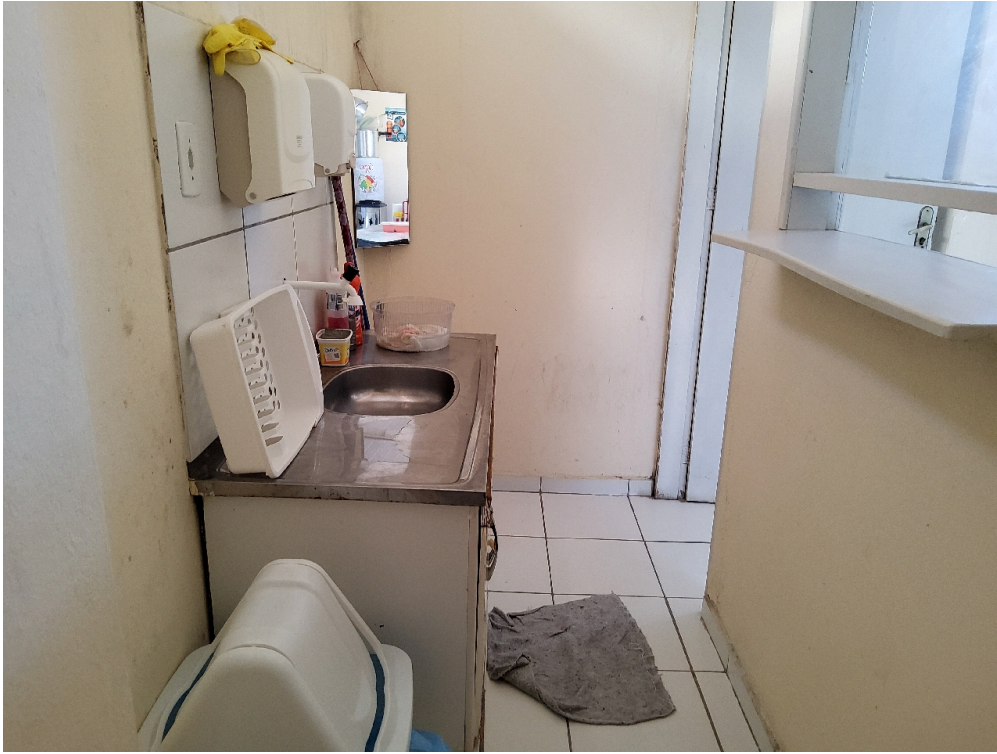
Cozinha (foto 1)