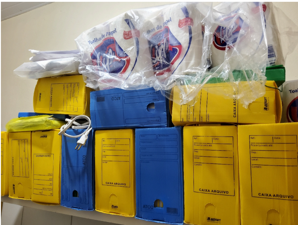
Local de guarda de prontuários em local comum