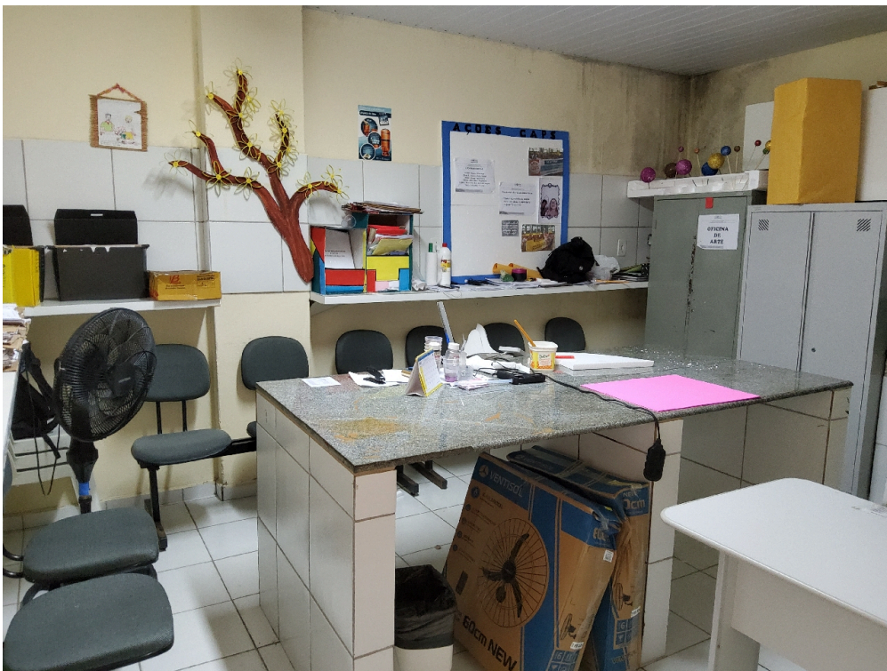
Sala de grupos e oficinas (observar infiltração)