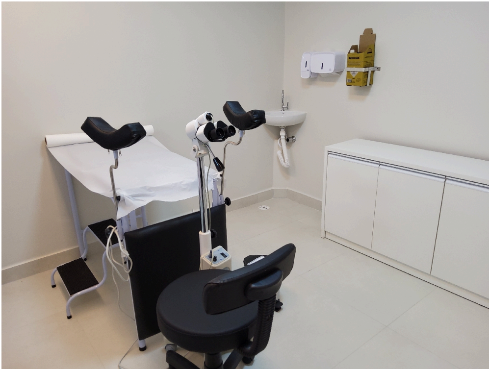
Consultório ginecológico com colposcópio (foto 2)