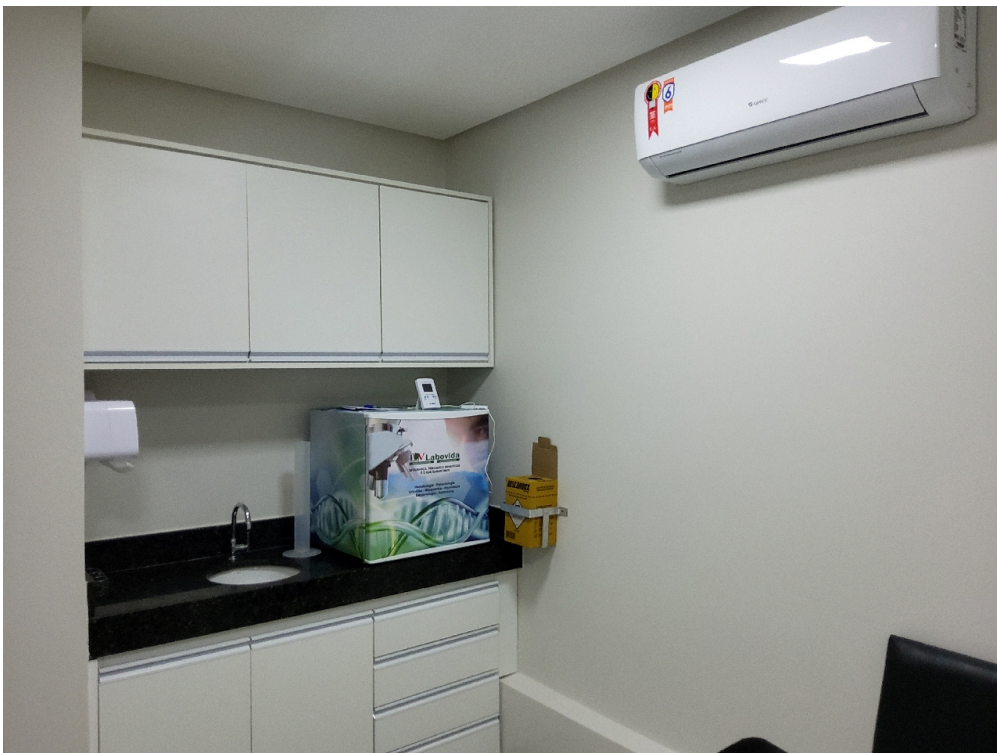
Sala de coleta (foto 2)