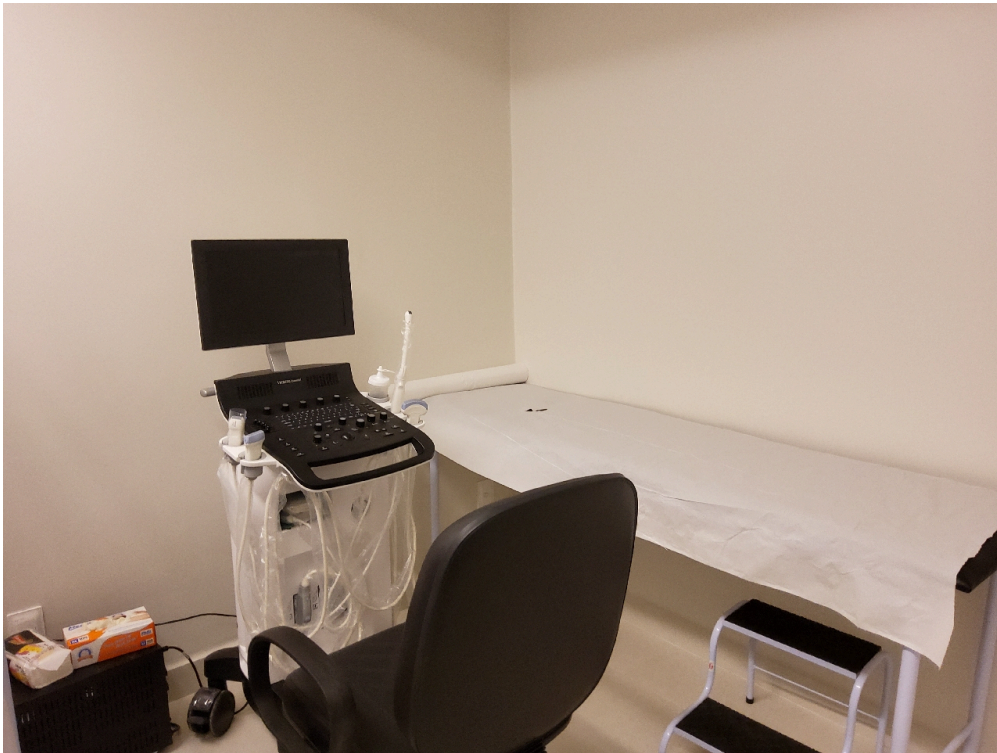
Sala de ultrassonografia