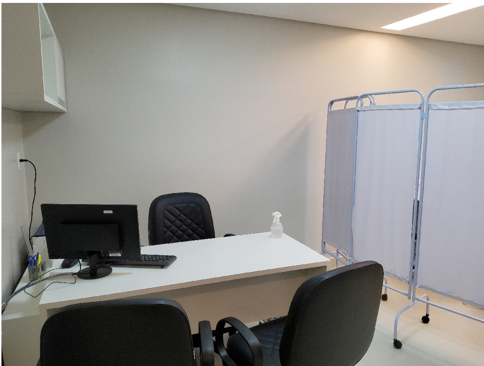
Consultório ginecológico (foto 1)