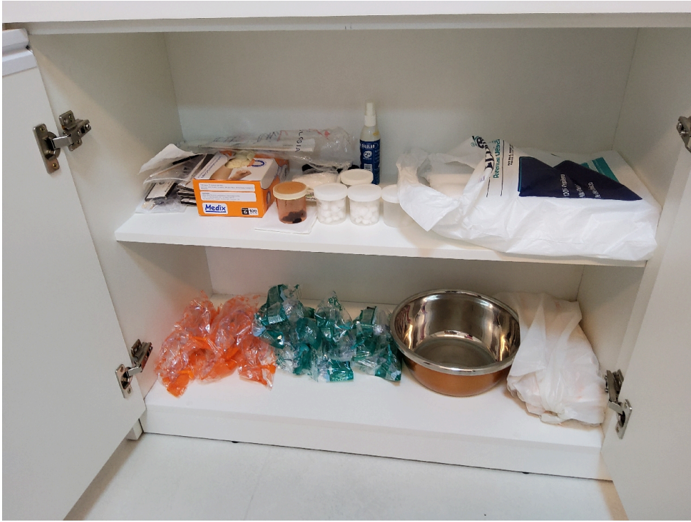
Material para exame ginecológico