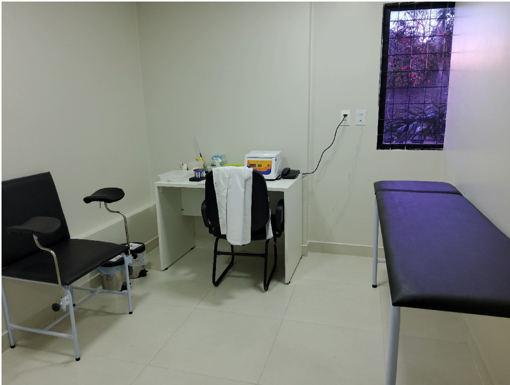
Sala de coleta (foto 1)