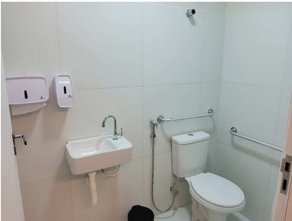
Banheiro da sala de ultrassonografia