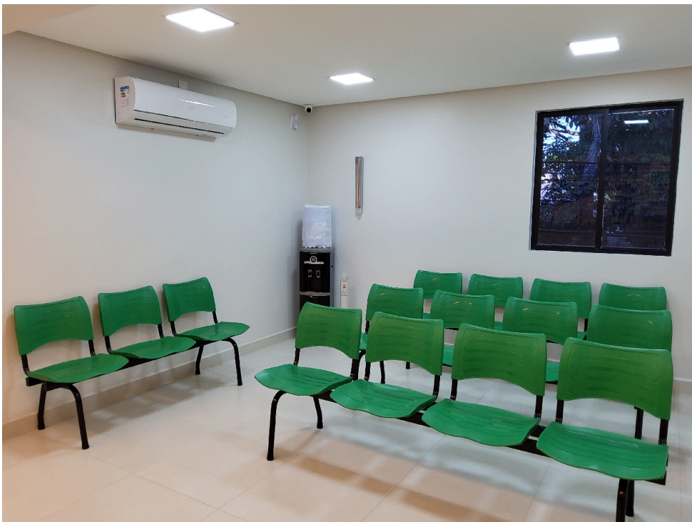
Recepção do primeiro andar