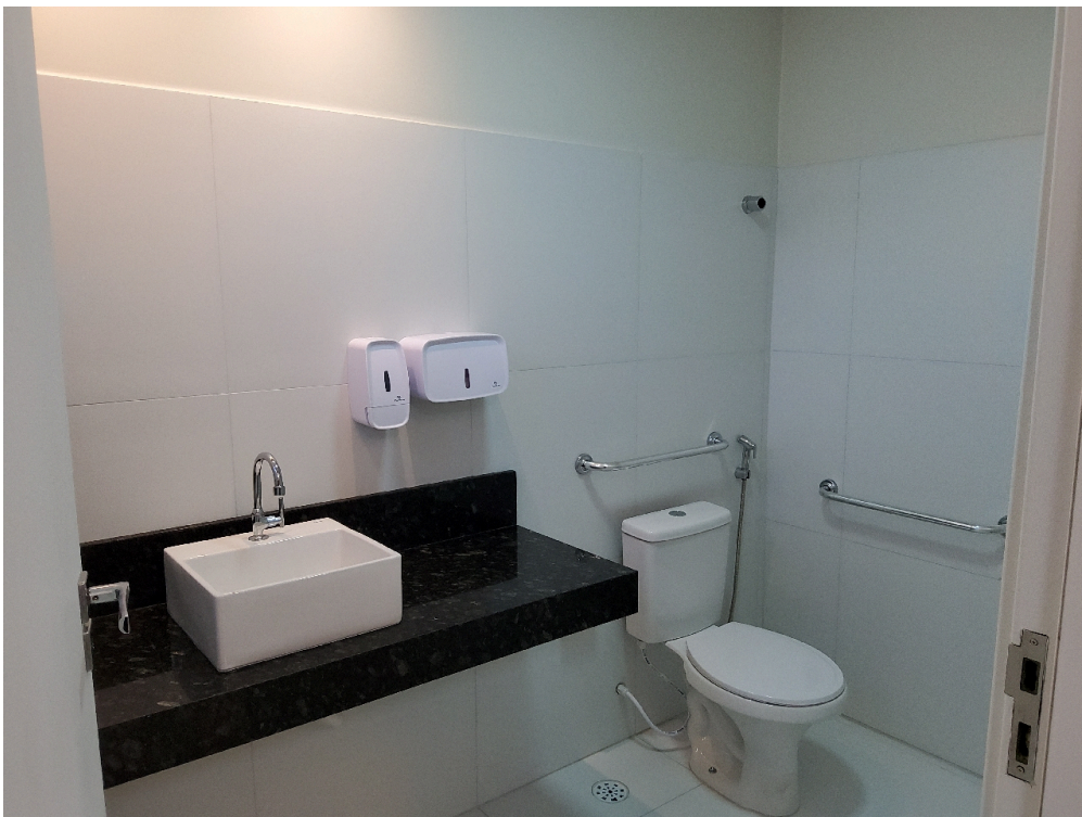
Banheiro do consultório ginecológico