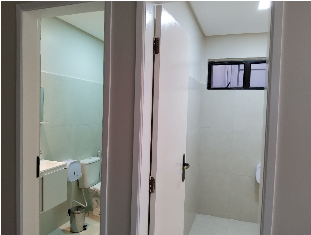
Banheiro dos funcionários