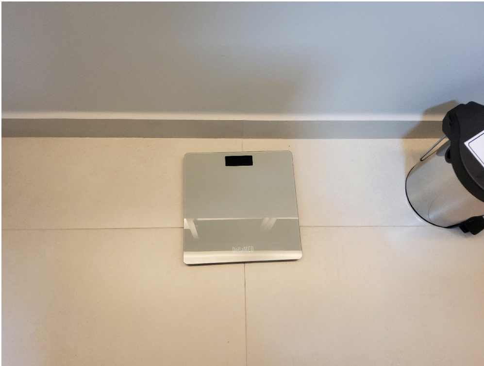
Item não conforme: 1 balança antropométrica adequada à faixa etária