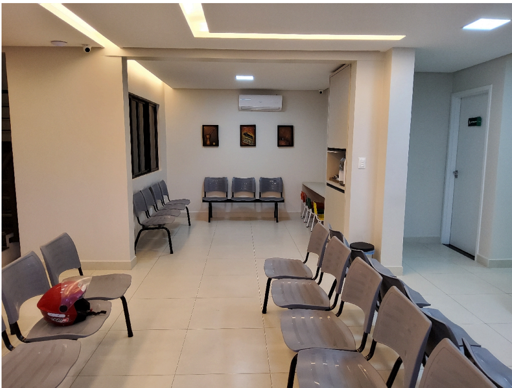
Sala de espera do térreo