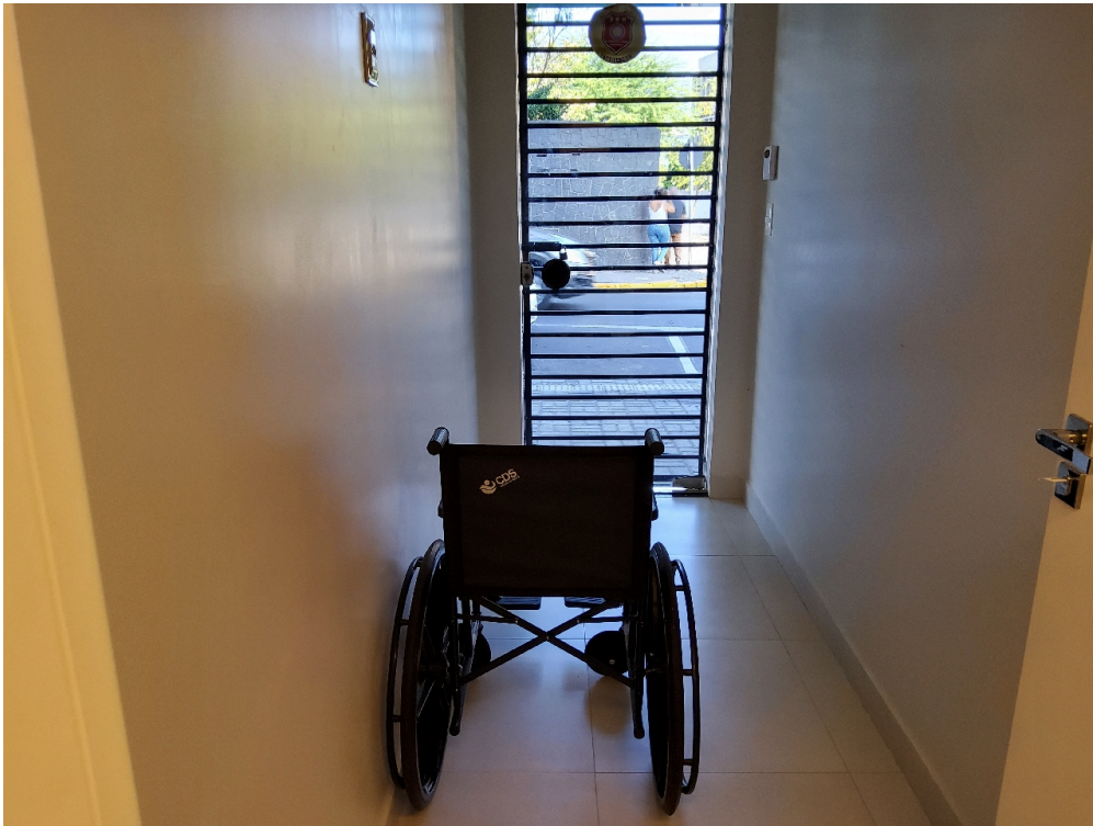
Local de guarda de cadeira de rodas