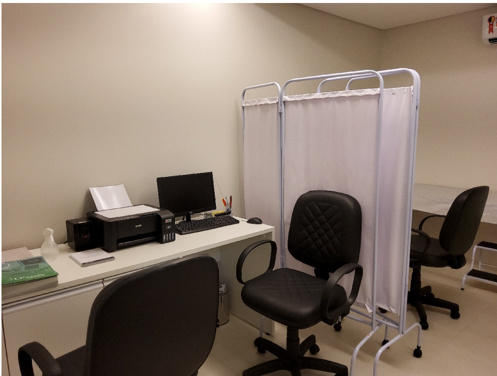
Sala de ultrassonografia (foto 1)