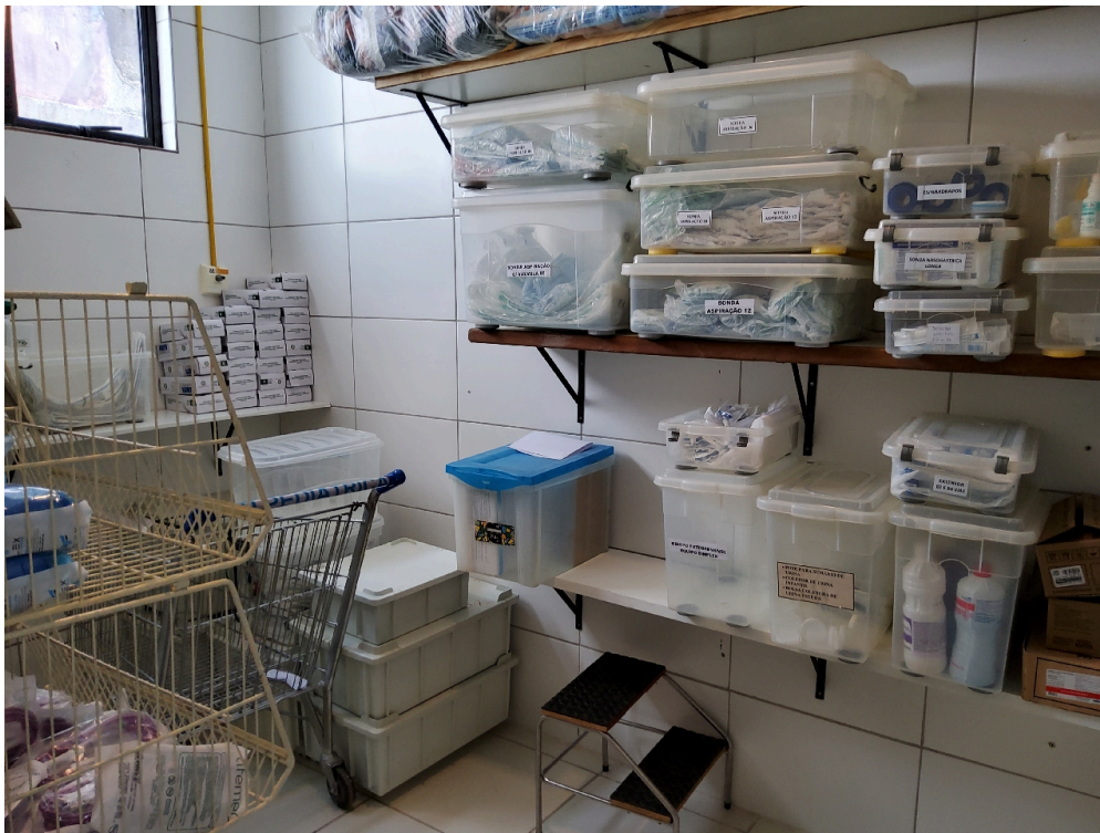
Depósito de equipamentos e materiais