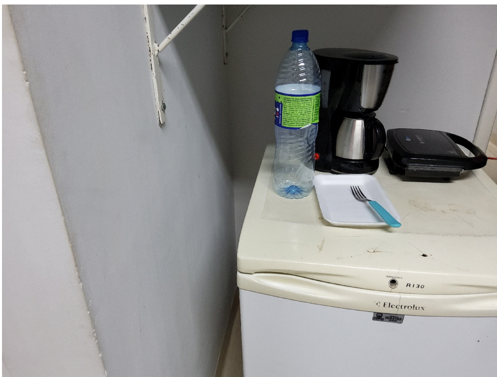
Cafeteira ou garrafa térmica