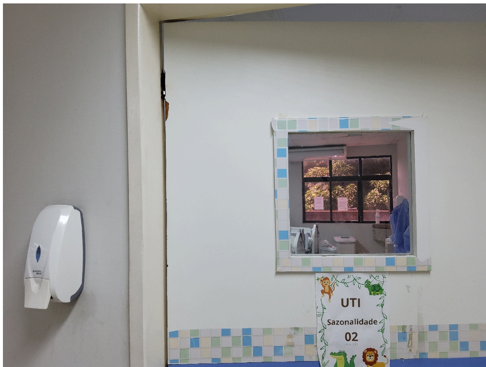
Ambiente com conforto térmico