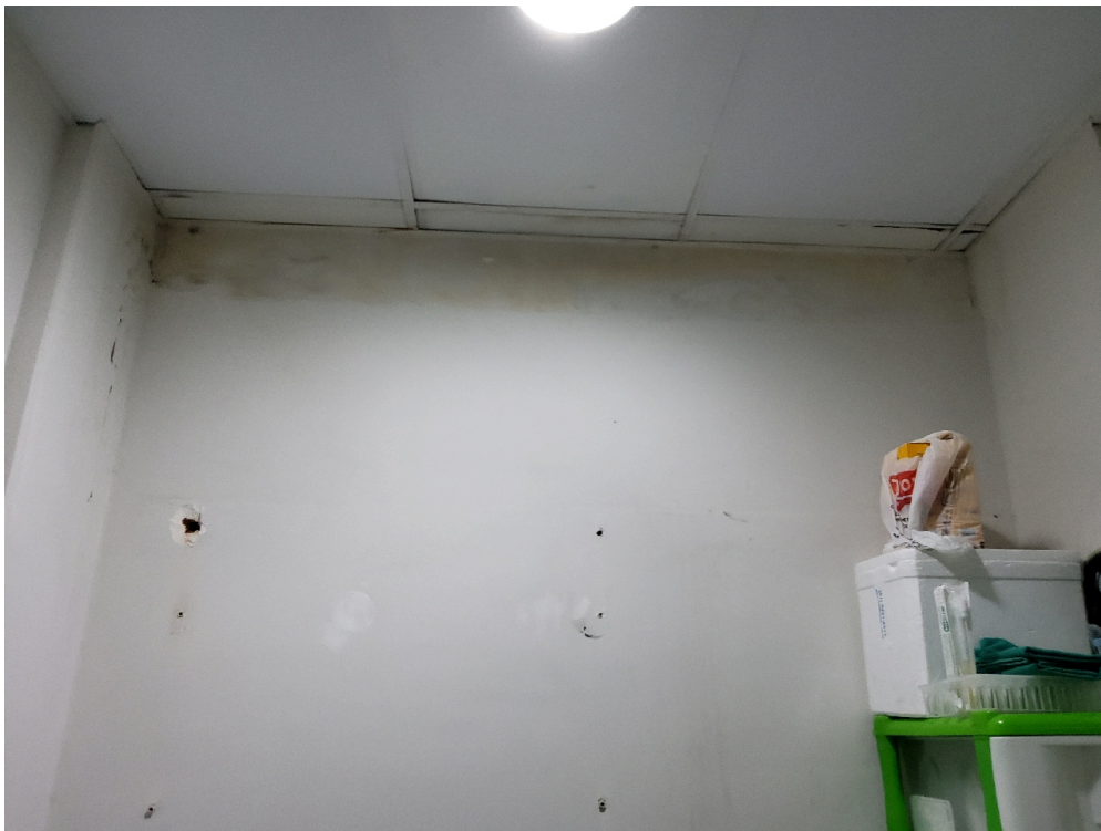
Depósito de equipamentos e materiais