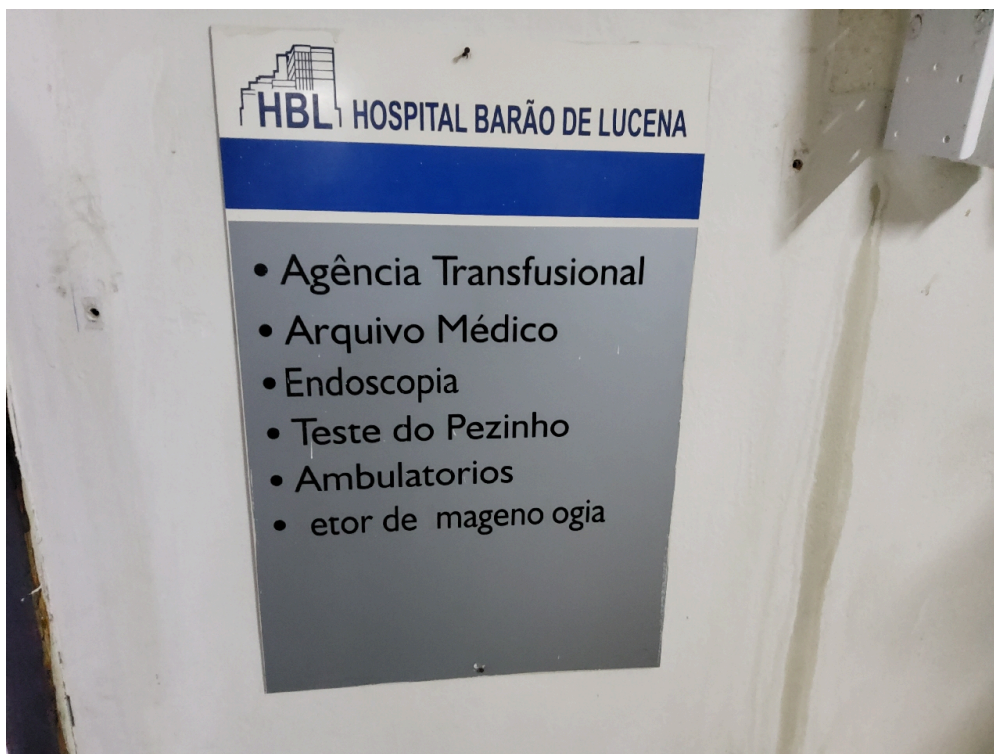
Sinalização de acessos