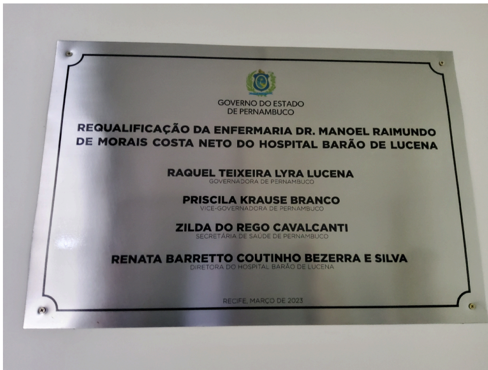
Sinalização de acessos