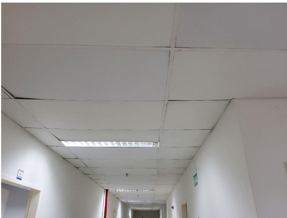
Ambiente com conforto térmico