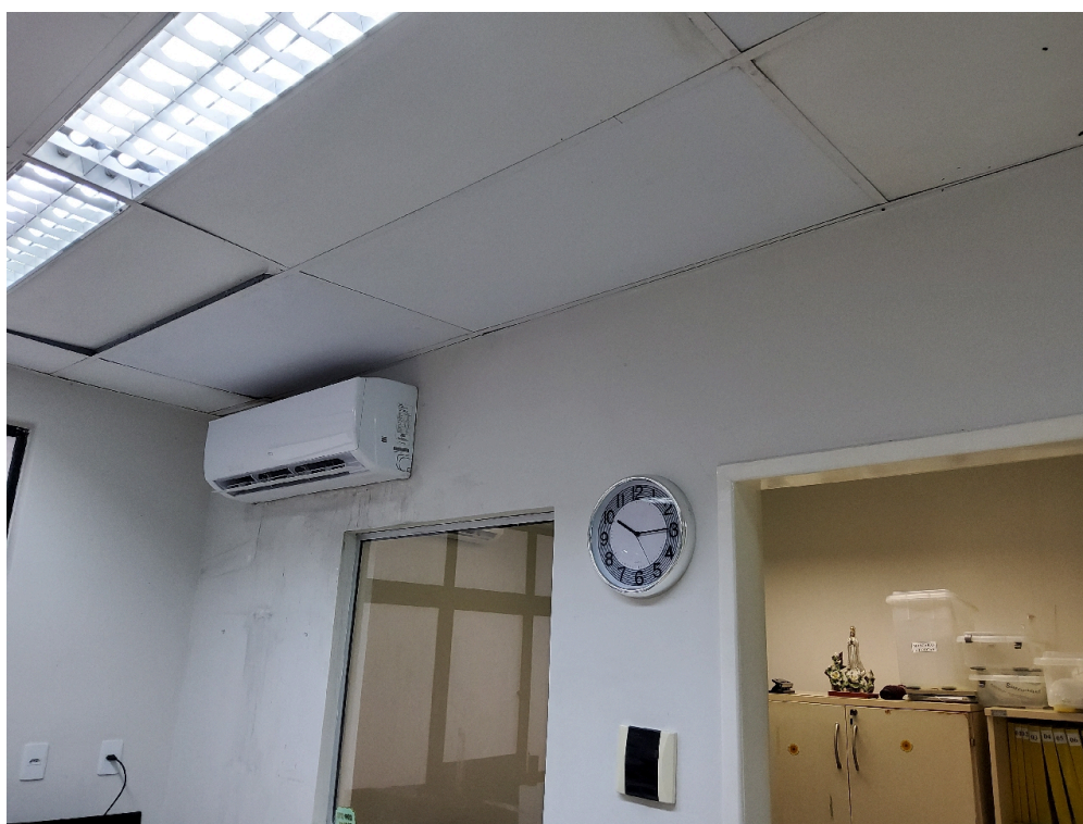
Ambiente com conforto térmico