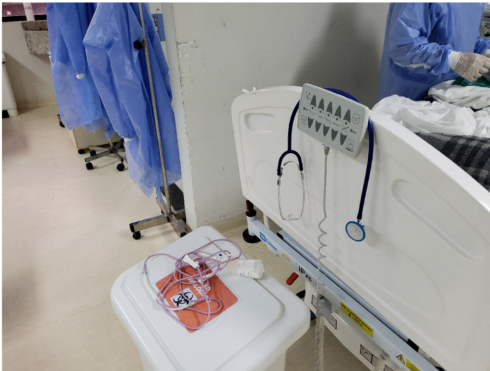
Item não conforme: Poltrona removível com revestimento impermeável para acompanhante (um por leito)