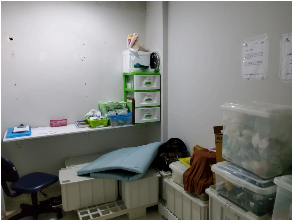
Depósito de equipamentos e materiais