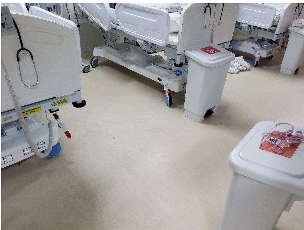
Item não conforme: Poltrona removível com revestimento impermeável para acompanhante (um por leito)