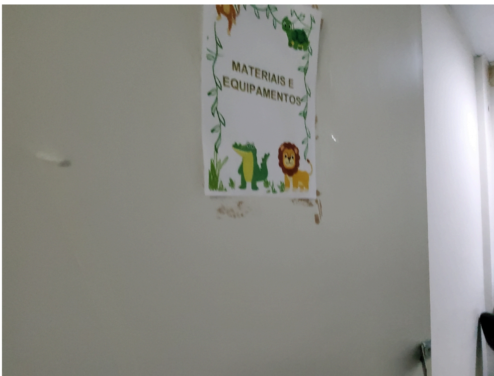
Depósito de equipamentos e materiais