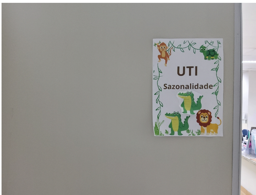
Sinalização de acessos