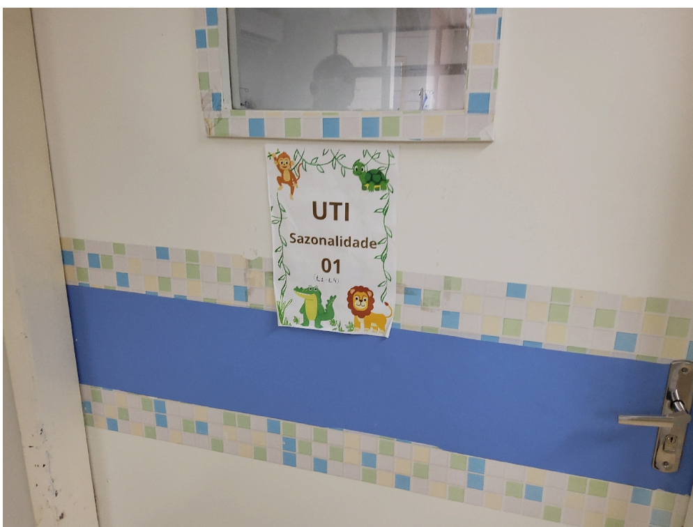
Sinalização de acessos