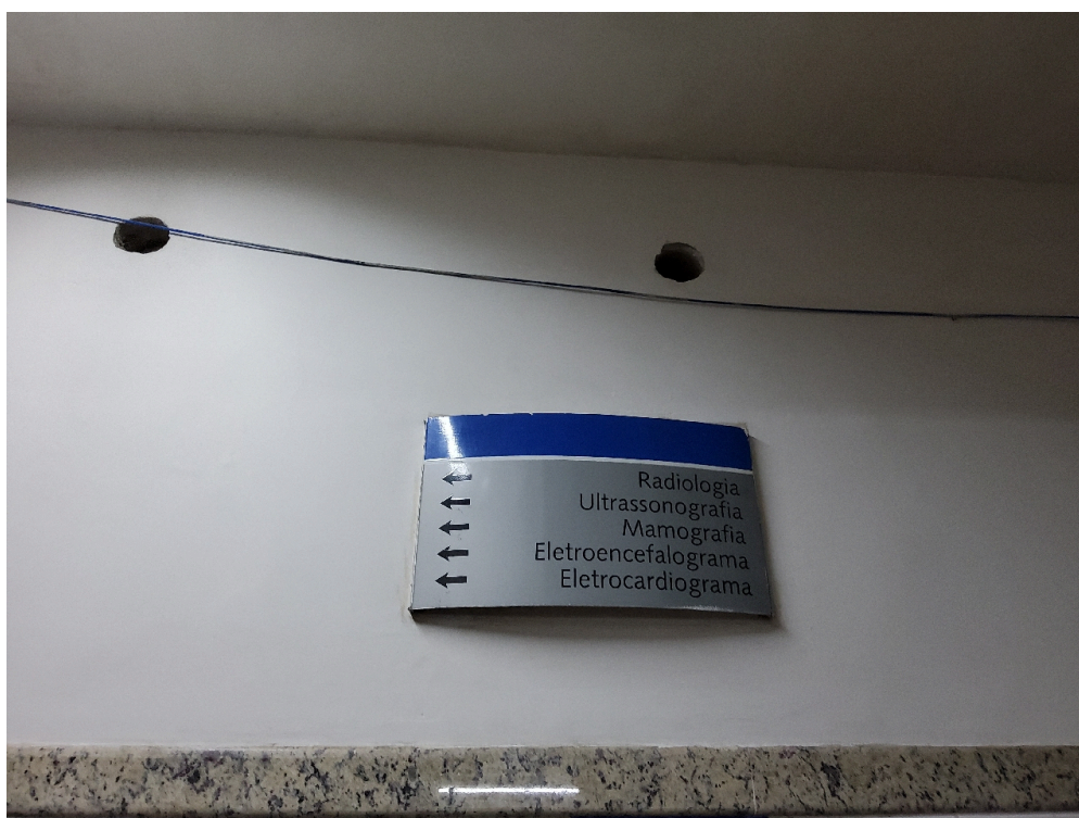
Sinalização de acessos