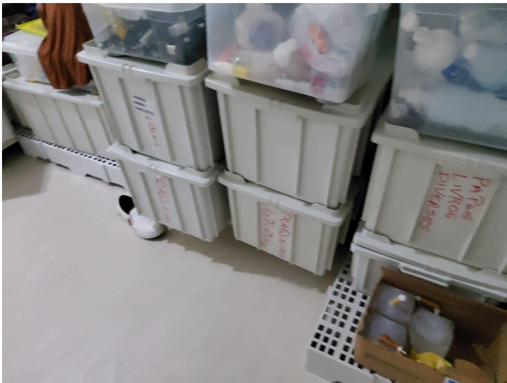
Depósito de equipamentos e materiais