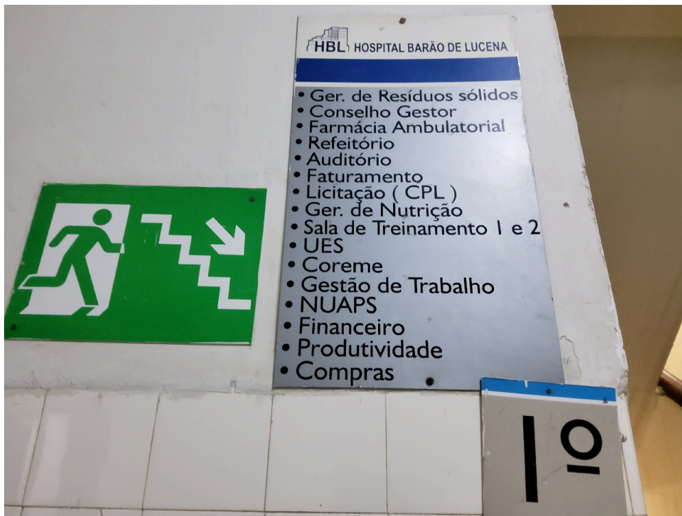
Sinalização de acessos