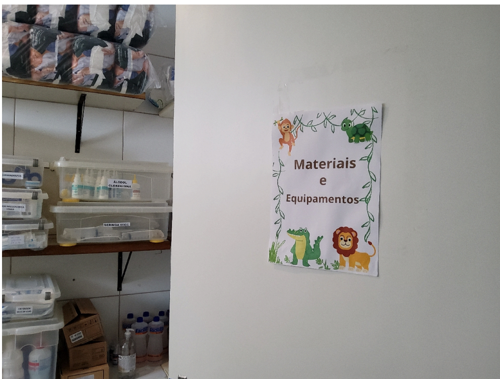
Depósito de equipamentos e materiais