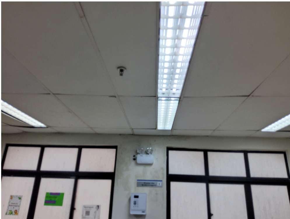
Ambiente com conforto térmico