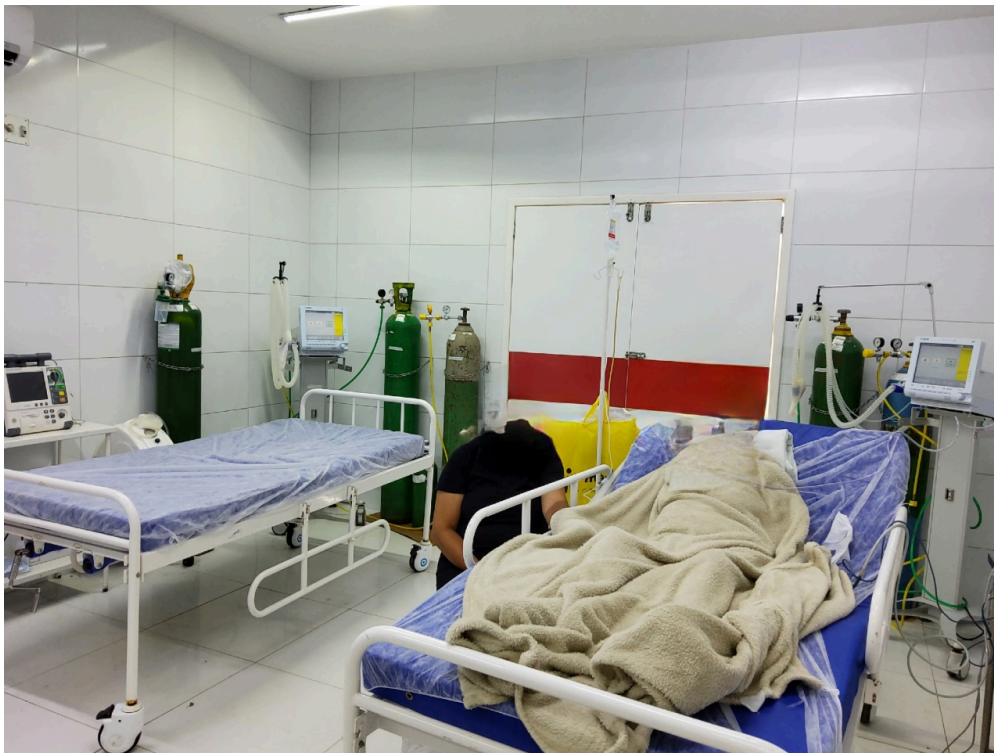
Sala vermelha adulto (foto 1)