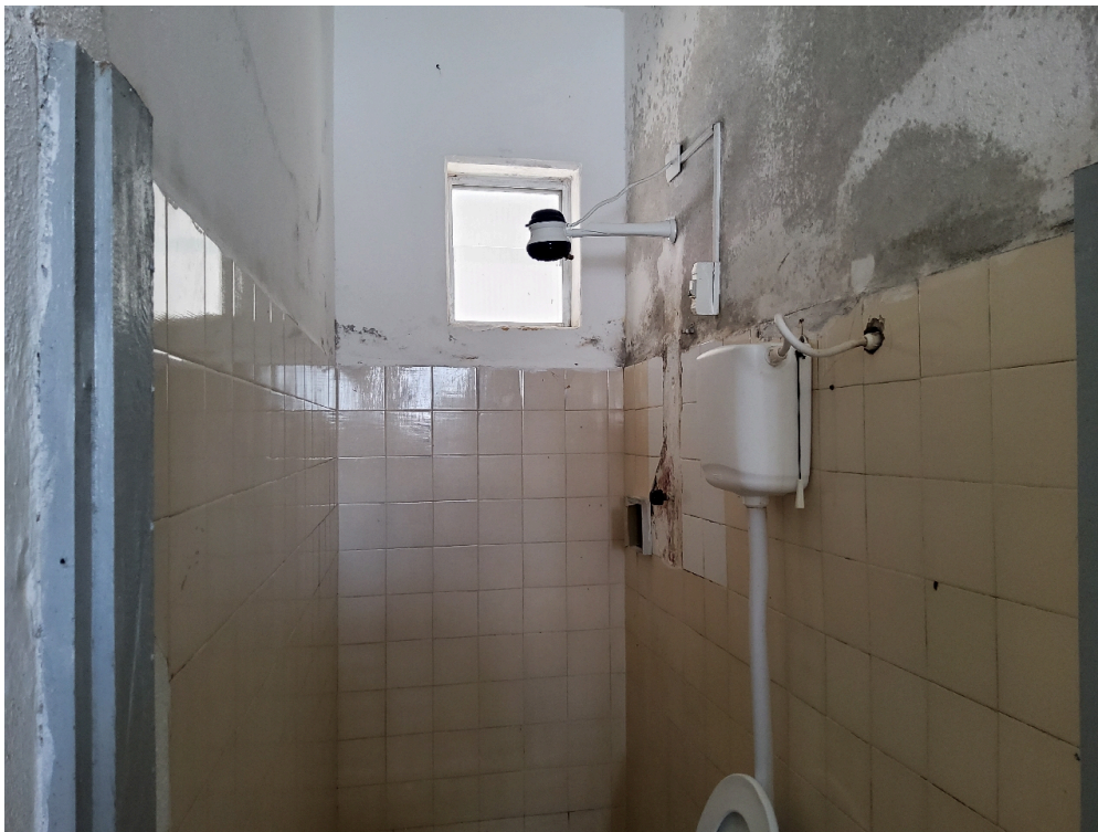
Banheiro da enfermaria (observar infraestrutura precária)