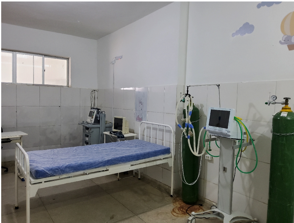
Sala vermelha pediátrica