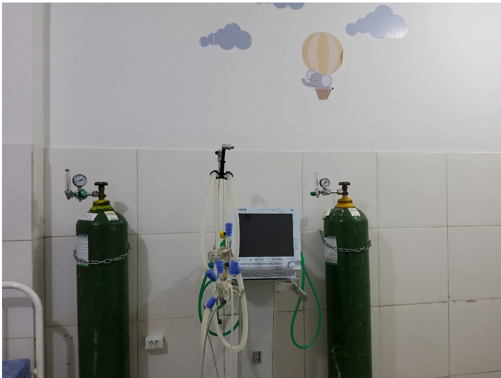
Respirador e oxigênio da sala vermelha pediátrica