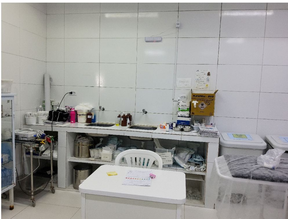
Sala vermelha adulto (foto 2)