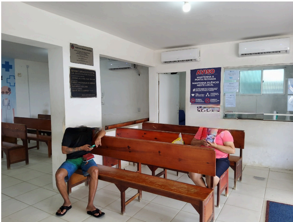
Recepção e sala de espera