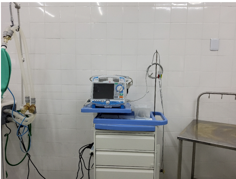
Desfibrilador do bloco cirúrgico