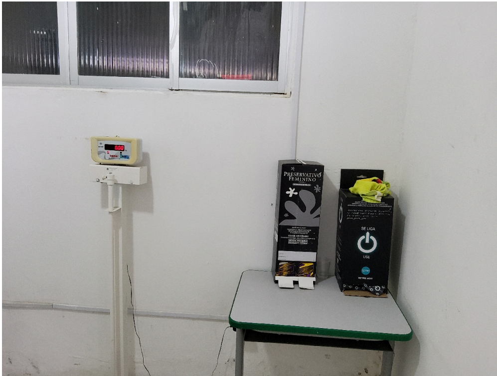
Classificação de risco (foto 2)