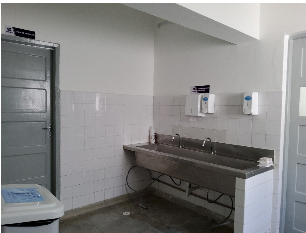
Lavabo do bloco cirúrgico