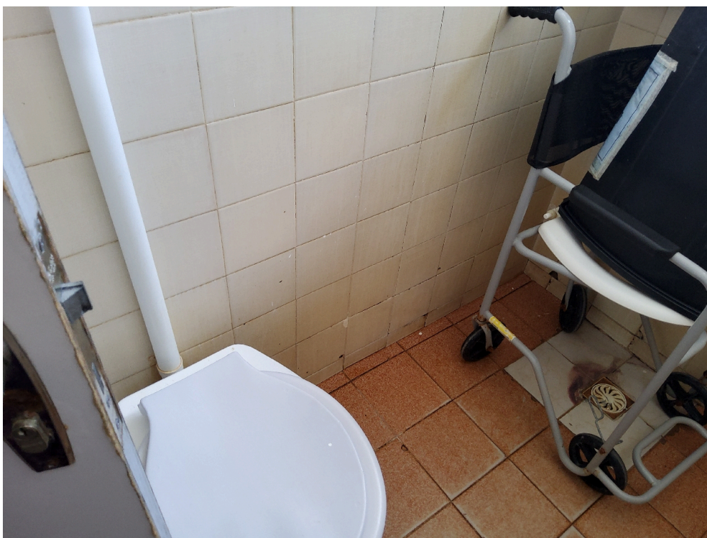
Banheiro da enfermaria (foto 2)