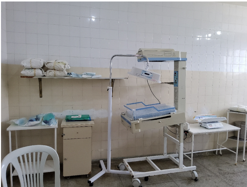
Sala de parto (foto 2)