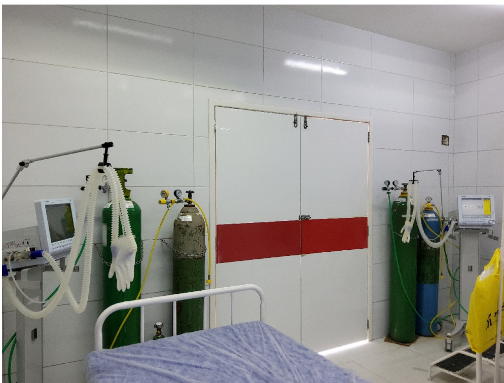
Respiradores e oxigênios da sala vermelha adulto