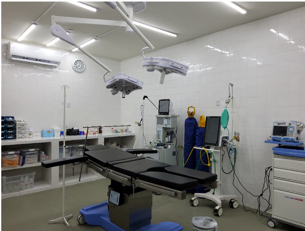
Sala de cirurgia