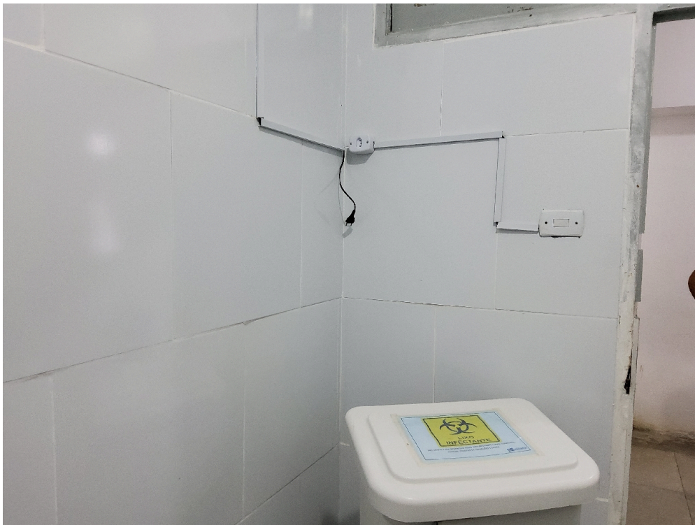
Sala de procedimentos (foto 2)