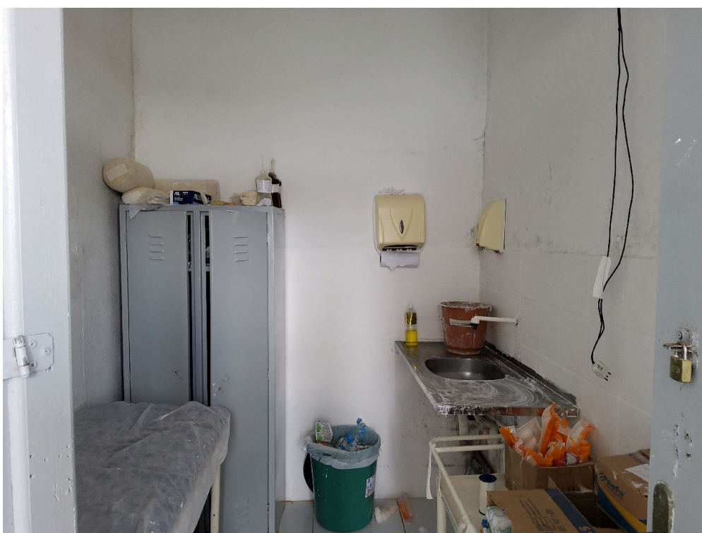
Sala de gesso