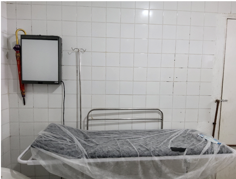
Consultório médico (foto 2)