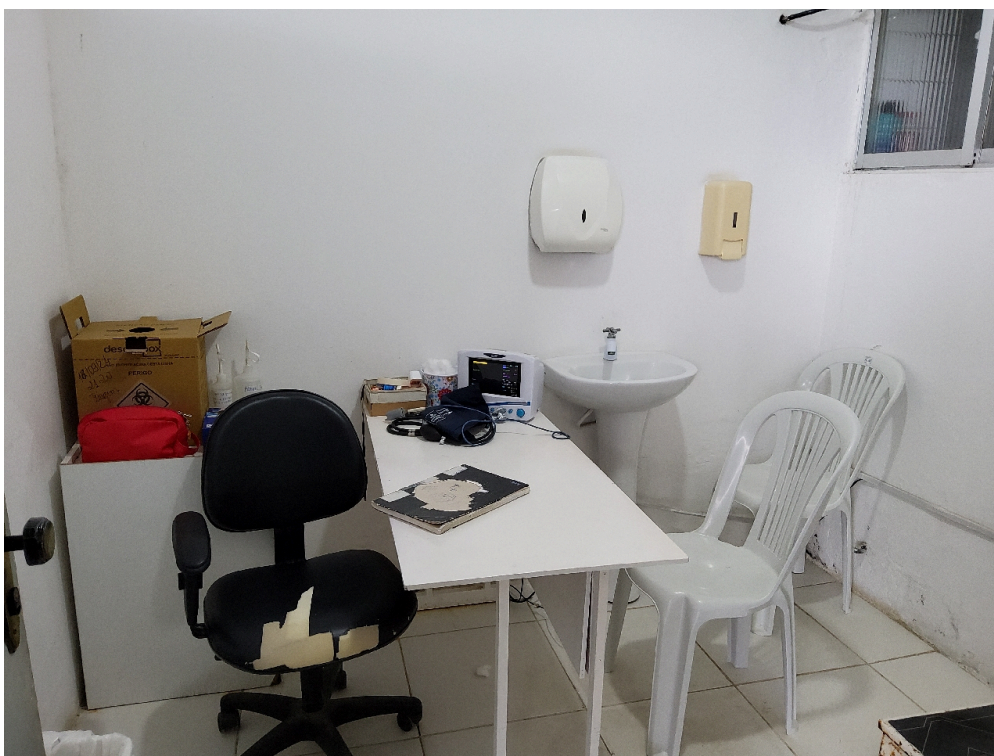
Classificação de risco (foto 1)