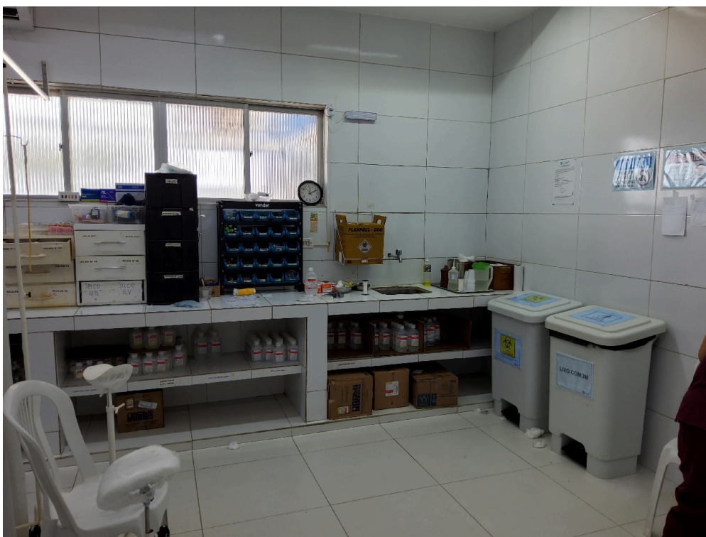
Sala de medicação