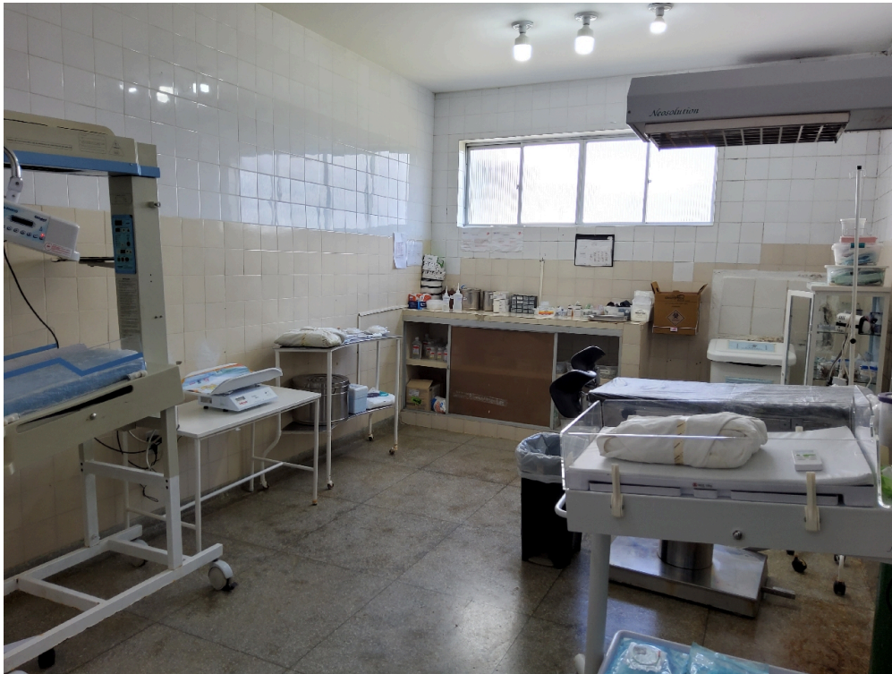
Sala de parto (foto 1)