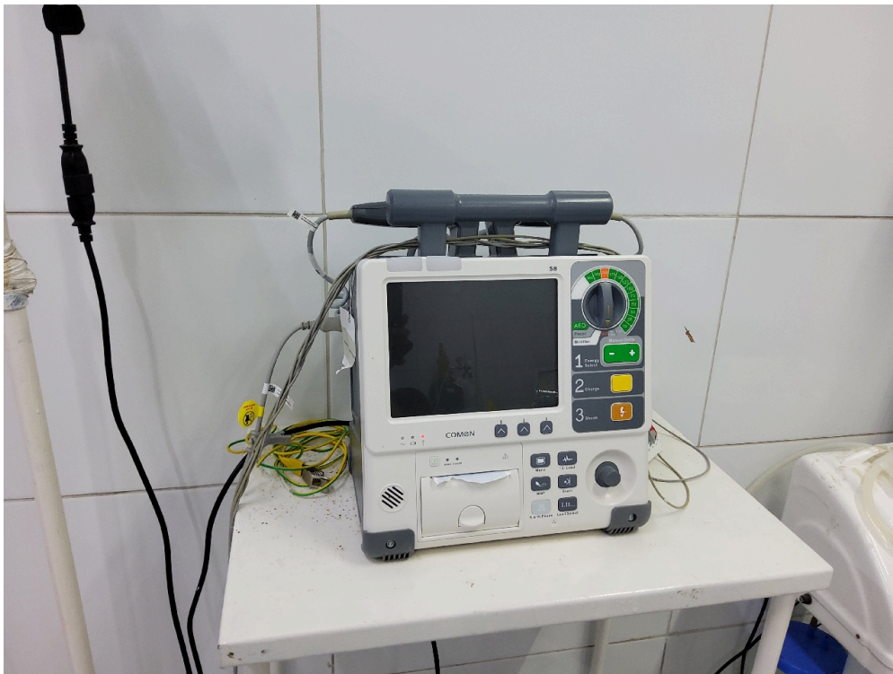
Desfibrilador da sala vermelha adulto