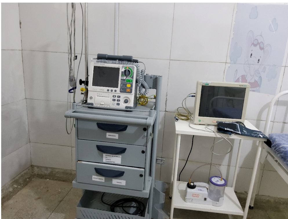
Desfibrilador e monitor multiparâmetros da sala vermelha pediátrica