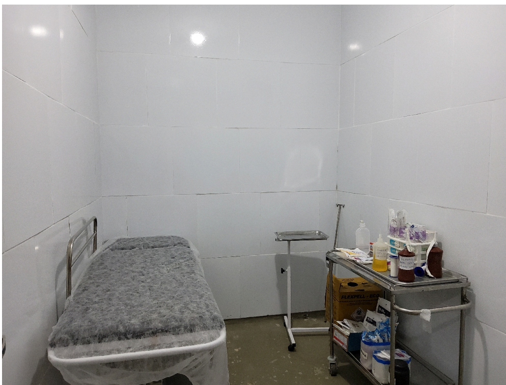
Sala de procedimentos (foto1)