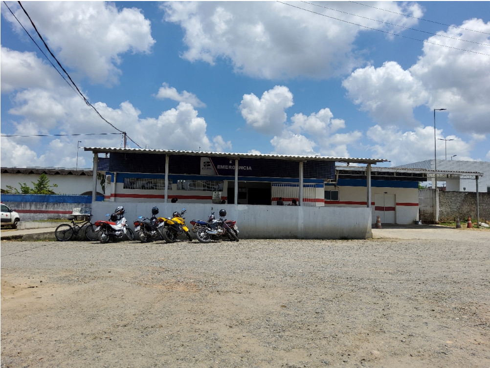
Hospital Dr. Benévolo Wanderley do Amaral