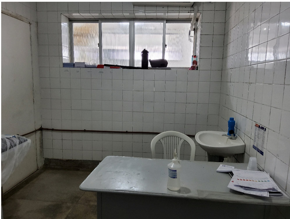
Consultório médico (foto 1)