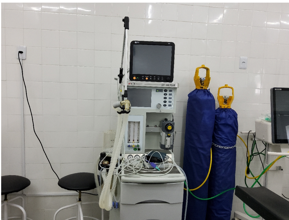
Carrinho de anestesia