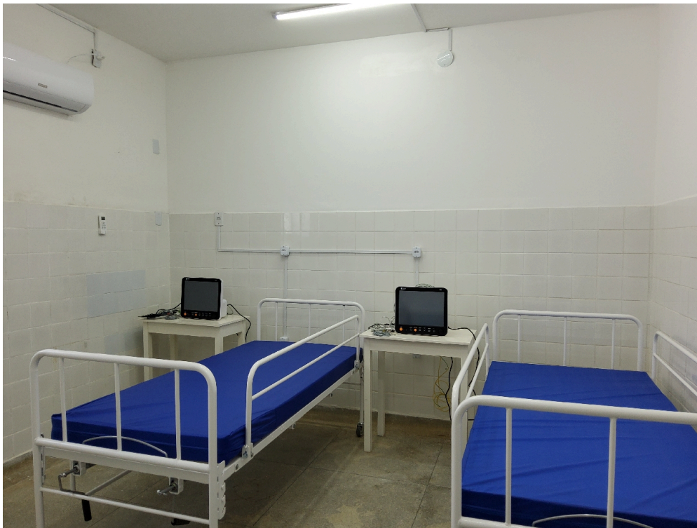
Sala de recuperação pós-anestésica