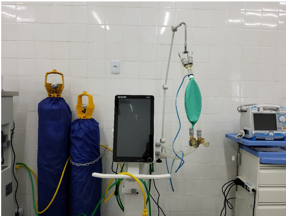
Respirador do bloco cirúrgico