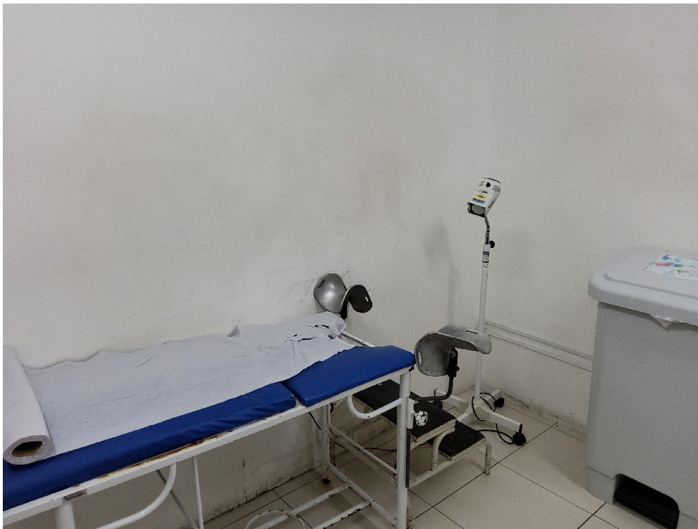
Consultório ginecológico (foto 2)