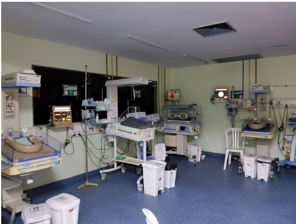
UCI externa (foto 1)