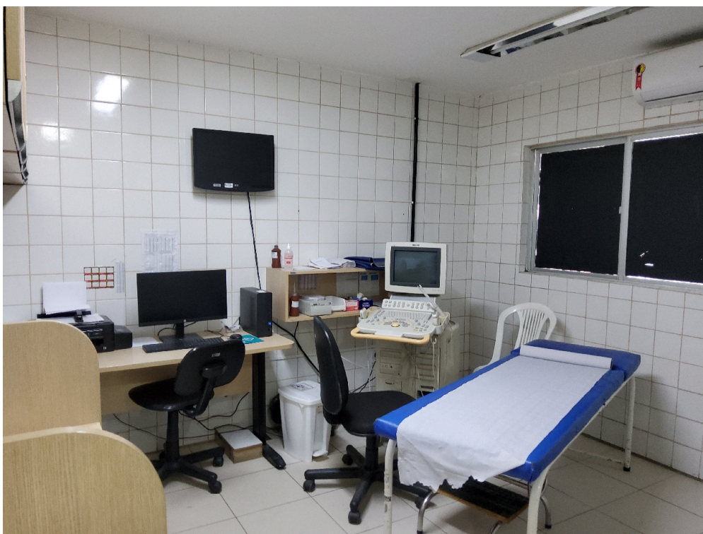
Sala de ultrassonografia