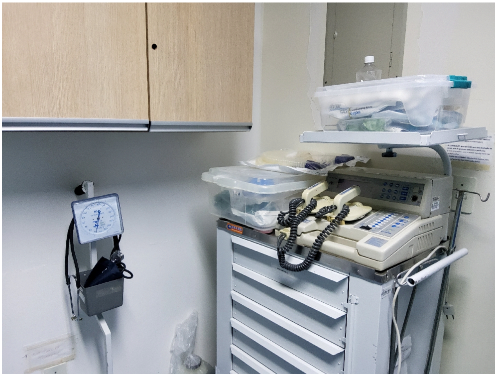
Carrinho de parada da SRPA e sala de parto