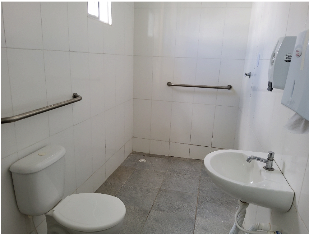
Consultório ginecológico (foto 4)