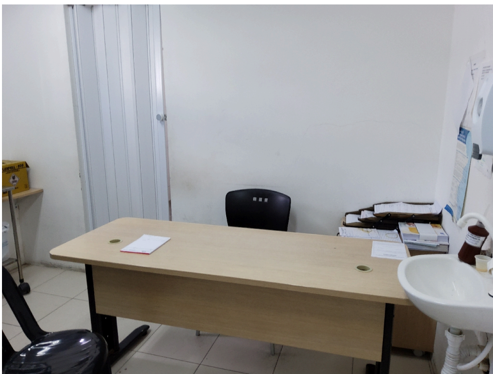
Consultório ginecológico (foto 1)