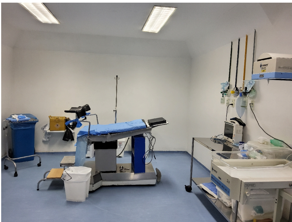
Sala de parto normal (foto 1)