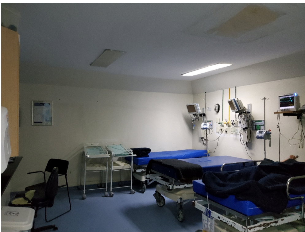
Sala de recuperação pós-anestésica