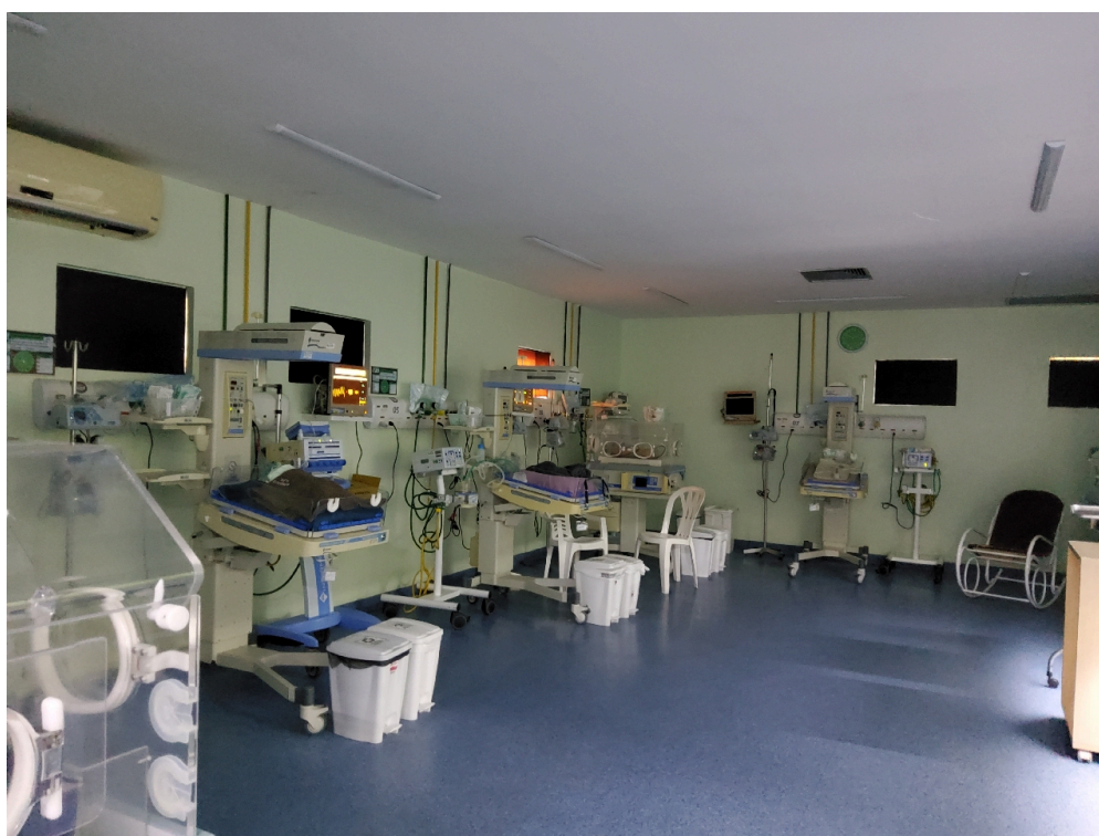
UCI interna (foto 2)