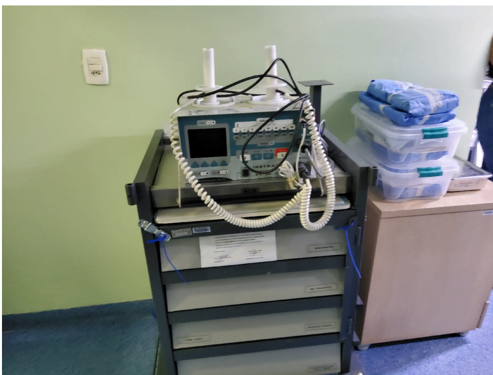
Carrinho de parada da UCI externa