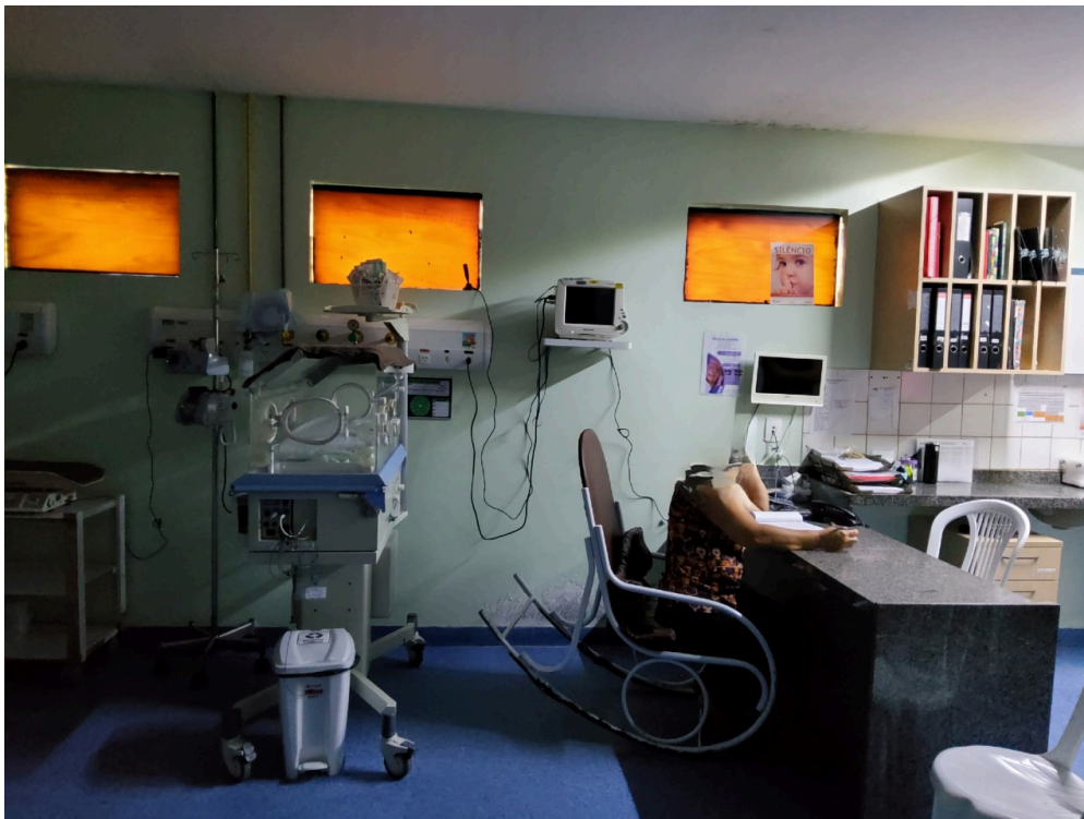
UCI externa (foto 2)