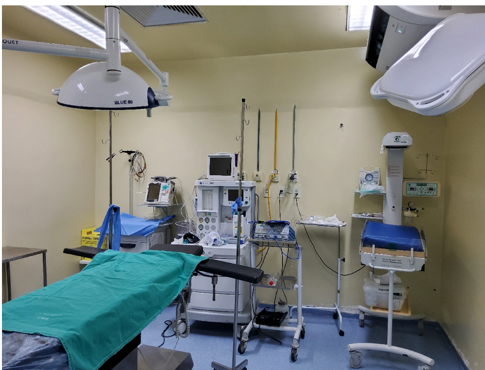
Sala de cirurgia