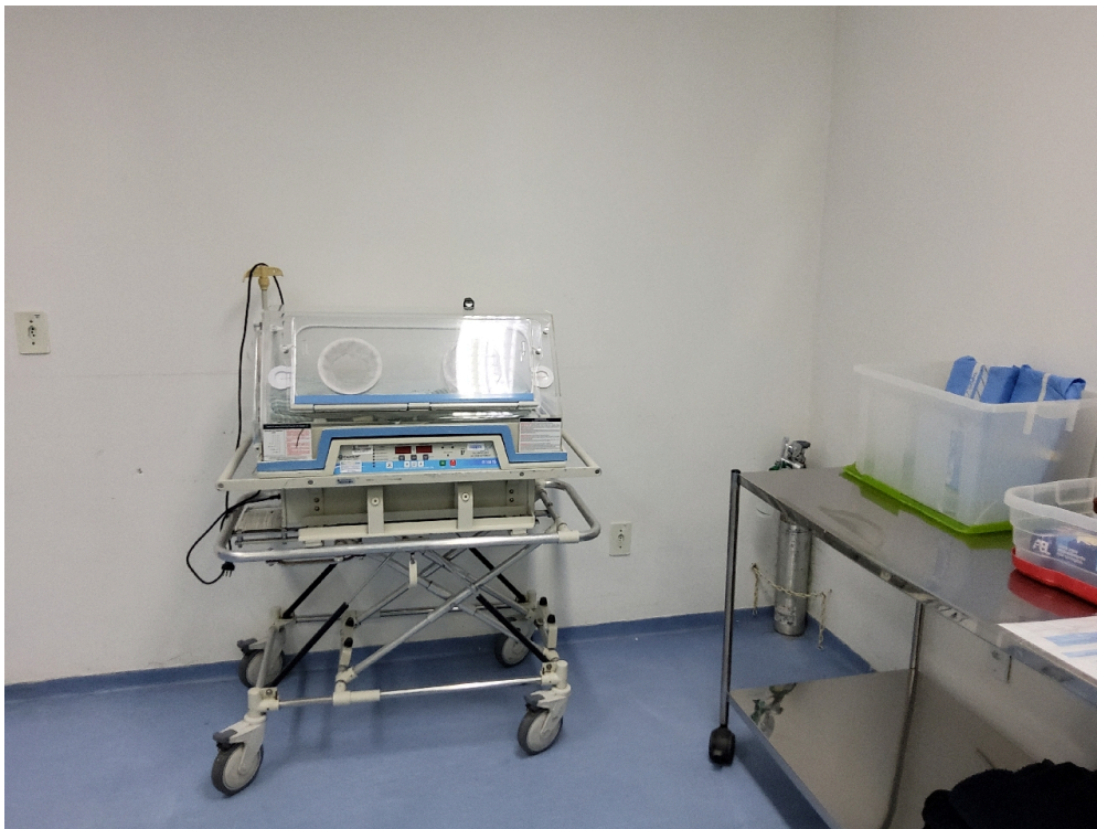
Sala de parto normal (foto 2)