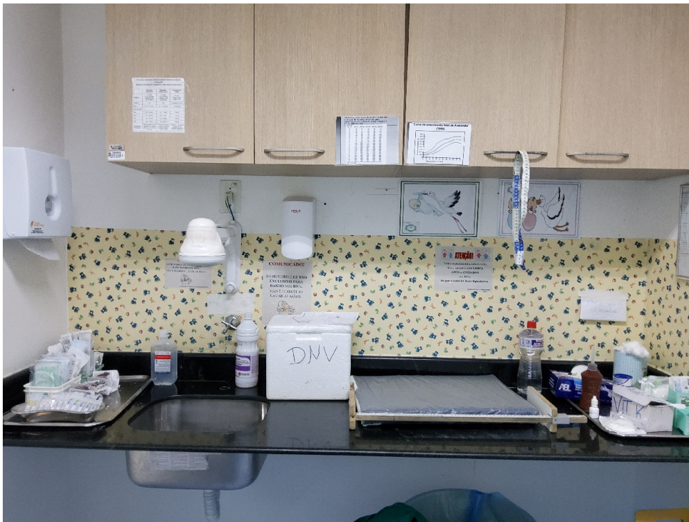
Sala de assistência ao recém-nascido (foto 2)