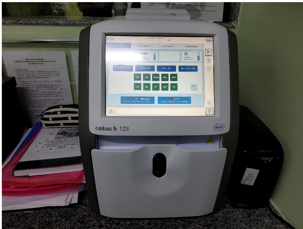
Gasímetro da UCI