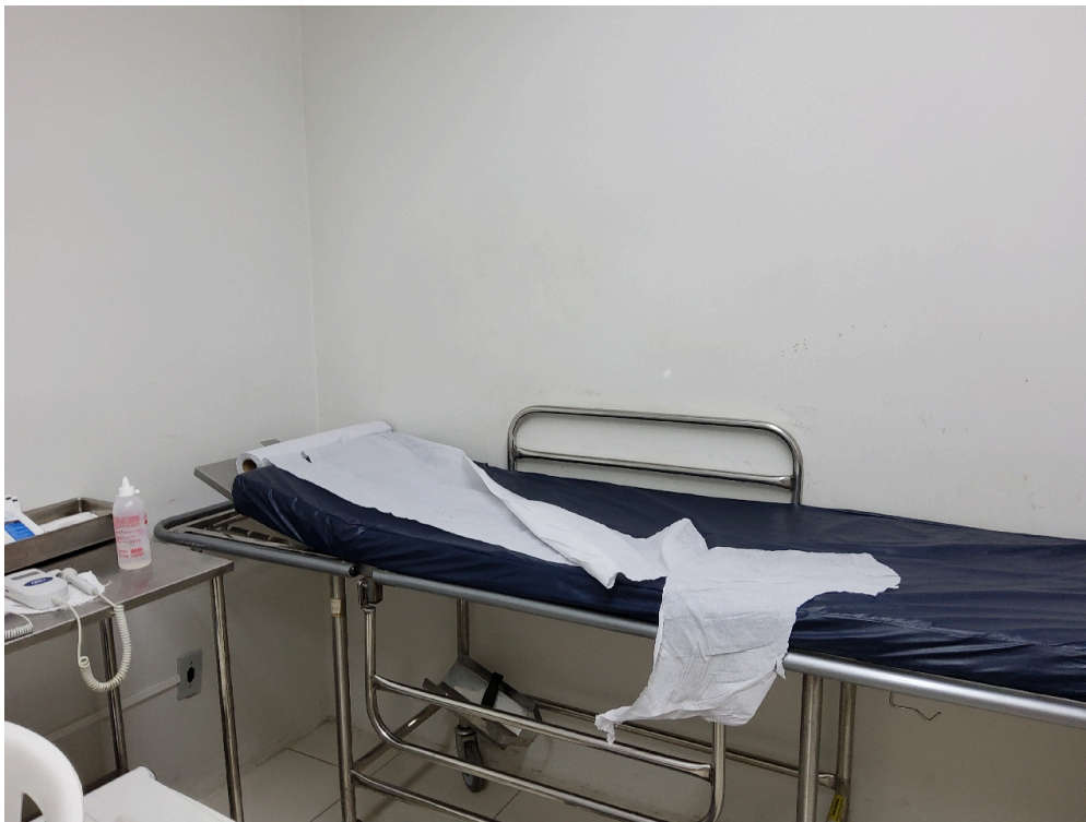
Classificação de risco (foto 2)