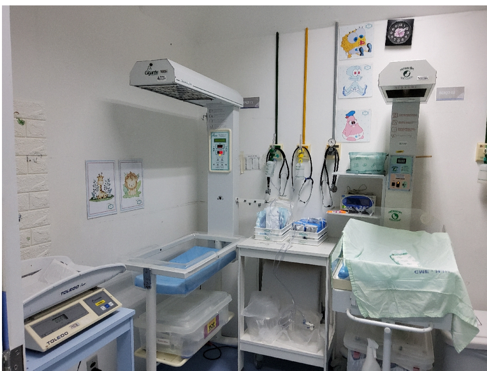
Sala de assistência ao recém-nascido (foto 1)