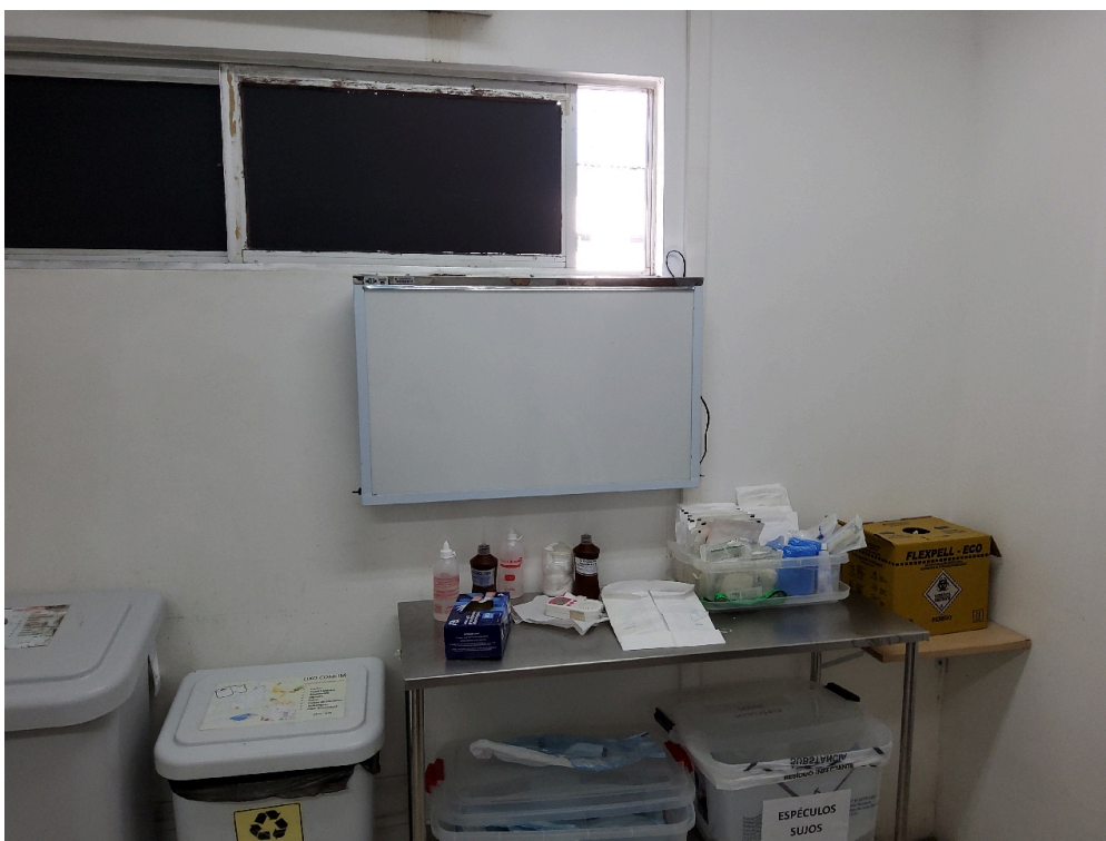
Consultório ginecológico (foto 3)