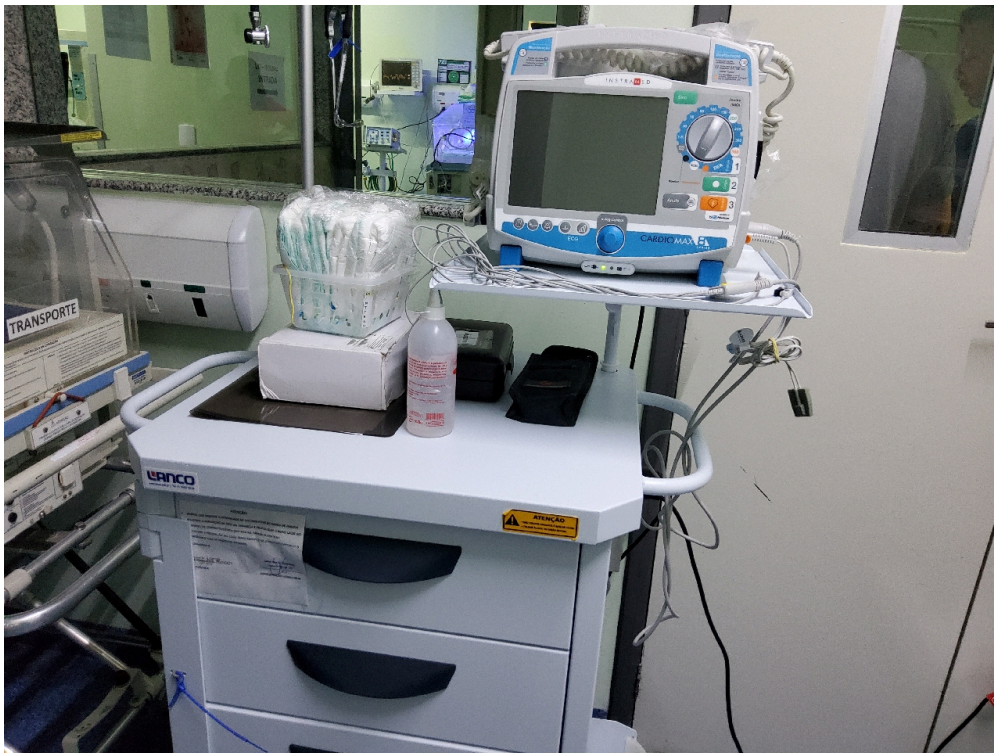
Carrinho de parada da UCI interna