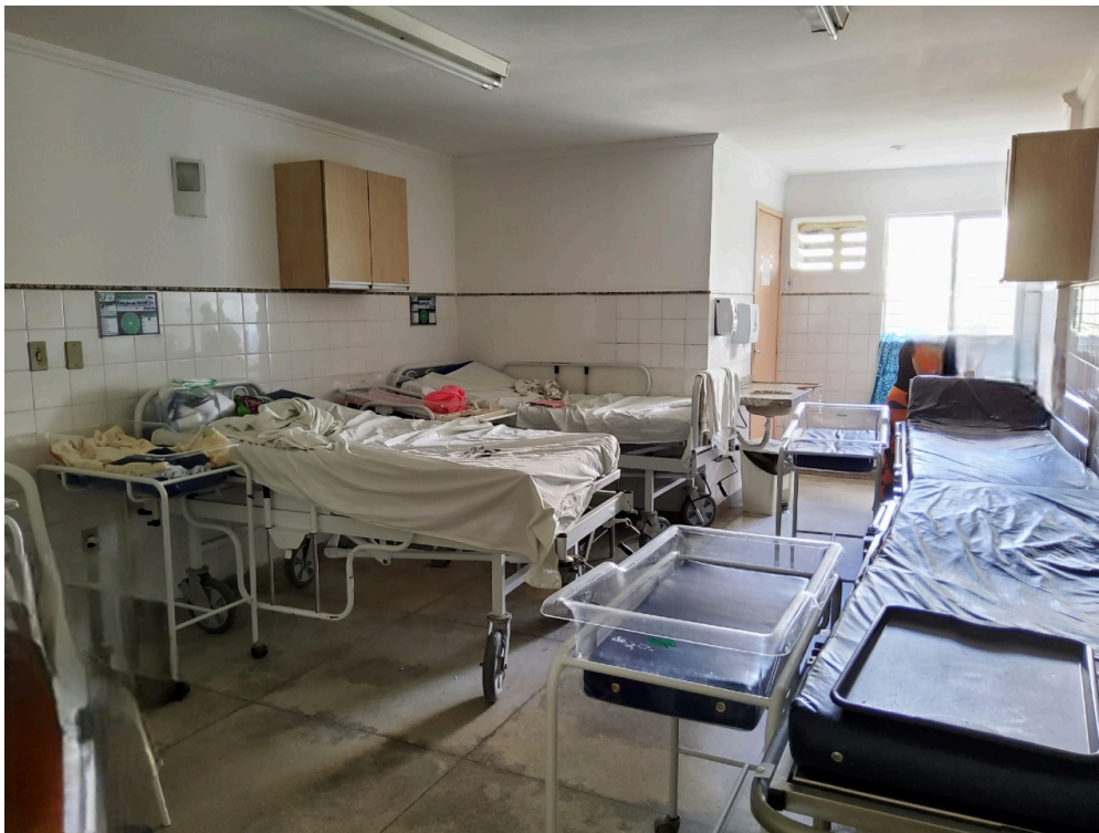
Enfermaria (observar macas extras)