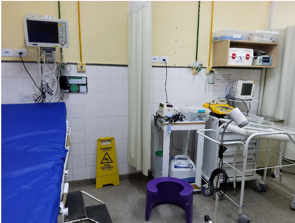
Leito de emergência do pré-parto