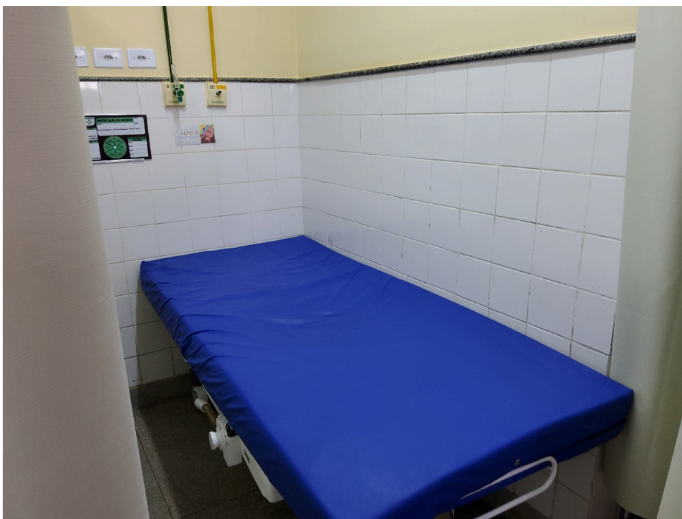
Leito de pré-parto